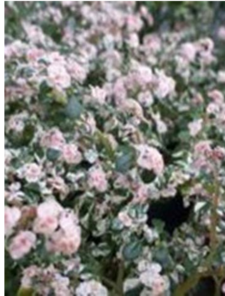
horticulture 5