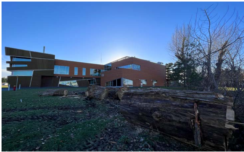
L'IRDA entend disposer du bois des arbres de manière responsable.

L'IRDA entend disposer du bois des arbres de manière responsable. Les troncs et les branches ont été sectionnés, mais ce lundi matin, les vestiges de ces deux arbres sont encore sur le terrain.