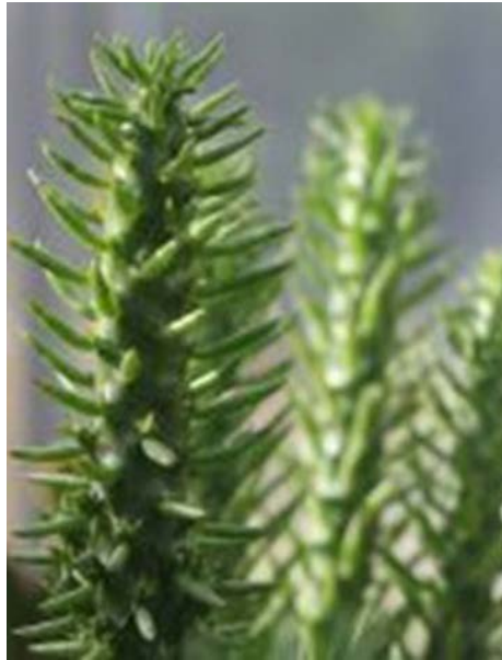
horticulture 1

Réal Scalabrini, membre de la Société d'horticulture et d'écologie de Saint-Bruno