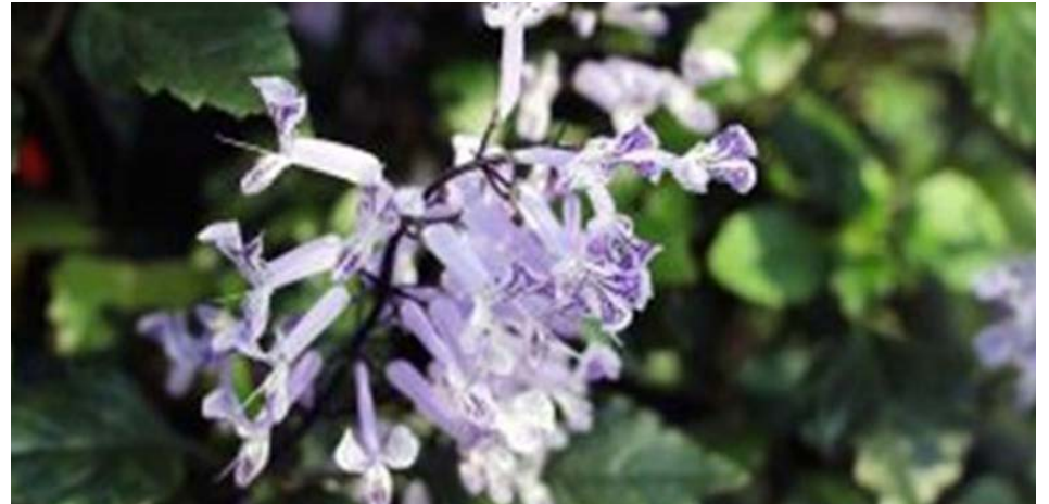
horticulture 3

Enlevez les fruits les plus rouges pour encourager la plante à en produire d'autres. Une fois retirés de la plante, vous pouvez les laisser