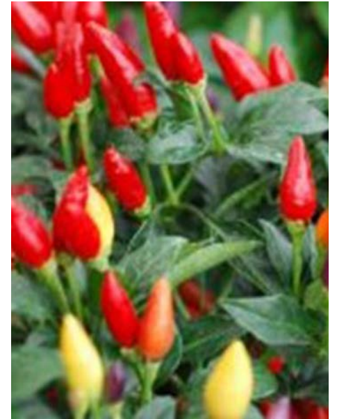
horticulture 2

Au cours des dernières années, ma chronique de novembre ou de décembre a traité à quelques reprises du populaire poinsettia, de l'amaryllis, du cactus de Noël, du cyclamen des fleuristes ou de Perse, de la gaulthérie couchée ou thé des bois, du houx, de la kalanchoé de Noël, des broméliacées tropicales, de la calathéa d'Amazonie et de la rose de Noël. Cependant, il existe plusieurs autres variétés de plantes qui peuvent être tout aussi intéressantes à offrir ou à ajouter à votre décor thématique du temps des Fêtes.