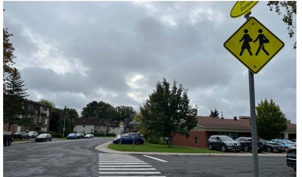
La fresque de rue passerait de la rue Cadieux à la rue du Général-Vanier.