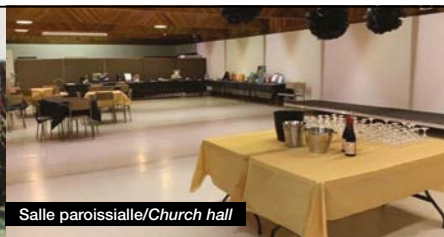
Salle paroissiale/Church hall

Église catholique St. AUGUSTINE of CANTERBURY à Saint-Bruno Unité pastorale anglophone de Saint Jean Paul II