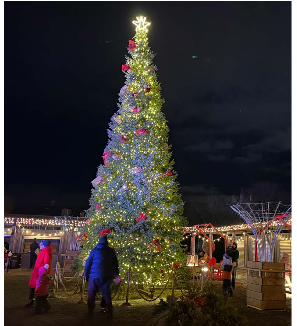
Le sapin de Noël géant sera de retour à Saint-Bruno-de-Montarville le 16 novembre, avant son illumination le 25 au soir.

Afin d'inviter les citoyens à magasiner dans les commerces qui ont pignon sur rue à Saint-Bruno et à offrir des produits locaux pour Noël, l'ambiance sera à la fête à la place du Village. Du 25 novembre au 4 janvier, des foyers, de la musique en continu et des dominos lumineux géants animeront le centre-ville. Les commerçants, eux, ont eu la consigne que la thématique décorative, cette année, était le rouge et le blanc. « Profitez-en pour magasiner dans nos com-