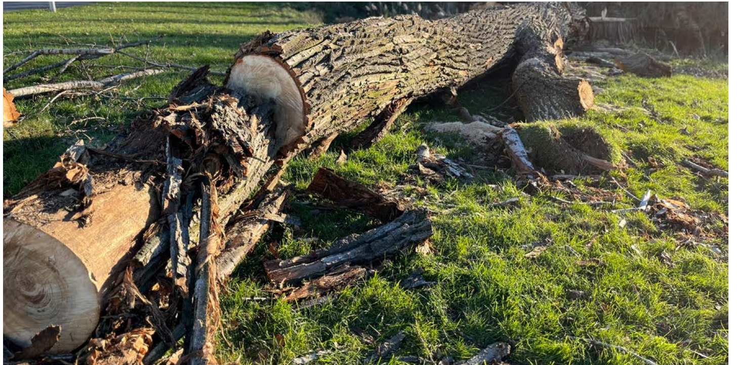
Les arbres ont été abattus parce qu'ils étaient dangereux pour les employés et le bâtiment.