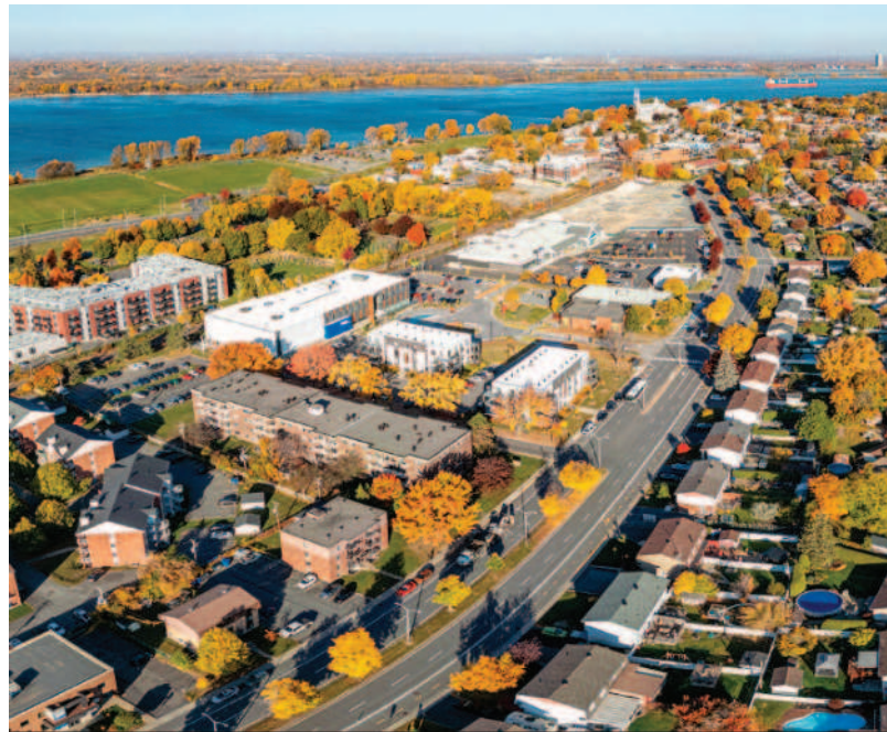
Varennes est l'un des leaders de cette croissance puisque la ville a enregistré une hausse de près de 1 000 emplois supplémentaires, soit la plus forte de toute la MRC.

Pour sa part, Varennes est l'un des leaders de cette croissance puisque la ville a enregistré un bond de 10,7%, soit 983 emplois supplémentaires, ce qui constitue la plus forte hausse de toute la MRC, alors que Contrecoeur a recensé 468 nouveaux postes en 2023.