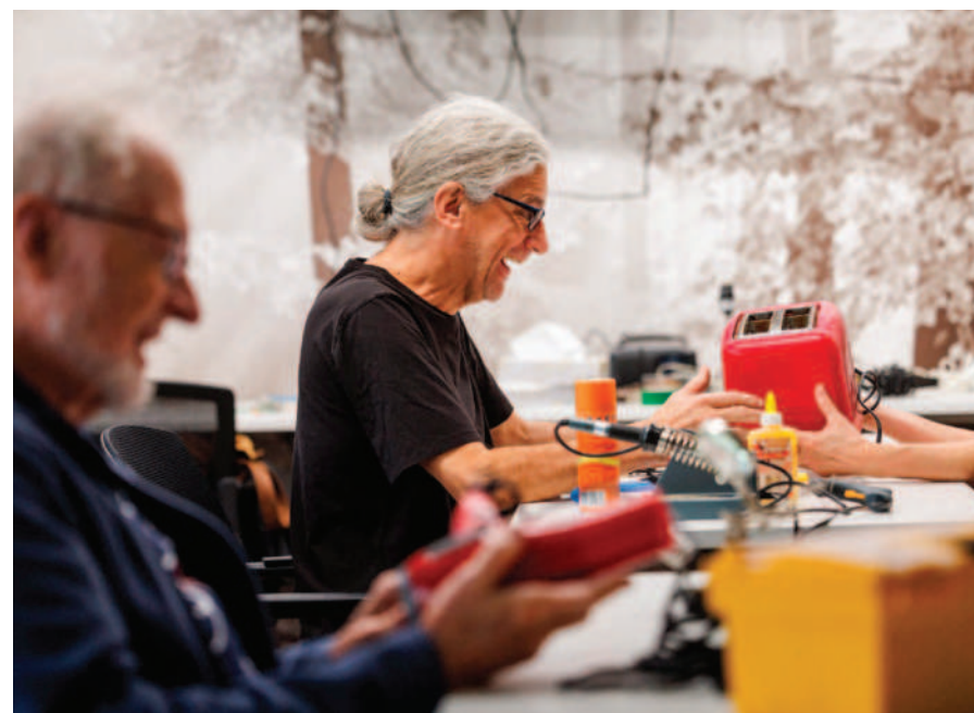
Les ateliers de réparation Rafistout se tiendront huit fois dans l'année, soit le dernier dimanche de chaque mois, sauf en décembre.

L'engouement pour Rafistout témoigne d'une prise de conscience collective face aux enjeux environnementaux, explique le CABB. Lors des ateliers de l'automne dernier, les membres du conseil d'administration de l'organisme ont été impressionnés par le nombre de participants et leur enthousiasme à sauver leurs objets des sites d'enfouissement.