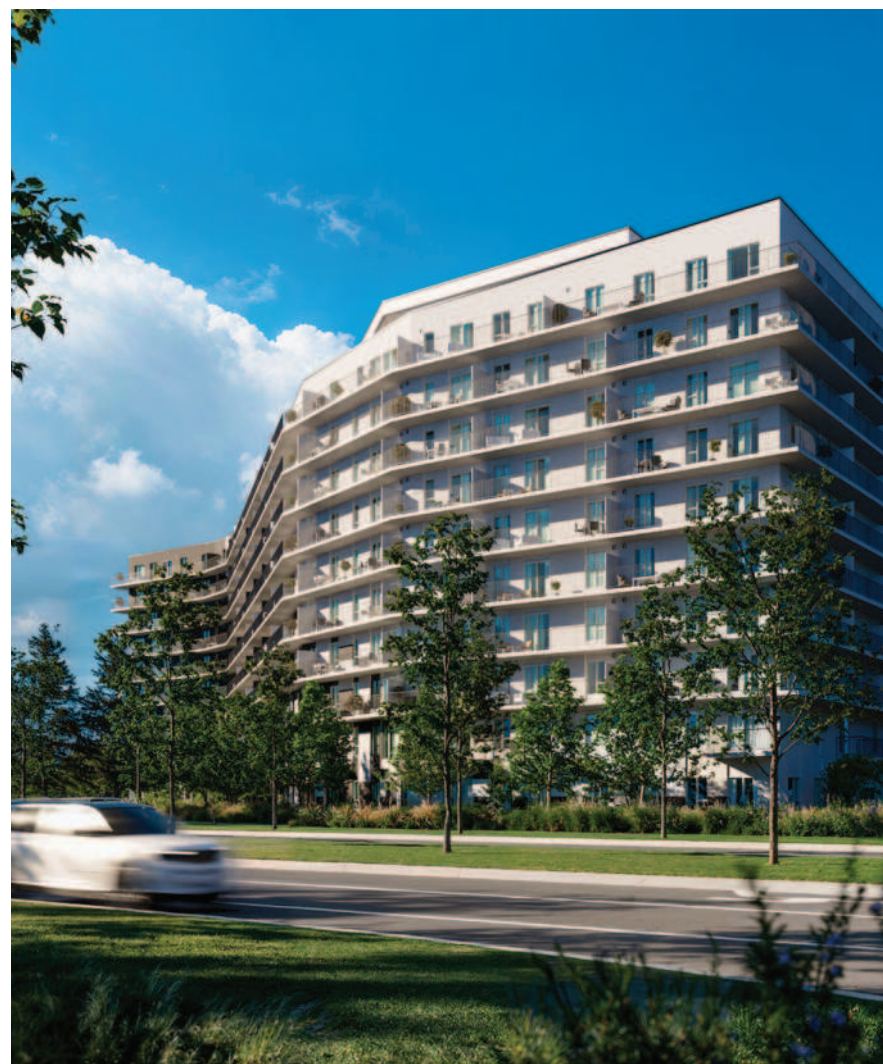
Le projet est situé à proximité du stationnement incitatif et il comprendra 263 logements sur 10 étages, dont une quarantaine de logements abordables.

Le maire lui a alors répondu: « C'est ça une soirée d'information, c'est que le promoteur est là, il répond aux questions, prend note des commentaires des citoyens et par la suite, s'il y a des modifications à faire, il y aura des modifications à faire. Autrement, on n'en ferait pas de ces séances d'information. »