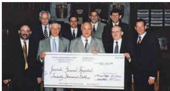
La congrégation Shomrim Laboker Beth Yehuda Shaare Tefillah a fourni du soutien à la néonatalogie.