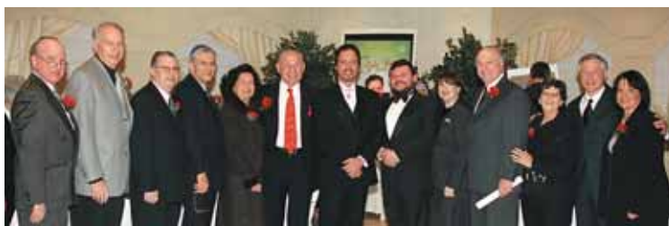
La congrégation Chevra Kadisha B'nai Jacob Beth Hazichoron a fait l'acquisition d'équipement diagnostique pour la Division de gastroentérologie.