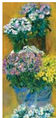
Des cartes de vœux pour Pesach.

Pesach est le moment idéal pour envoyer vos vœux les plus chers à votre famille, vos amis et vos associés. Or, pour exprimer votre gratitude, rien de mieux que de contribuer à la Fondation tout en favorisant le bien-être de la collectivité.