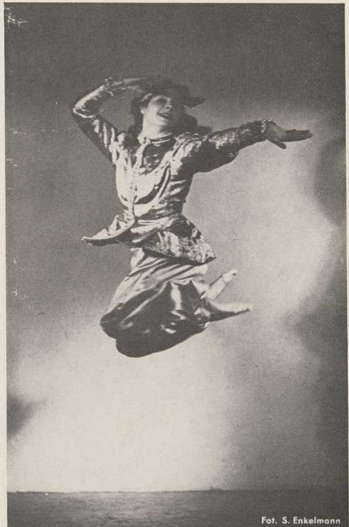
Fot. S. Enkelmann