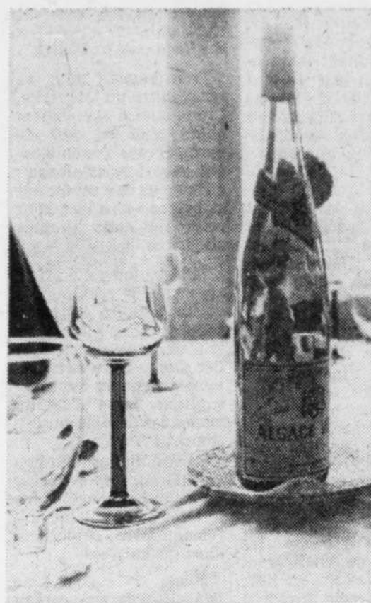
Les vins d'Alsace gagnent de la popularité au Québec alors qu'ils ont vu leurs ventes doubler en cinq ans. Contrairement aux autres vins de France qui sont également des Appellations Contrôlées, le vin d'Alsace porte le nom du cépage et non du lieu de production. Il se sert frais, comme les vins blancs, dans un verre "alsace" comme le montre la photo à gauche, soit un verre à tige verte et à ballon blanc.

L'alternance des plats et des vins est importante, de même qu'une gradation, commençant par des vins de moins grande qualité pour terminer par de plus grands crus.