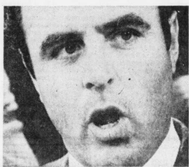
Le ministre des Postes Jean-Jacques Blais.

Les observateurs ne s'attendent pas à ce qu'il y ait déblocage dans les négociations avant encore quelques jours. Celles-ci doivent se poursuivre de façon intensive durant toute la fin de semaine.