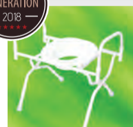
Chaise d'aisance multifonction Facili-TM