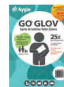
Gants de toilette