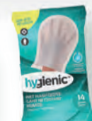
Gants nettoyants humides