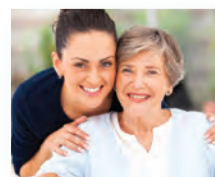
Au cœur des soins à domicile