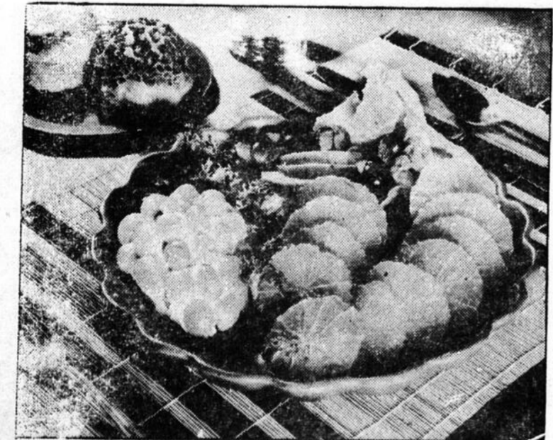
Si le rafraichissant qui aura sa place au menu des fêtes. Oranges, pêches, raisins, dattes, sur lit de laitue, assaisonné de mayonnaise. La grappe de raisin est formée d'une demi-pêche qu'on a couverte de fromage à la crème et de raisins sans grains fixés dans le fromage. (Photo Sunkist).