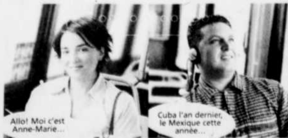
Allô! Moi c'est Anne-Marie...

En tournée à la suite de la sortie de son deuxième album, Nicolas Guimont sera de passage dans la capitale le temps d'un spectacle. Ayant adopté une facture résolument rock après un premier disque à saveur folk, le jeune artiste de Cap-Saint-Ignace, non loin de Montmagny, propose une musique dont les accents varient du blues au ska-punk. Ses plus récents extraits, Mon monde et La Nuit en ville , ont fait leur bout de chemin dans les palmarès. Au public maintenant de le découvrir, le 3 février, à la salle Albert-Rousseau.