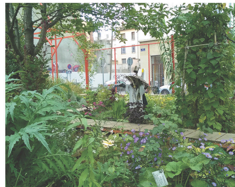
Au départ, le projet de l'îlot d'Amaranthes comprenait la serre, le potager, les arbres et la prairie. S'est ajouté récemment le jardin de Cluzan, consacré à la permaculture.

La communauté urbaine de Lyon compte 1 282 000 habitants sur un territoire de 51 500 hectares, dont la moitié est constituée d'espaces naturels et agricoles. Dès 1994, le Grand Lyon a intégré la protection de sa trame verte dans les différents documents d'urbanisme, tels le schéma de