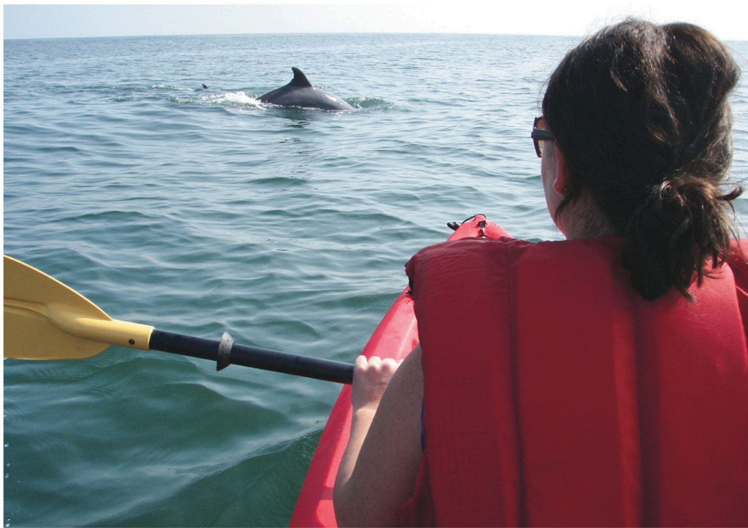
Une virée en kayak permet d'observer de près des dauphins.

Il y a plusieurs excursions à faire dans les environs — pour visiter les phares de Cape Henry et les sentiers du First Landing State Park notamment.