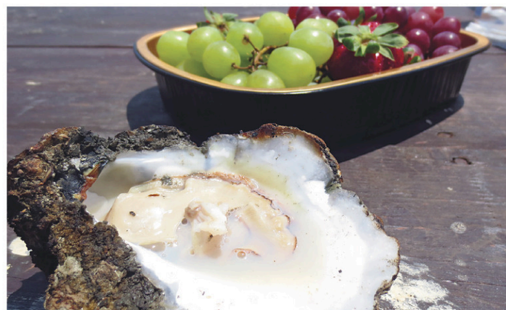
La région de Virginia Beach produit les huîtres Lynnhaven.

Les huîtres et les vins font l'objet d'itinéraires comme l'Oyster Trail. La Virginie possède un des meilleurs terroirs maritimes au monde pour la production d'huîtres. La région de Virginia Beach produit les huîtres Lynnhaven, une des sept variétés virginiennes. La Pleasure House Oyster Farm de Virginia Beach a adapté l'expérience bretonne de la récolte-dégustation d'huîtres, et c'est rapidement devenu un des plus puissants produits touristiques de la Virginie.