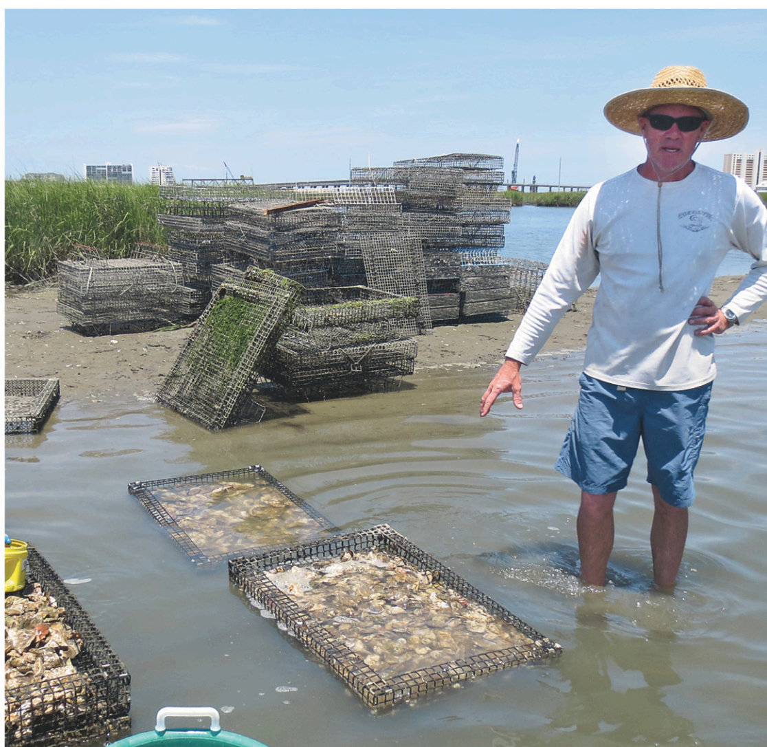
La Pleasure House Oyster Farm de Virginia Beach a adapté l'expérience bretonne de la récolte-dégustation d'huîtres.

Ce reportage a été écrit à la suite d'un voyage fait à l'invitation de l'office du tourisme de Virginia Beach.