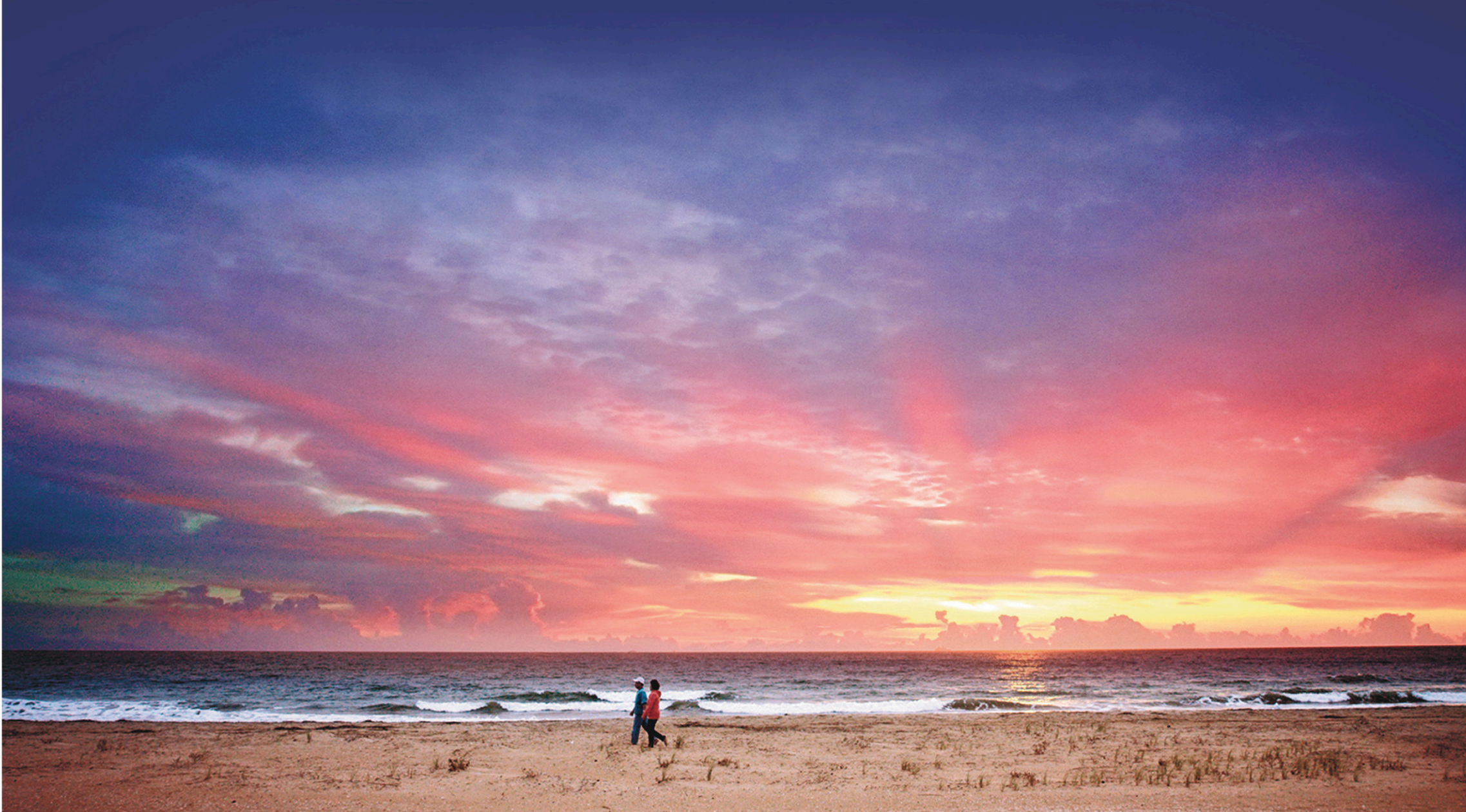
Coucher de soleil sur la Sandbridge Beach, qui s'avère idéale pour apprécier la nature en toute sérénité, loin des foules.

CAHIER D > LE DEVOIR, LES SAMEDI 16 ET DIMANCHE 17 JUILLET 2016