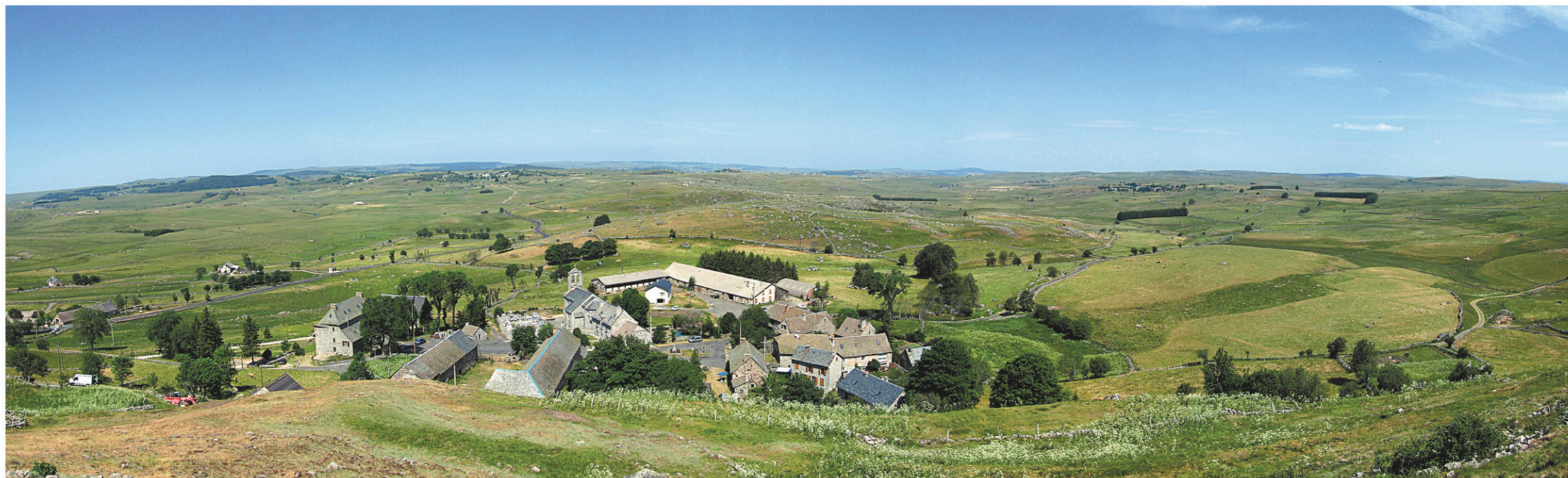
Paysage entre ciel et nature, l'Aubrac n'est pas une destination touristique ordinaire. Pour venir ici, il faut aimer le vide, le silence, la solitude.

Il n'y a pas de saison pour découvrir l'Aubrac. Toutes sont merveilleuses. Toutes sont capricieuses. Au printemps, les prairies se couvrent de fleurs par millions : aucune région d'Europe n'en compte autant de variétés au mètre carré — on y trouve même des plantes carnivores.