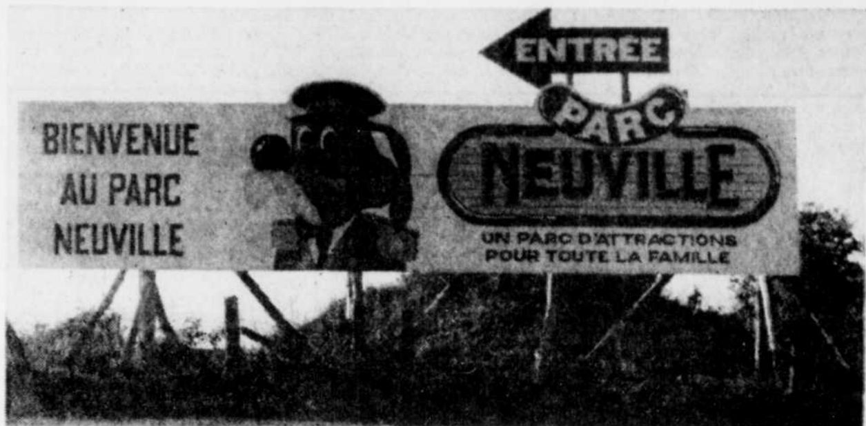
Le parc Neuville n'a fait qu'une saison.

Il avait complété l'année 1982 sous l'ancien nom, mais avait changé le thème et le nom du parc en 1983.