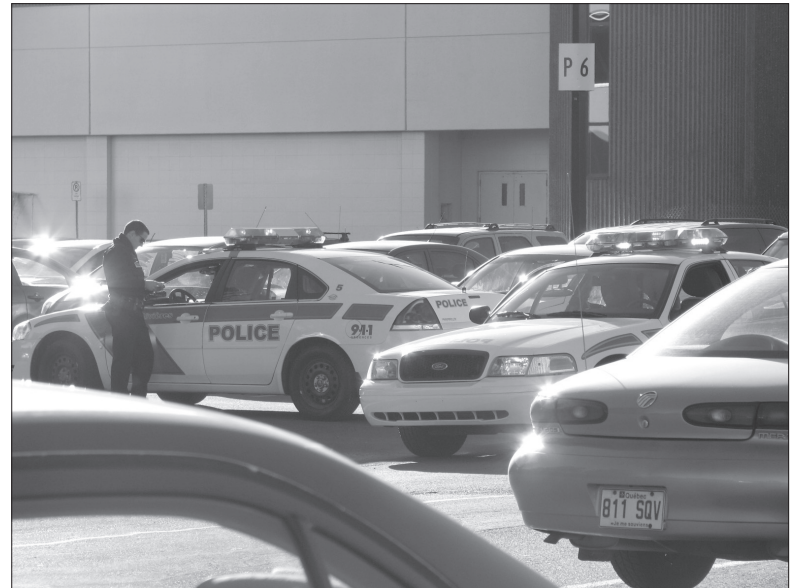
Patrouille policière sur le campus.

Les policiers ont donc constaté quelques faits qui sonnent une alarme. Attention à ne pas laisser des objets de valeurs à la vue, cela incite les voleurs! De même, assurez-vous de bien avoir verrouillé toutes vos portières et votre valise et que vos