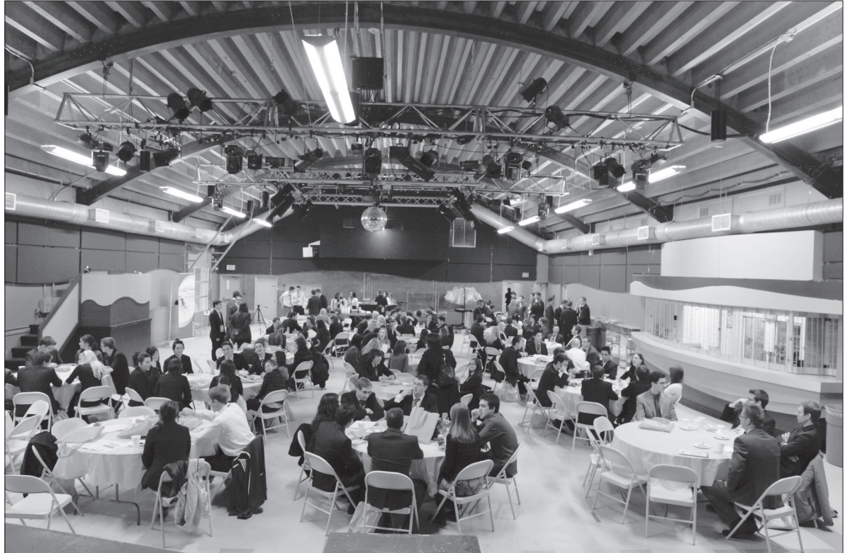
Photo: Place à la relève en gestion

Au total 43 équipes de trois participants, représentant 12 cégeps québécois, se sont livrées une compétition serrée. Toutes les équipes disposaient d'une période de trois heures pour préparer leur simulation et de 15 minutes pour en faire la présentation devant un panel de juristes, composé d'experts et de professionnels de la région. Au total, 22 juges se sont impliqués bénévolement. La période de préparation s'est déroulée sous les conseils de parrains et de marraines, étudiants de l'UQTR ayant vécu l'expérience offerte par les Jeux du Commerce. Heureusement, plusieurs dizaines