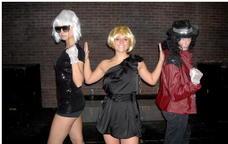
Lady Gaga, Madonna et Michael Jackson font partie des personnages célèbres de la musique du XXe siècle qui seront interprétés lors du spectacle.

Pour l'instant, rien est certain concernant les dates de présentations, mais le spectacle devrait avoir lieu à la fin du mois de mars ou au tout début du mois d'avril. La troupe offrirait deux représentations du spectacle dans la même journée, selon la demande. Le prix du billet devrait varier entre sept et dix dollars. Surveillez les publicités qui seront affichées un peu partout à l'UQTR quelques semaines avant le spectacle.