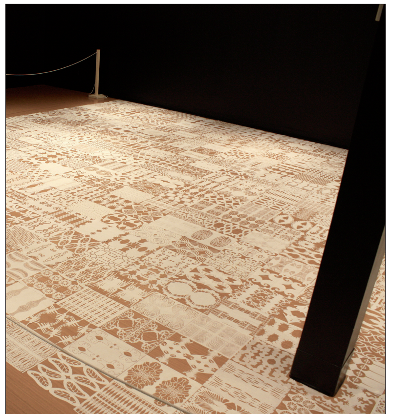
Plie, déplie, une œuvre de Yolande Harvey.

Les expositions Plie, déplie et Il était une fois des insectes et des hommes seront au Centre d'exposition Léo-Ayotte jusqu'au 19 décembre. Les heures d'ouverture du centre sont du samedi au mercredi, de 13h à 17h, les jeudis et vendredis de 13h à 20h ainsi que les soirs de spectacle. Ce centre d'exposition est situé dans le Centre des arts de Shawinigan, au 2100, boul. des Hêtres à Shawinigan.