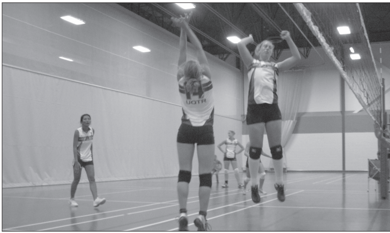
Une trentaine d'équipes s'affrontaient lors du premier tournoi amical des Patriotes.

Ouvert à tous, ce tournoi amical avait pour but de financer les futurs tournois des Patriotes. «On veut apprendre à se connaître davantage. Nous souhaitons faire des tournois ex-