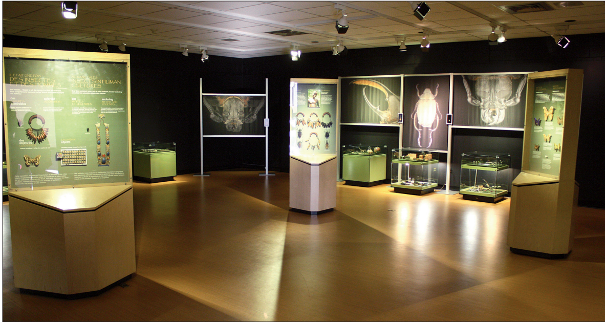
Il était une fois des insectes et des hommes, une exposition conçue par l'Insectarium de Montréal.