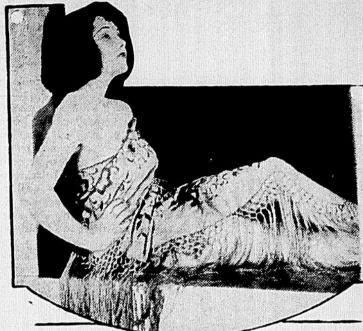
La jolie Audrey Ferris était à peu près inconnue, il y a un an. Quelques mois plus tard, elle remplissait des bouts de rôles et aujourd'hui, c'est une étoile consacrée très recherchée pour les premiers rôles.