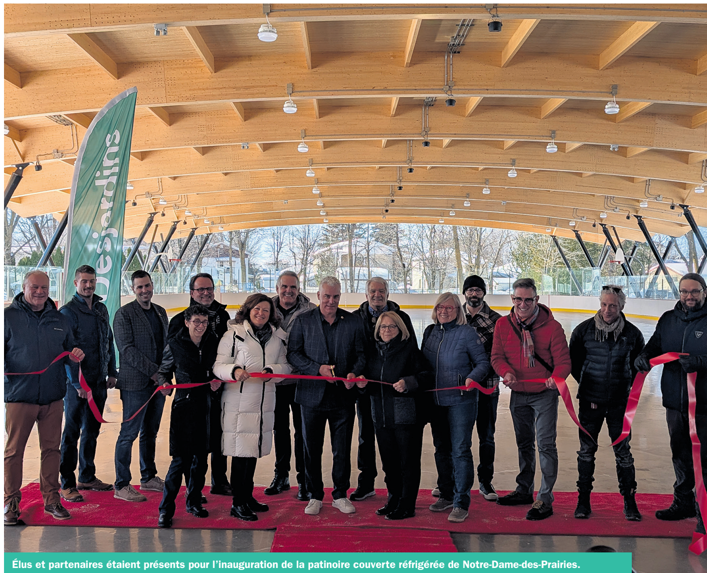
Élus et partenaires étaient présents pour l'inauguration de la patinoire couverte réfrigérée de Notre-Dame-des-Prairies.

Pour la mairesse de Notre-Dame-des-Prairies, Suzanne Dauphin, choisir le nom de celui qui a aussi été entraîneur-chef des Canadiens de Montréal pour l'apposer à la patinoire allait de soi. Alors qu'elle connaît Dominique Ducharme depuis longtemps, elle se dit toujours impressionnée de le voir s'impliquer pour sa communauté malgré les distances qui séparent sa ville d'adoption et sa ville natale. «À chacune