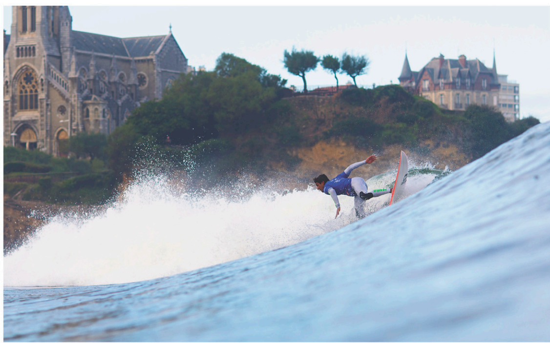
FÉDÉRATION FRANÇAISE DE SURF

Aujourd'hui, du haut de ses 80 ans, l'auteur Joël de Rosnay est le dernier de ces pionniers