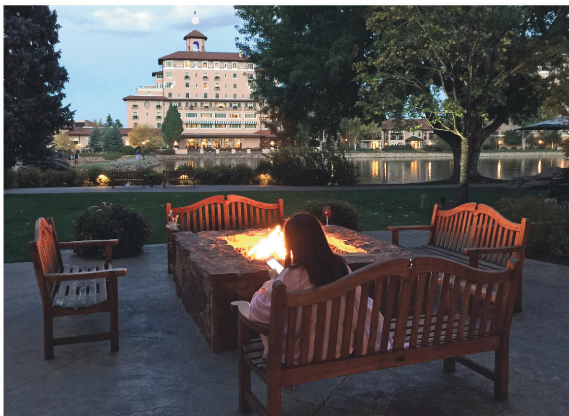
Colorado Springs: le Broadmoor, au pied du mont Cheyenne. En saison, 2000 personnes travaillent dans cet hôtel historique.

À propos, il paraît que, dans le ventre du mont Cheyenne, à 600 mètres de profondeur, niche le Commandement de la défense aérienne pour l'Amérique du Nord (NORAD). Et que cette base militaire serait dotée de portes blindées antisouffle de 25 tonnes, censées résister à une attaque nucléaire de cinq mégatonnes si l'explosion avait lieu dans un rayon de cinq kilomètres. On dit que le président des