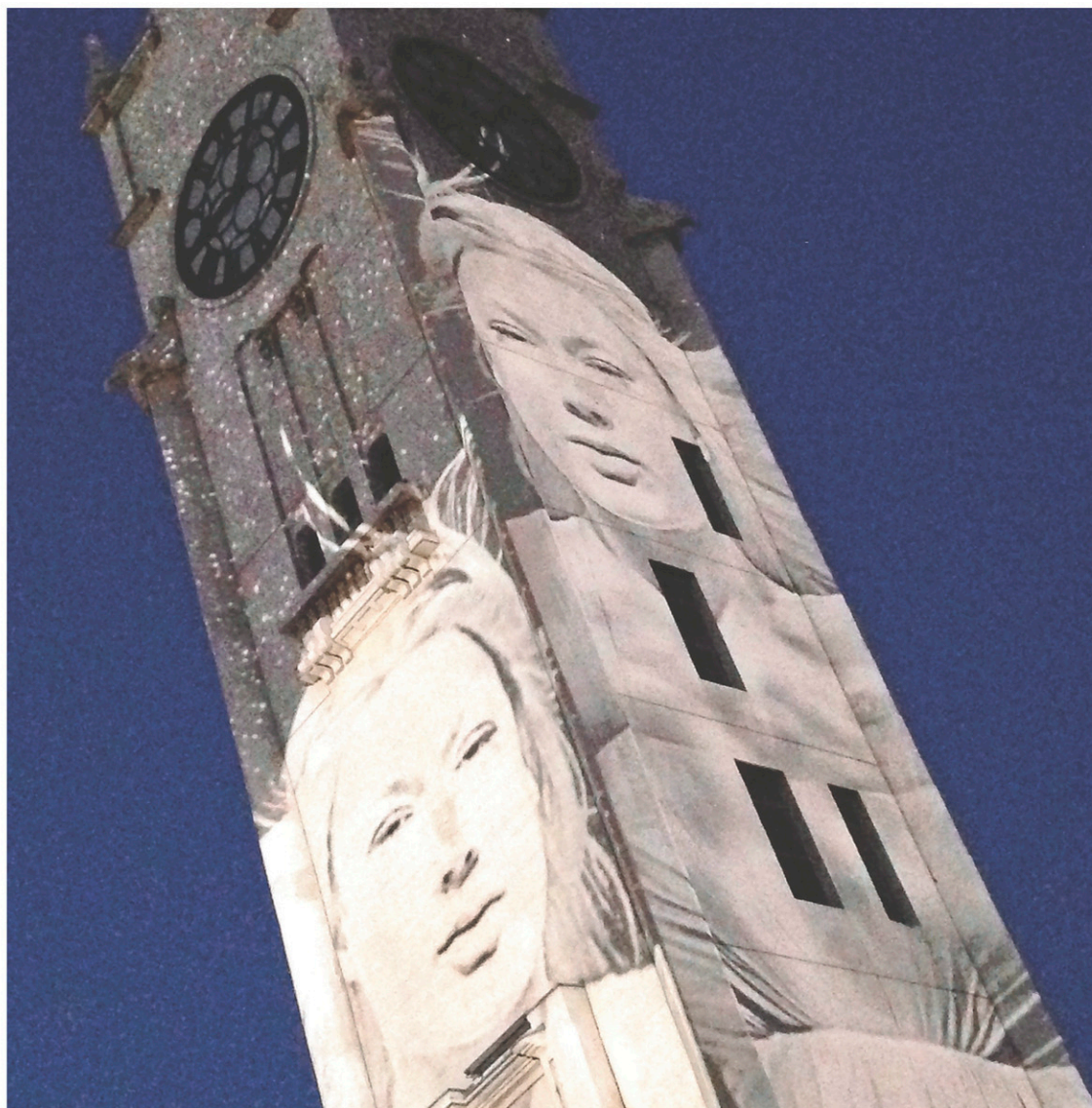
« Avec l'illumination du pont, Avudo et Cité mémoire (photo), Aura [un spectacle qui allie lumière, musique et richesse architecturale de la basilique Notre-Dame] est un incontournable du Vieux-Montréal. »

Explorer le « quartier des découvertes » et ses popotes mobiles. C'est le secteur de l'Esplanade pour la vie qui réunit le