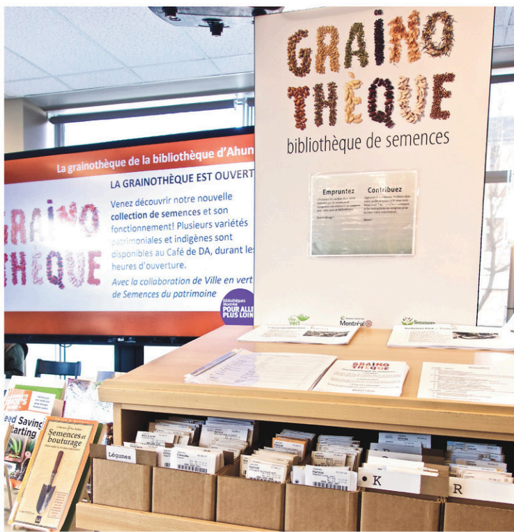
La Grainothèque de la bibliothèque d'Ahuntsic