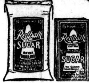
Cartons de 2 et 5 lbs. Sacs de 10, 20, 50 et 100 lbs.

est fabriqué d'une seule qualité — la meilleure. De sorte qu'il n'y a aucun danger que l'on vous vende la "seconde" qualité, lorsque vous achetez le Redpath dans les cartons ou sacs d'origine.