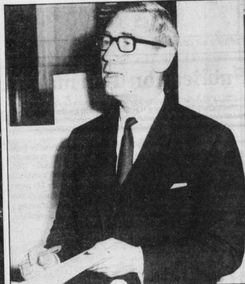
Hergé a marqué l'histoire de la bande dessinée d'un trait indélébile.

Le dictionnaire mondial de la bande dessinée sera en vente à Québec le 7 mai, au prix de 92 $.