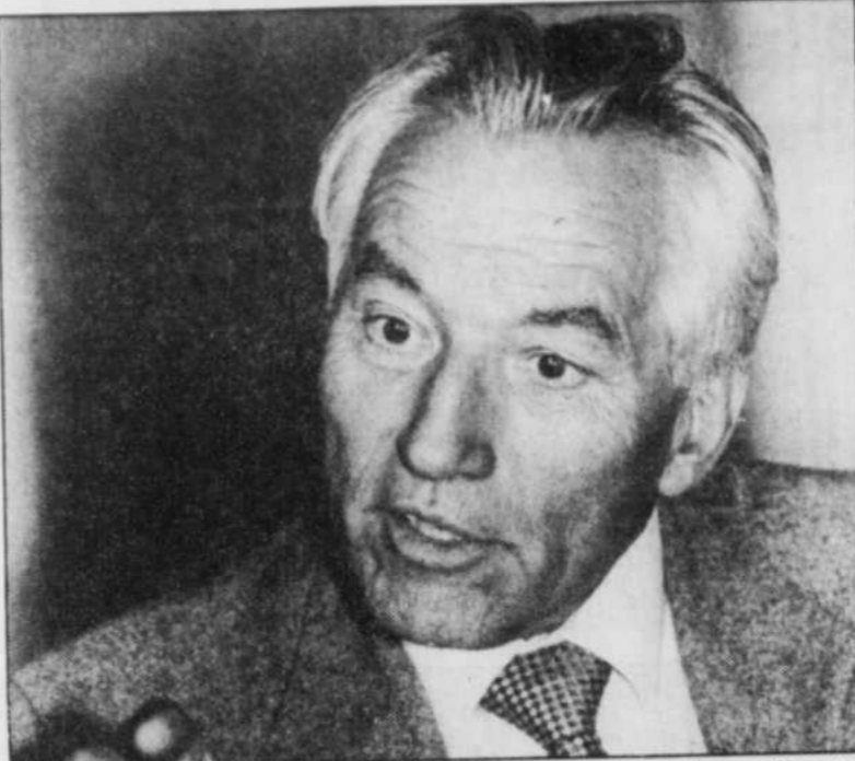
« Le bébé qui fait des otites à répétition exprime à sa mère qu'il ne se sent pas entendu », explique Jacques Salomé, convaincu que les maladies sont des langages symboliques avec lesquels une personne en difficulté tente de dire ou de ne pas dire son mal-être.

Des exemples, chacun plus éloquent que l'autre, l'auteur en a « 100 000 ». Une façon de dire qu'il n'invente rien, que ce qu'il