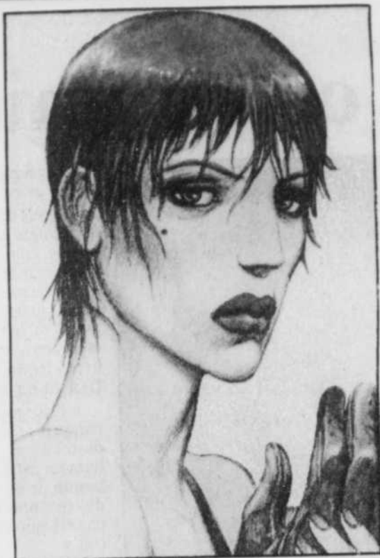
La femme fatale, selon le bédéiste d'origine yougoslave Enki Bilal.