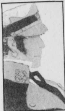
Corto Maltese par Hugo Pratt