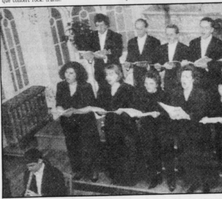
L'Ensemble de musique baroque Le Continuo présente, pour la première fois à Québec, l'audition complète du « Cantique des Cantiques ».

Salon du livre de Québec 1994. Sam. 11h à 22h. Dim. 11h à 18h.