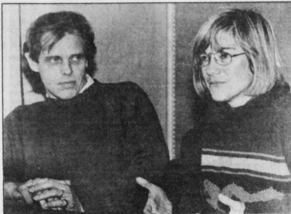
Le Soleil, Jean-Marc Villeneuve

« Il ne s'agissait pas de suivre la ligne fantastique-superstitieuse des fanzines Eerie Creepy , mais d'établir un climat trouble mais réaliste. Toujours pour demeurer intelligible. Et puis, je ne suis pas superstitieux... »