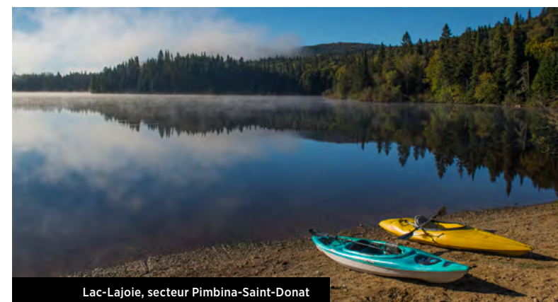
Lac-Lajoie, secteur Pimbina-Saint-Donat

Consultez le sepaq.com pour connaître les tarifs en vigueur.