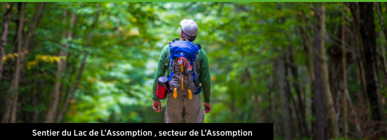
Sentier du Lac de L'Assomption, secteur de L'Assomption