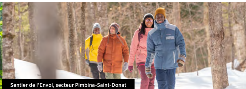
Sentier de l'Envol, secteur Pimbina-Saint-Donat