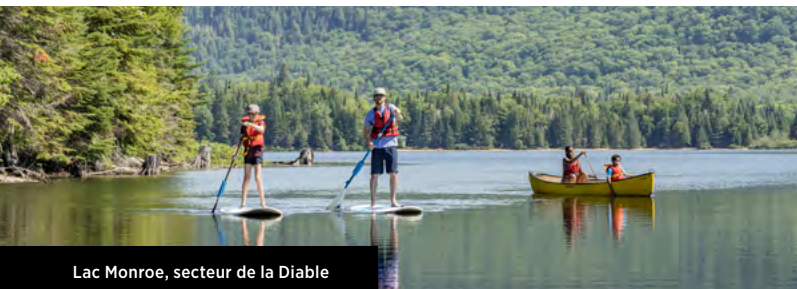
Lac Monroe, secteur de la Diable

Venez vous émerveiller devant les quatre grandes chutes du parc, toutes uniques : la Chute-du-Diable et les Chutes-Croches (secteur de la Diable), situées sur des parcours de randonnées pédestres accessibles et menant à des belvédères d'observation; la Chute-aux-Rats (secteur Pimbina-Saint-Donat), haute de plus de 17 m et comportant une aire de pique-nique et une halte, ainsi que la Chute-aux-Mûres (secteur la Cachée), avec sa charmante petite passerelle de bois.