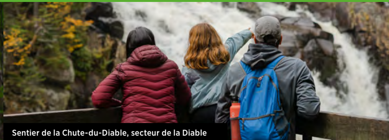
Sentier de la Chute-du-Diable, secteur de la Diable