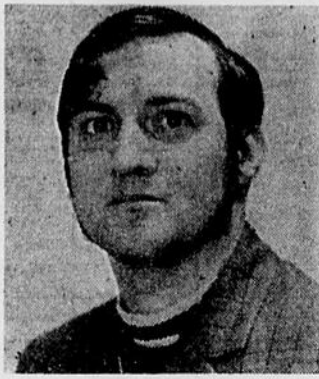
par Noël Bouchard