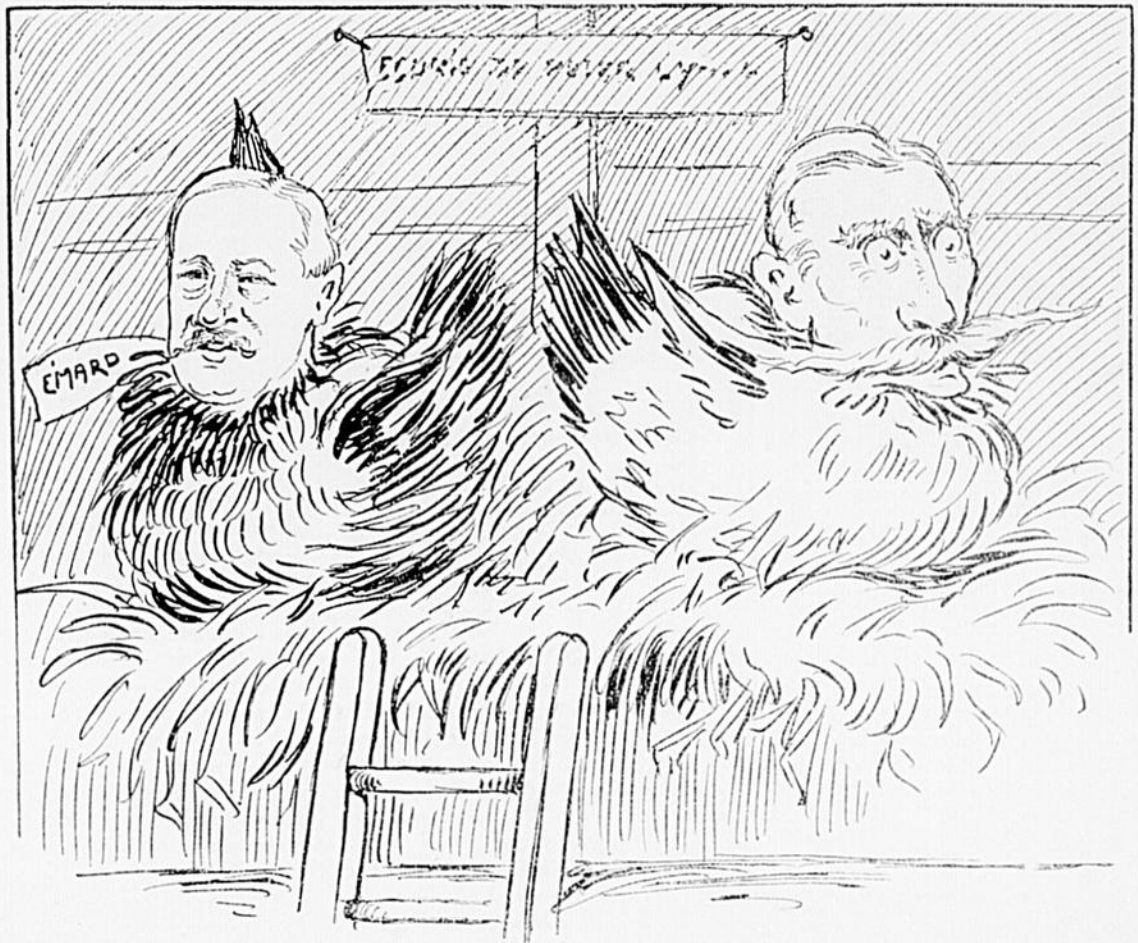
SERIE No 1 DES ECHANTILLONS DE POULES MOUILLÉS DE CONCORDIA. (Les Poupoules Eward et Judge.)