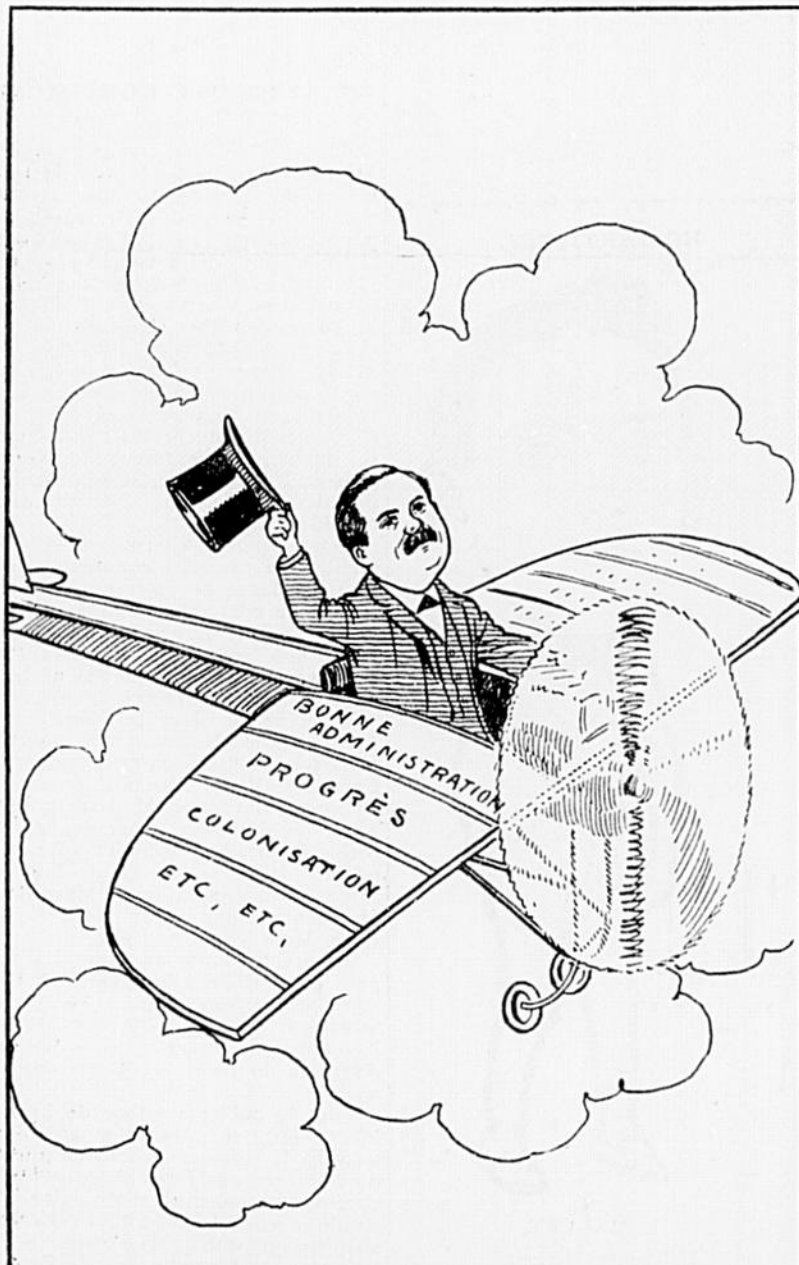
SIR LOMER GOUIN.—Tout va pour le mieux dans la meilleure des provinces.