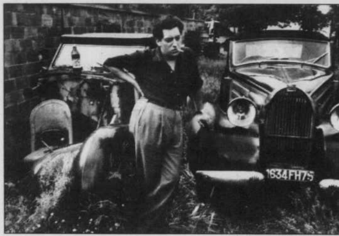
Jean-Paul Riopelle la main posée sur sa Bugatti type 57 (1936), à Brunoy, en France, en 1959.

Les vraies de vraies automobiles seront présentées aux médias mercredi prochain au Château Saint-Ambroise, à Montréal. La vente aura lieu une semaine plus tard, le 9 juillet, dans le chic hôtel de la rue Sherbrooke Ouest.