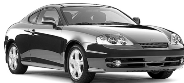
PDSF DE 19 995 $**

LOUEZ À PARTIR DE 0$ DE DÉPÔT DE SÉCURITÉ OU 199$* PAR MOIS/60 MOIS COMPTANT DE 2995 $ TRANSPORT ET PRÉPARATION INCLUS. OU 0% FINANCEMENT À L'ACHAT † JUSQU'À 60 MOIS