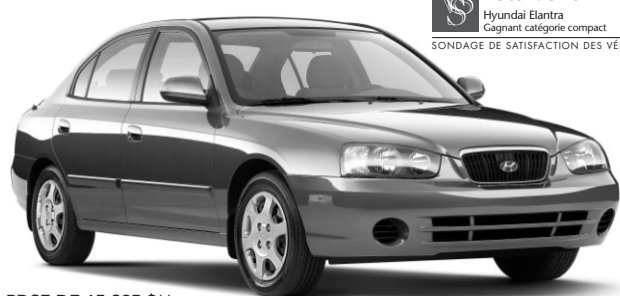
PDSF DE 15 295 $**

LOUEZ À PARTIR DE 0$ DE DÉPÔT DE SÉCURITÉ OU 165$* PAR MOIS/60 MOIS COMPTANT DE 2099 $ TRANSPORT ET PRÉPARATION INCLUS. OU 0% FINANCEMENT À L'ACHAT † JUSQU'À 60 MOIS