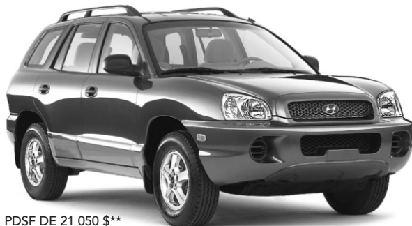
PDSF DE 21 050 $**

LOUEZ À PARTIR DE 0$ DE DÉPÔT DE SÉCURITÉ OU 199$* PAR MOIS/48 MOIS COMPTANT DE 3495 $ OU 0% FINANCEMENT À L'ACHAT † JUSQU'À 36 MOIS