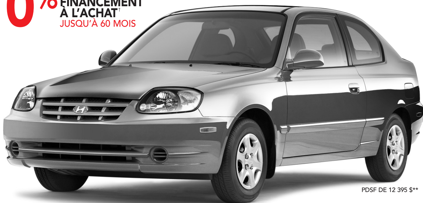
PDSF DE 12 395 $**

La sous-compacte la plus vendue au Québec.*