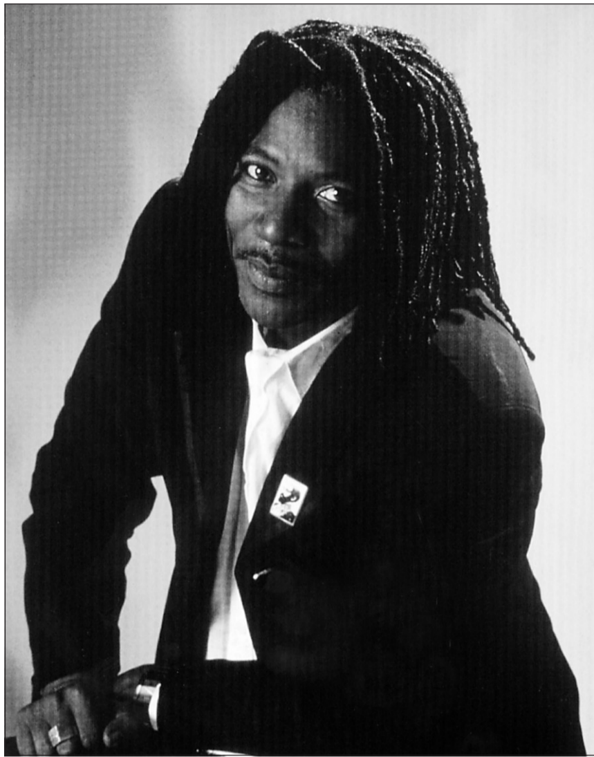
Alpha Blondy, vedette du reggae africain, est de passage à Montréal. Il sera en spectacle mercredi, au Métropolis.

Des luttes, la star du reggae africain Alpha Blondy en a menées plusieurs au cours des 20 dernières années. Un an après le coup d'État avorté de septembre 2002, le musicien de 50 ans est peut-être en train de mener le combat le plus important de sa vie : participer à la réconciliation de son pays, la Côte d'Ivoire, malmené par une sanglante guerre civile. « On est allé trop loin, dit-il, il est temps qu'on se ressaisisse. »