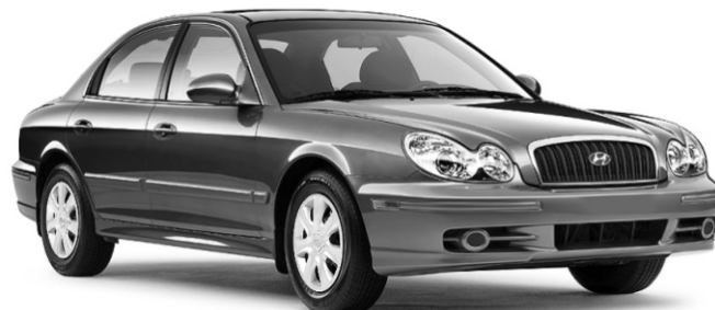
PDSF DE 21 595 $**

LOUEZ À PARTIR DE 0$ DE DÉPÔT DE SÉCURITÉ OU 229$* PAR MOIS/60 MOIS COMPTANT DE 2395 $ OU 0% FINANCEMENT À L'ACHAT † JUSQU'À 60 MOIS