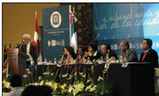
Forum des Villes, 14 novembre 2008, Querétaro

En marge du colloque, l'organisation Femmes et Villes International a lancé son Rapport d'évaluation sur les marches exploratoires à travers le monde. De même, la séance intitulée "Femmes et sécurité dans les espaces urbains" organisée par UNIFEM et ONU-HABITAT, en collaboration