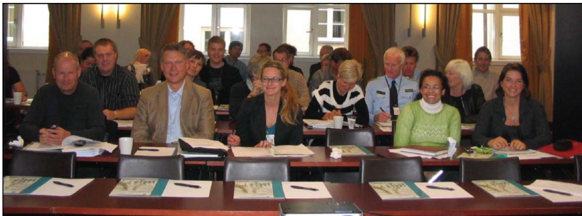
Audience lors du lancement du Rapport international 2008 à Oslo, Norvège.

anglophone) : Journal La Presse, La Presse Canadienne, Journal Le Devoir, Canoe, Journal Métro, Radio-Canada (télévision), CTV, CBC Radio, Radio-Canada (radio), CJAD, Info 690. La plupart de ces médias ont couvert l'événement sous la forme de 8 articles et 13 mentions et entrevues radio et télévision.