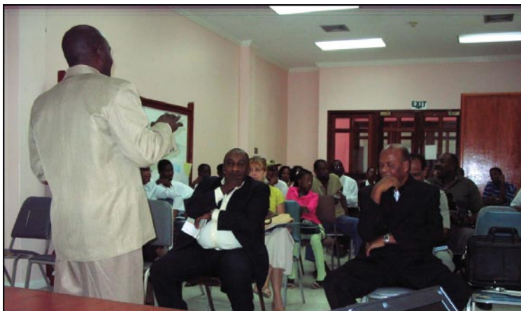
Présentation du Rapport international 2008 à Tobago.

Ces assises ont été organisées par le Ministère de la Sécurité nationale (MNS) de Trinidad et Tobago. À Trinidad, la session a été ouverte sous la présidence du sous-secrétaire permanent du MNS. L'auditoire était composé de :