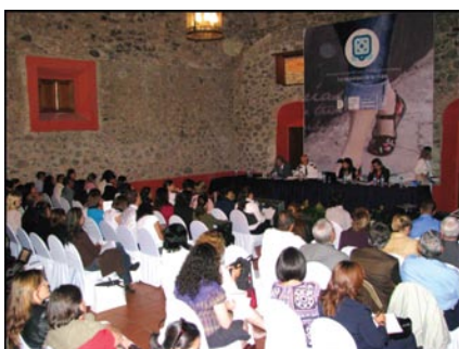
Atelier sur le rôle des hommes dans la sécurité des femmes, Querétaro

Les intervenants de ces ateliers étaient des experts reconnus issus de gouvernements, d'institutions policières, d'organisations internationales, d'organisations non-gouvernementales, d'universités et de centre de recherche.