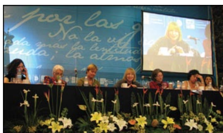
Séance « Femmes et sécurité dans les espaces urbains, organisée par UNIFEM et ONU-HABITAT, 14 novembre 2008, Querétaro

avec Femmes et Villes International et Red Mujer y Hábitat a permis de présenter les initiatives de ces organisations portant sur la sécurité des femmes.