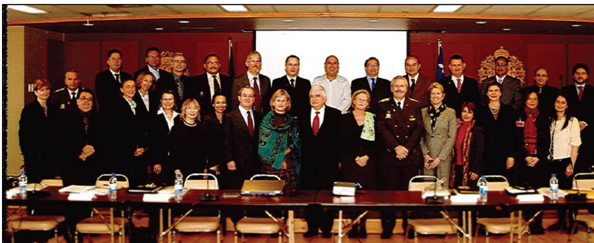
Réunion du CCO les 1er et 2 mai 2008, dans les locaux de la sûreté du Québec à Montréal.

A la date d'impression du rapport d'activité 2008, les états financiers 2008 du CIPC ne sont pas disponibles. Toutefois, l'évolution générale du budget du CIPC se confirme à la hausse depuis 3 ans passant de 1 499 967$ en 2006, à 1 739 230$ en 2007 et 1 859 966$ en 2008 (selon le budget établi au 30 septembre 2008) soit une augmentation d'environ 25% des revenus en 2 ans.