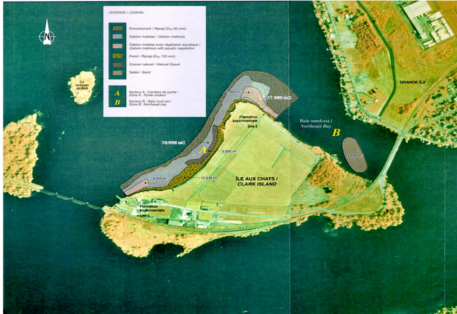
FIGURE 3 : RECOUVREMENT DE LA ZONE A