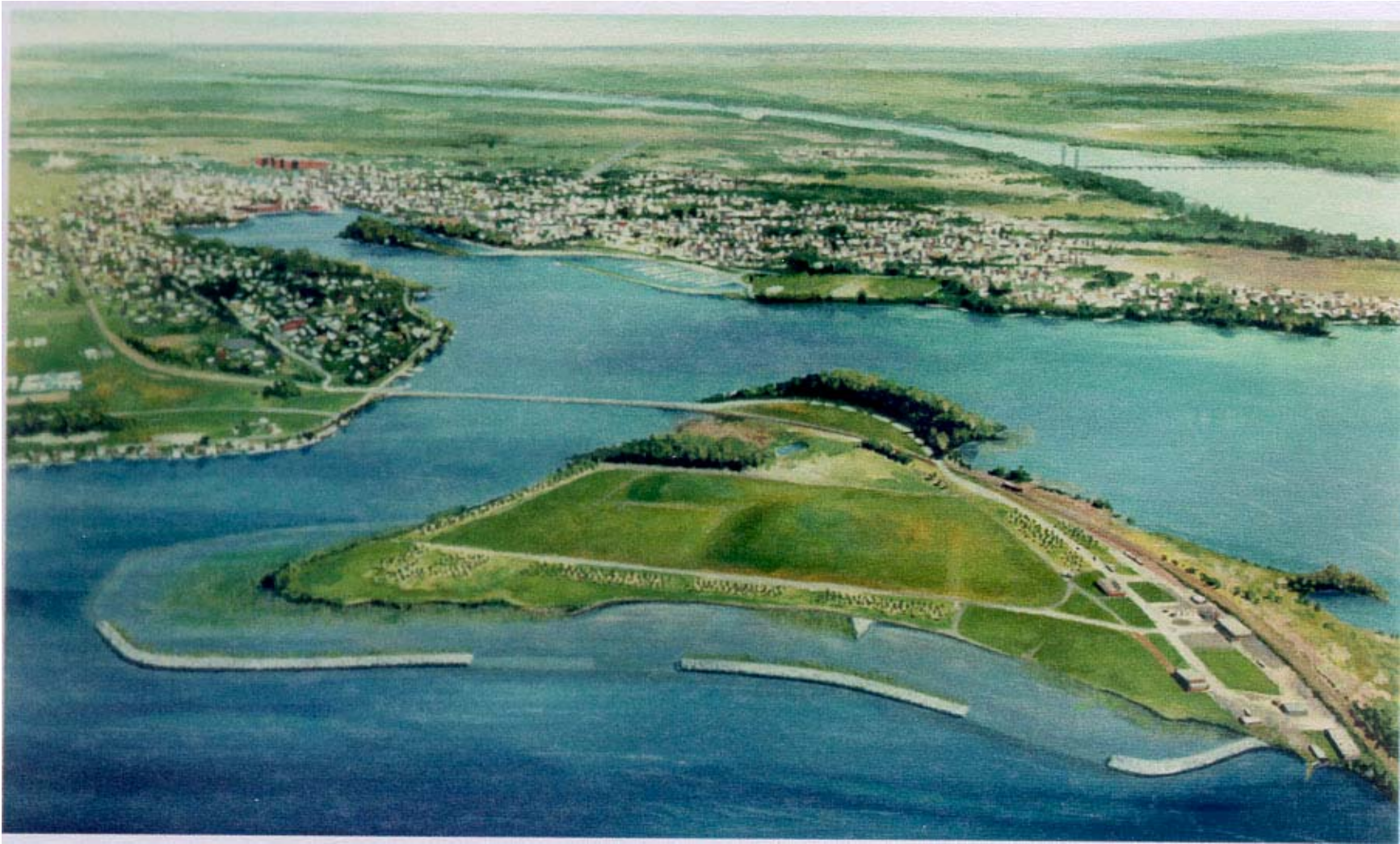
FIGURE 1 : PROJET AUTORISÉ PAR LE DÉCRET NUMÉRO 1203-2002 LE 9 OCTOBRE 2002