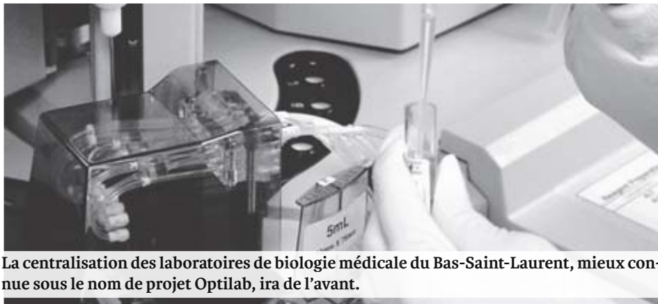
La centralisation des laboratoires de biologie médicale du Bas-Saint-Laurent, mieux connue sous le nom de projet Optilab, ira de l'avant.