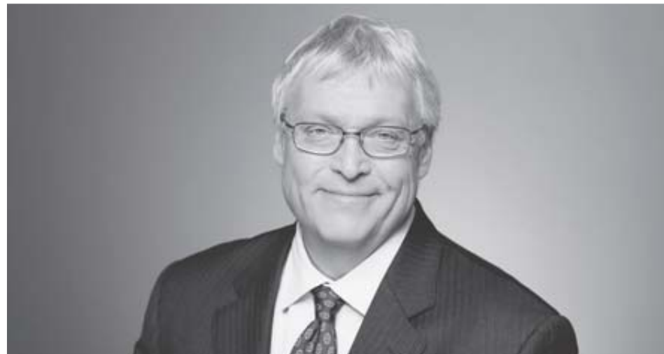
Le ministre de la Santé et des Services sociaux, Gaétan Barrette.

Les éluEs du Bas-Saint-Laurent demandent impérativement au ministre Barrette de suspendre la présente démarche, de permettre au comité régional d'experts bas-laurentiens de terminer son travail autour du projet Optilab afin qu'il puisse rendre compte des potentiels et des limites des ambitions portées par Optilab.