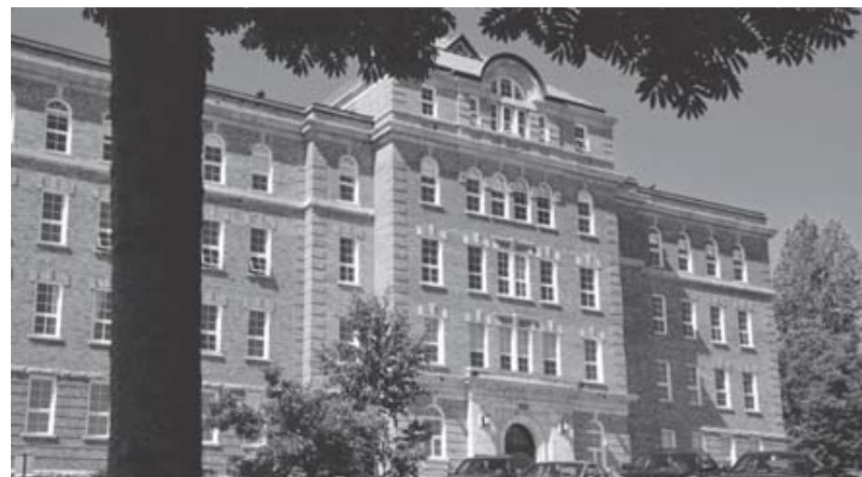
L'ITA à La Pocatière.

« On appuie la démarche des acteurs locaux. L'ITA à La Pocatière, c'est le cœur agricole de notre région », de s'exclamer M. Mar-