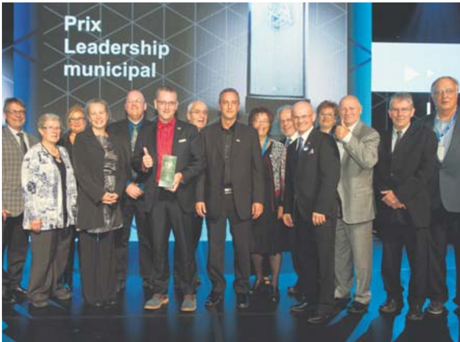
Le Kamouraska était bien représenté lors de la remise du prix.

La MRC de Kamouraska a remporté, jeudi, le Prix Leadership municipal de la Fédération québécoise des municipalités pour son projet Enseigner le Kamouraska.