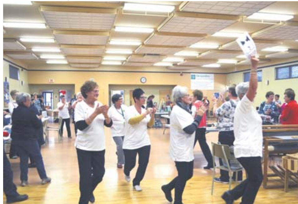
Les Cercles de Fermières de la région ont tenu un « flash mob » lors des Journées de la culture.

Pour célébrer les Journées de la culture, des cercles du Kamouraska se sont réunis au Complexe municipal de Saint-Alexandre dimanche, en ouvrant leurs portes au public.