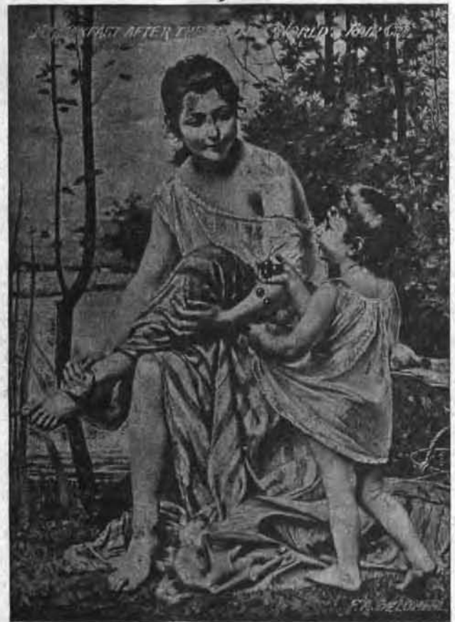
Le Déjeuner après le Bain