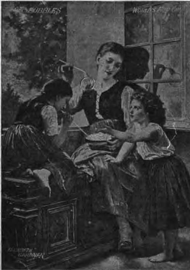
Les Bulles de Savon