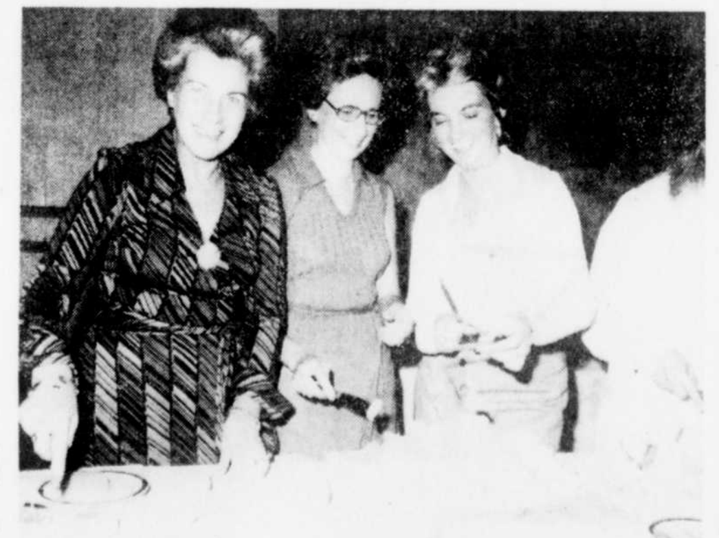
Les dames ont été d'une grande utilité à la dégustation annuelle de vins et fromages du club Richelieu de Victoriaville, vendredi soir dernier. Une équipe familiale composée de dames, demoiselles