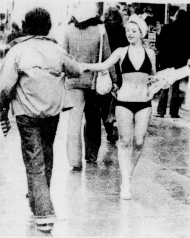
Derrière le rideau de plomb

Paf! Pif! Panpanpan! Pour tout l'or au monde je ne voudrais être canard ces semaines-ci. Encore hier matin, je me suis arrêté en bordure du fleuve, à Champlain. Mes vieux, on se serait cru en banlieue de Saïgon.