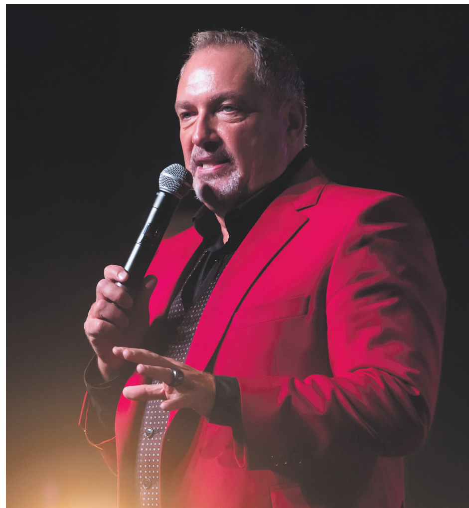
Messmer, le maître de l'hypnose et du magnétisme, revient sur la Côte-Nord avec son nouveau spectacle le 1 er novembre au Centre des arts de Baie-Comeau et le 2 novembre à la Salle Jean-Marc-Dion de Sept-Îles.