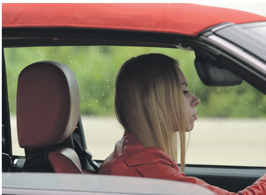
Le Carrefour jeunesse-emploi de la Haute-Côte-Nord veut rendre plus accessible le permis de conduire chez les jeunes.

Dans une région où l'absence de transport collectif limite grandement les déplacements, l'accès à