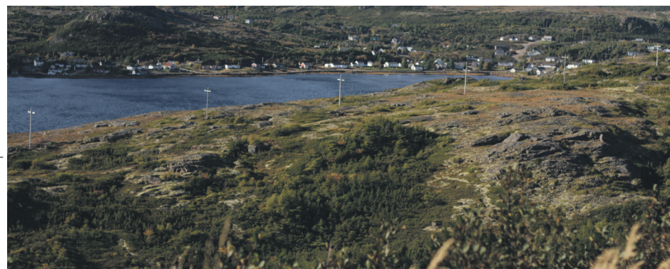
Point de vue sur Bonne-Espérance en Basse-Côte-Nord, un secteur visé par un projet d'aire protégée terrestre. La liste complète des aires protégées n'est pas publique, mais chacun des projets a été soumis aux MRC concernées qui ont dû donner leur aval à la démarche.