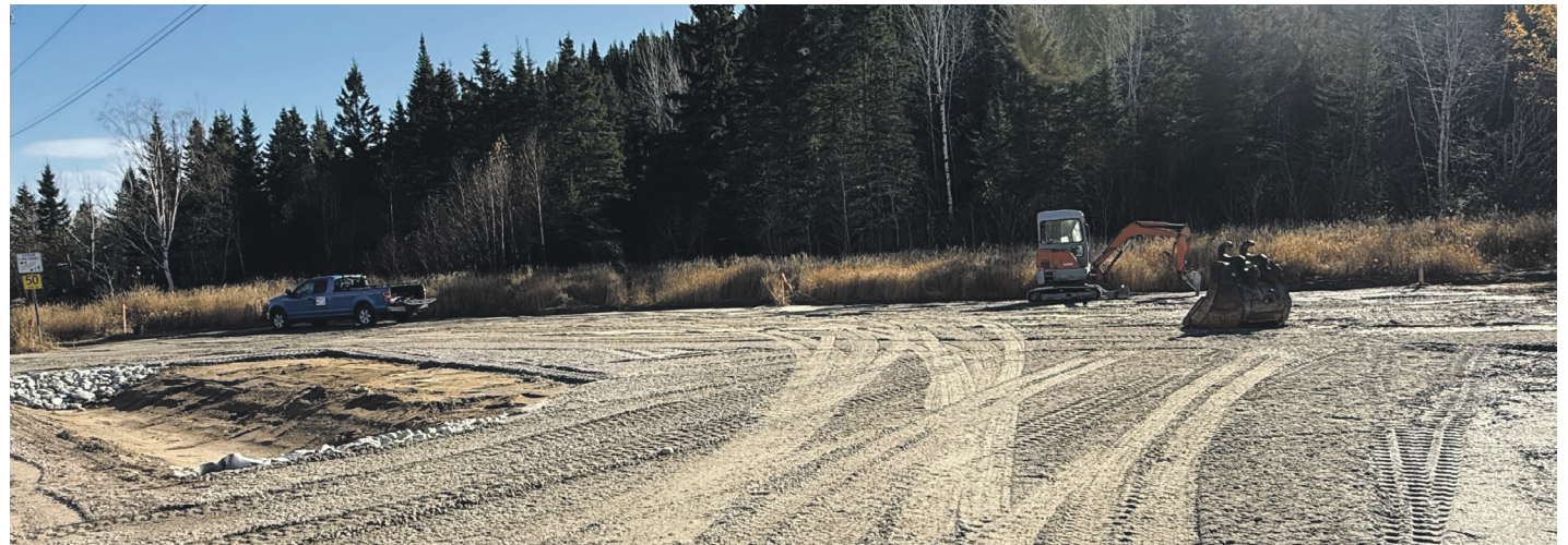
Un nouveau parc de jeux verra le jour à Saint-Marc-de-Latour. Les travaux, effectués par Excavation Durand et Fils de Colombier, ont débuté la semaine dernière.

Ces travaux, évalués à 62 669 $, bénéficieront d'une subvention de