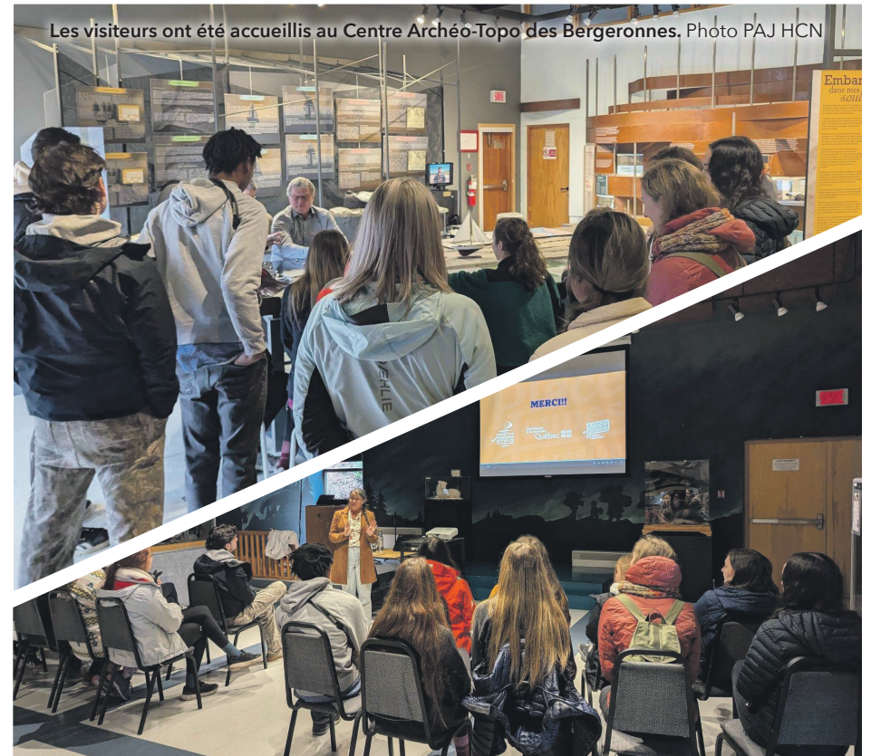
Les visiteurs ont été accueillis au Centre Archéo-Topo des Bergeronnes.