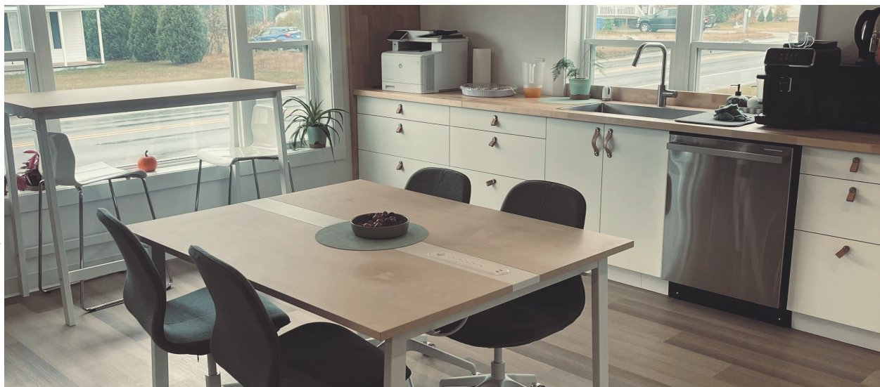
Les bureaux de Développement Sacré-Cœur sont dotés d'une cuisine et d'une aire commune où il est possible de travailler.

«On voulait un endroit où les gens étaient capables d'arriver et de partir de façon autonome, avec la technologie adaptée aux besoins d'aujourd'hui qui était accessible», mentionne-t-elle.