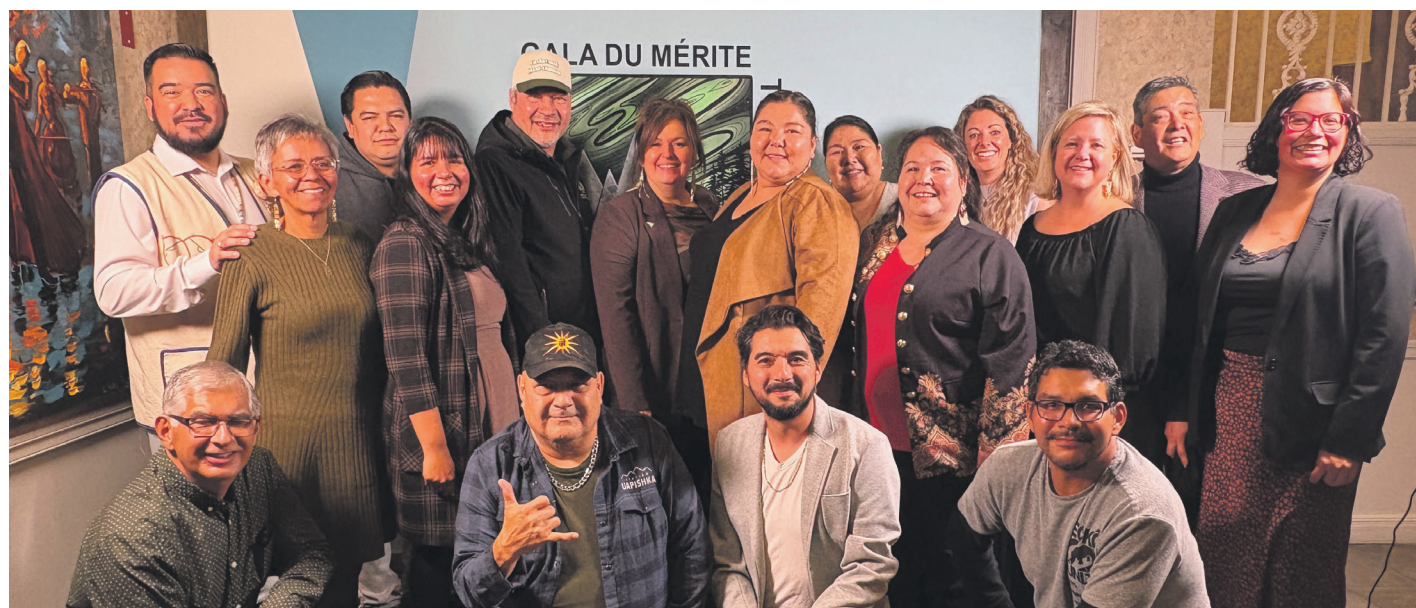
Le tourisme autochtone était bien représenté lors du Gala du mérite touristique.