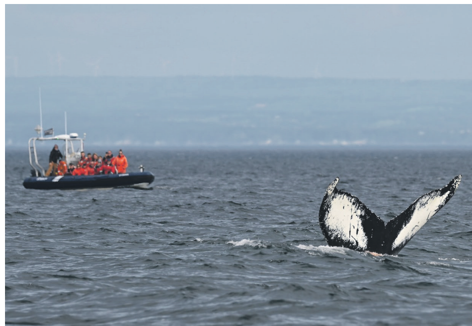
La compagnie de croisière Du Fleuve des Escoumins a remporté le prix S'unir pour rayonner au Gala du mérite touristique 2025.

Ce dernier raconte que la deuxième édition a été «très bonne», même si le festival a dû se débrouiller pour rem-