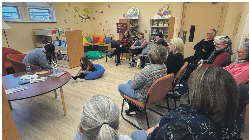
Une quinzaine de personnes sont venues à la rencontre de l'autrice native du village.

La résidente de Québec n'a jamais oublié ses racines nord-côtières. C'est à Portneuf-sur-Mer qu'elle a puisé sa voix d'autrice. Aujourd'hui, elle continue de porter la région dans ses mots, tout en explorant de nouvelles formes artistiques.