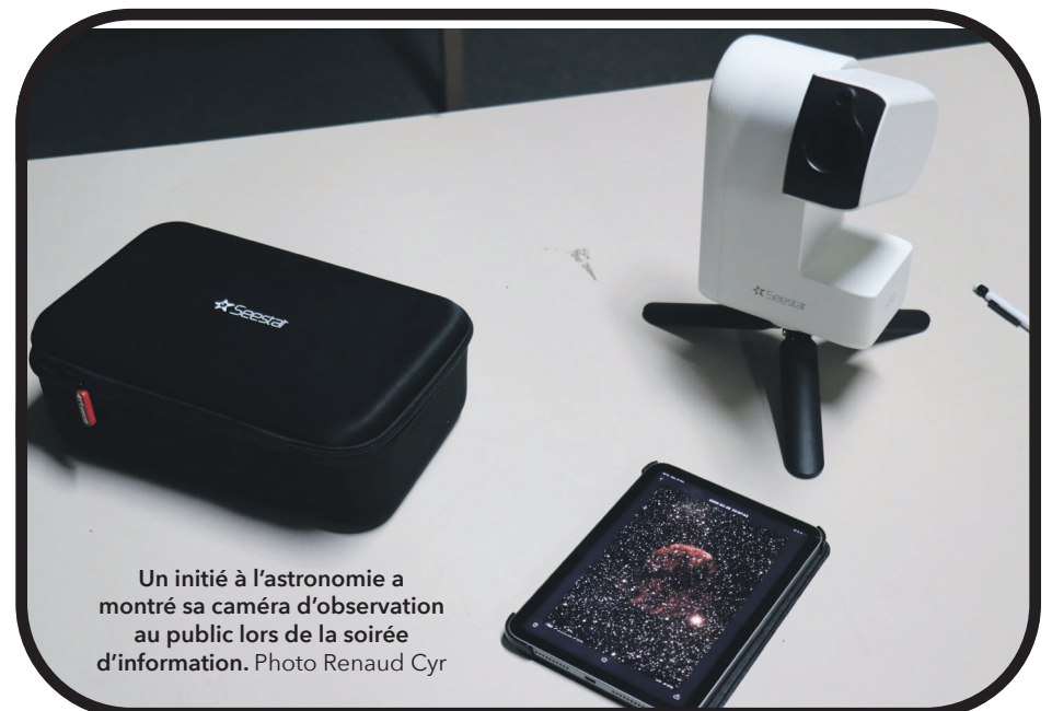
Un initié à l'astronomie a montré sa caméra d'observation au public lors de la soirée d'information.

«J'ai des télescopes chez moi, mais aussi une caméra photo ordinaire