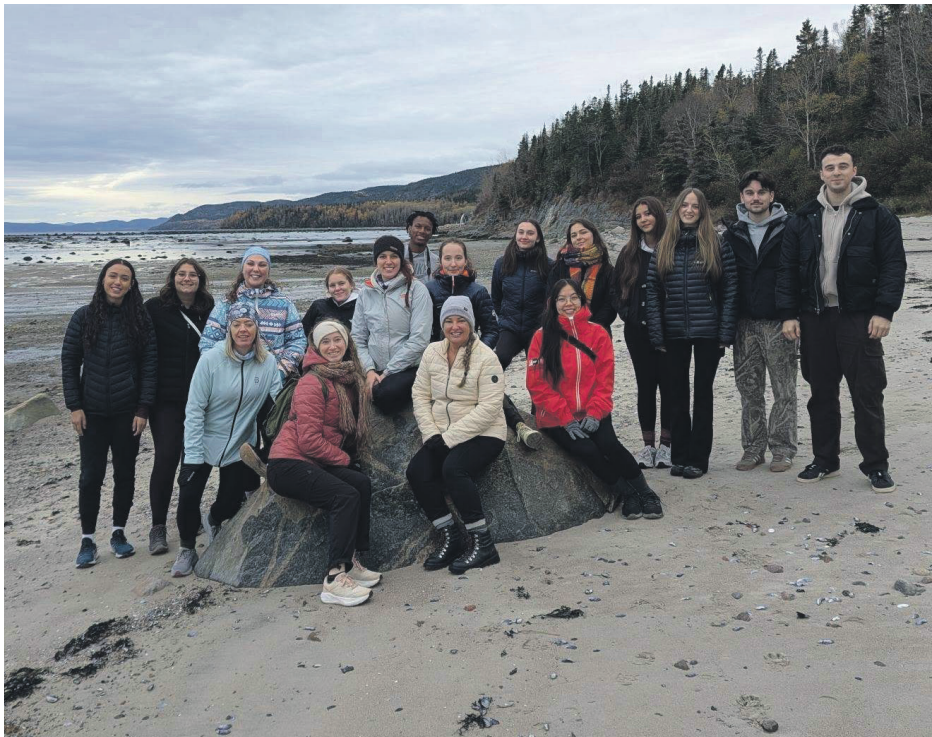
Une balade sur la plage a conclu le séjour des étudiants avec en prime, la vue d'un rorqual commun.