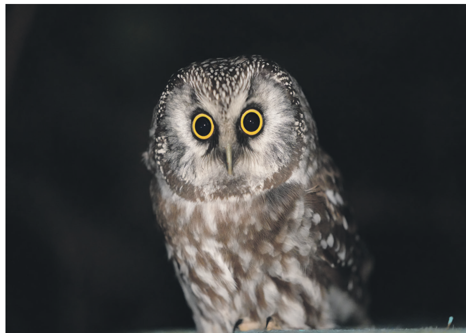
La nyctale de Tengmalm.

«On a plus de feux de forêt, de gels, d'insectes et de sécheresses, ce