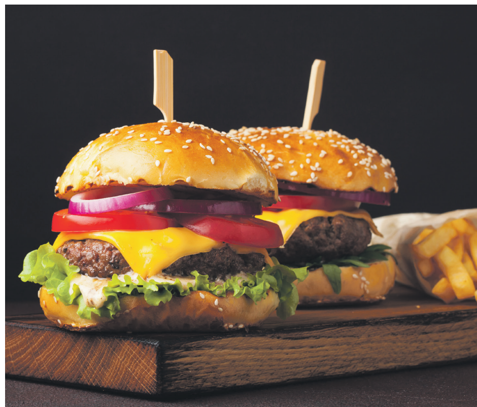
Parce que les hommes aussi ont besoin d'aide, Centraide Haute-Côte-Nord Manicouagan et Homme aide Manicouagan s'unissent pour lancer la première édition du Nov'HommeBurger.

En plus de faire une différence, les restaurants participants auront la chance de se distinguer dans deux catégories, soit le restaurant ayant vendu le plus de burgers et le coup de cœur du public, déterminé par un vote en ligne.