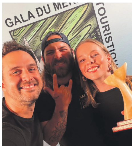
L'entreprise Du Fleuve aux Escoumins a reçu le prix S'unir pour rayonner.

Enfin, l'organisation a remercié chaleureusement tous les partenaires, collaborateurs et participants ayant contribué au succès de cet événement rassembleur – symbole d'une région plus unie que jamais autour d'une passion commune : faire découvrir la beauté brute et l'authenticité du territoire nord-côtière.