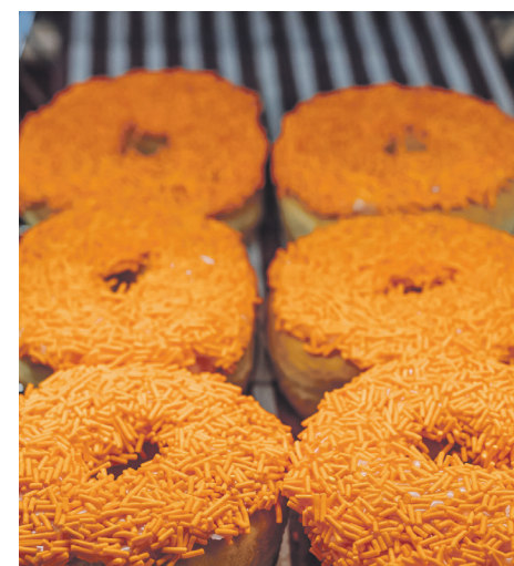
Le beigne aux vermicelles orange est vendu seulement lors de la Journée de vérité et de réconciliation, le 30 septembre.