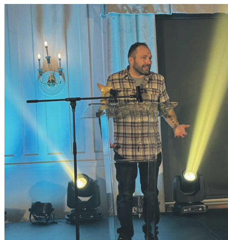
C'est au Festival du Fjord de Sacré-Cœur qu'est octroyé le Prix de l'événement de l'année.