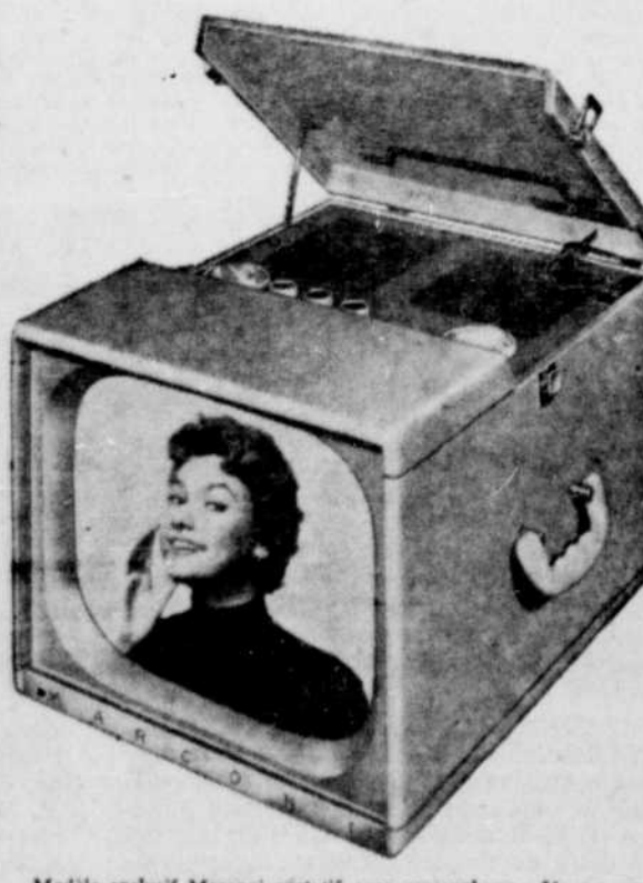
Modèle exclusif Marconi portable avec gramophone. Vous serez surpris du rendement que peut vous offrir ce magnifique appareil.