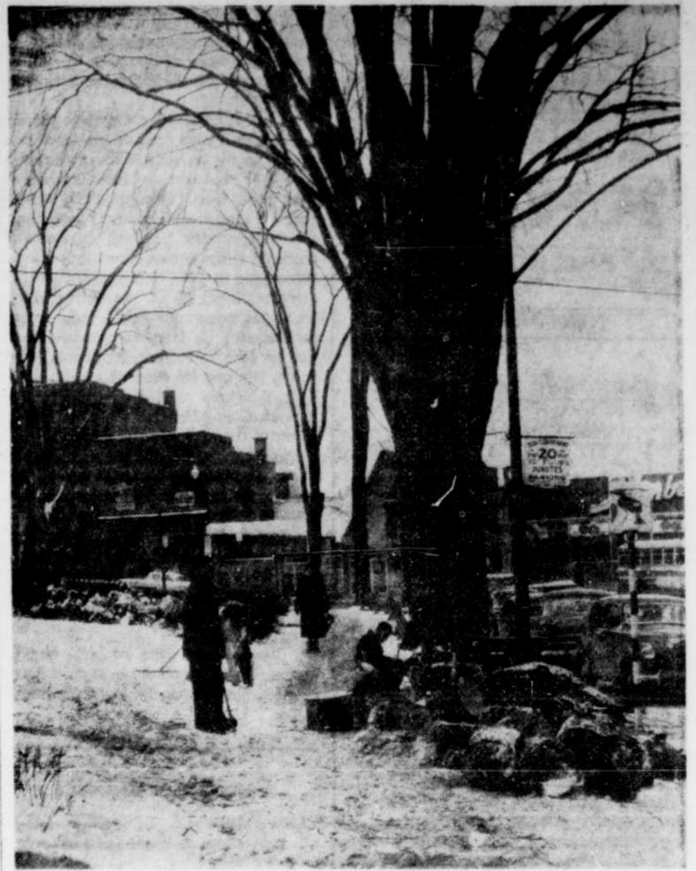
DEUX AUTRES ORMES DISPARAISSENT.— Les employés du service municipal des parcs ont coupé deux autres des 340 ormes "malades" de Sherbrooke, en face du Palais de justice, hier. Environ 275 de ces arbres majestueux ont déjà subi le même sort cette année. On croit cependant pouvoir commencer au printemps la plantation de 3,000 arbres, partout dans la ville.