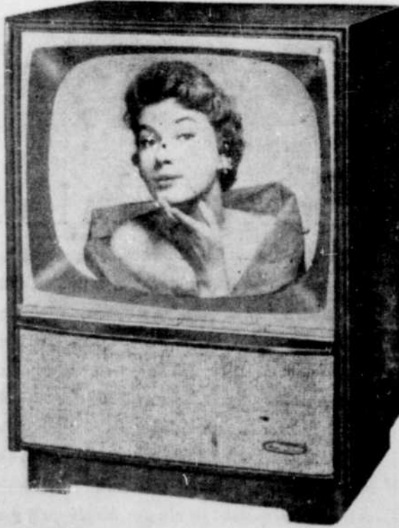
Modèle TV2401 à écran 24" — Appareil idéal pour votre foyer. Prix $429.95