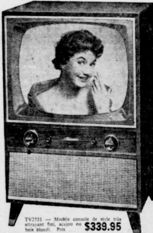
TV2551 — Modèle console de style très attrayant fini, acajou ou bois blond. Prix $339.95