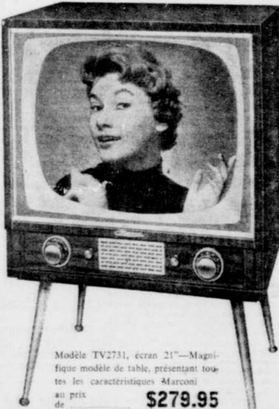
Modèle TV2731, écran 21" — Magnifique modèle de table, présentant toutes les caractéristiques Marconi au prix de $279.95