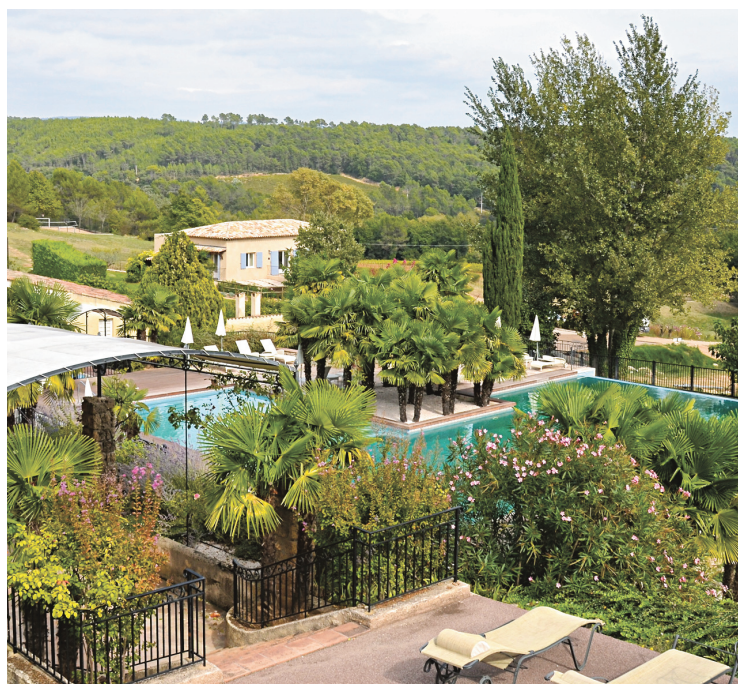
Le Château de Berne, un Relais &amp; Châteaux à Lorgues. À droite: des figues fraîches du domaine (grise de Saint-Jean, blanche de Marseille, bourjassotte, noire de Caromb).