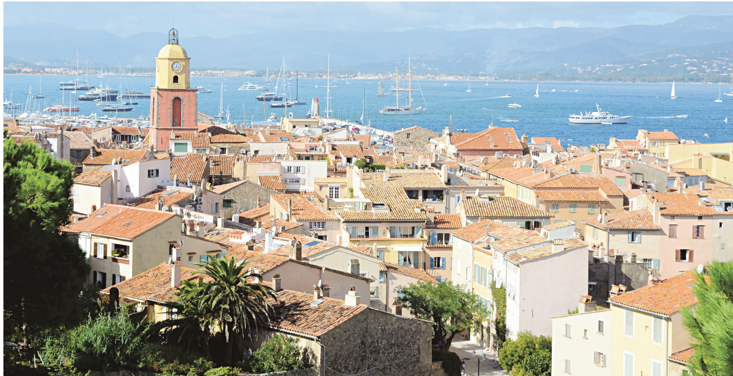
La ville de Saint-Tropez vue de la citadelle.