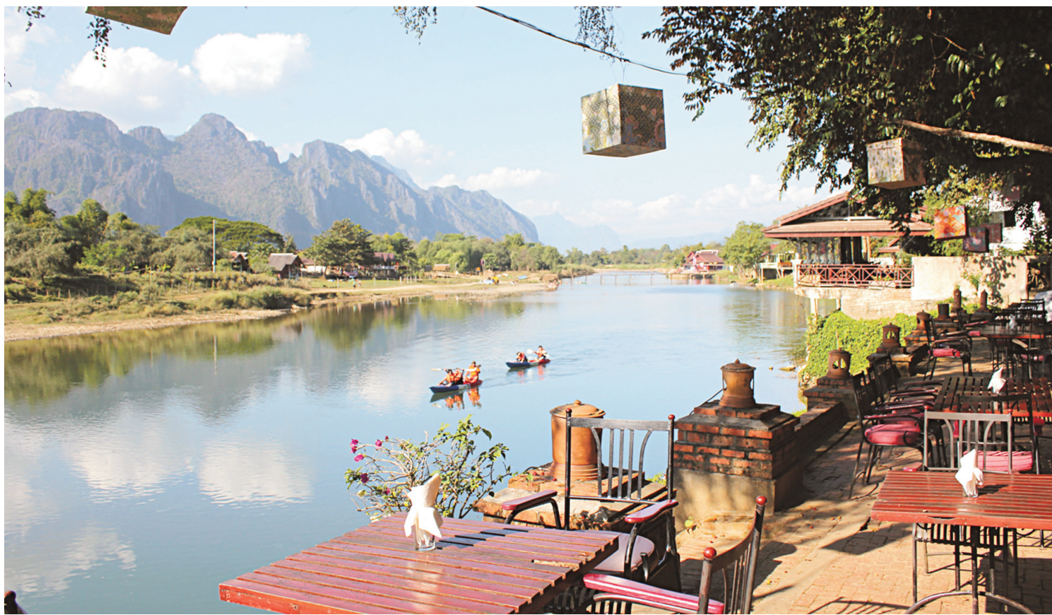
On séjourne à Vang Vieng, au Laos, pour profiter de la nature et faire quelques activités de plein air, le tout bien sobremment.