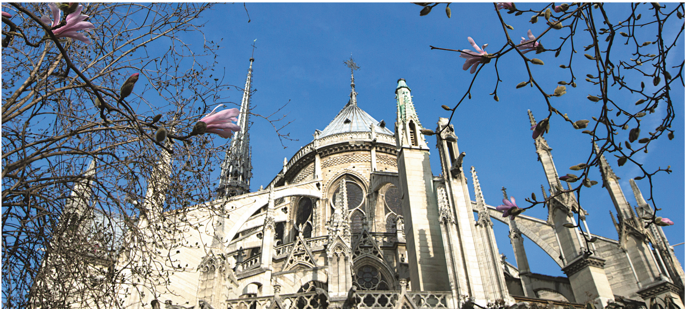
Des arbres fleurissent près de la cathédrale Notre-Dame, à Paris.

Dans les Highlands, il y a des bords de mer qui ressemblent à l'Irlande, des lochs avec des phoques, des plaines sans nom et des aspérités montagneuses où l'on est presque dans les Hauts de Hurlevent.