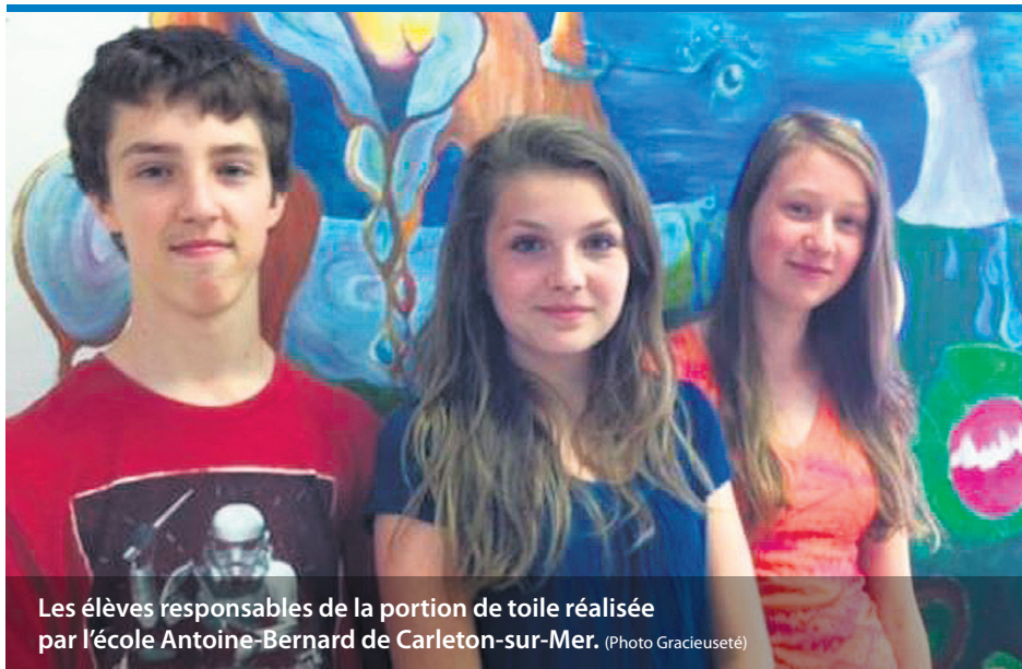
Les élèves responsables de la portion de toile réalisée par l'école Antoine-Bernard de Carleton-sur-Mer.