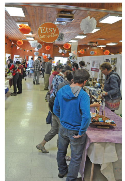
Environ 650 visiteurs ont assisté à l'exposition.