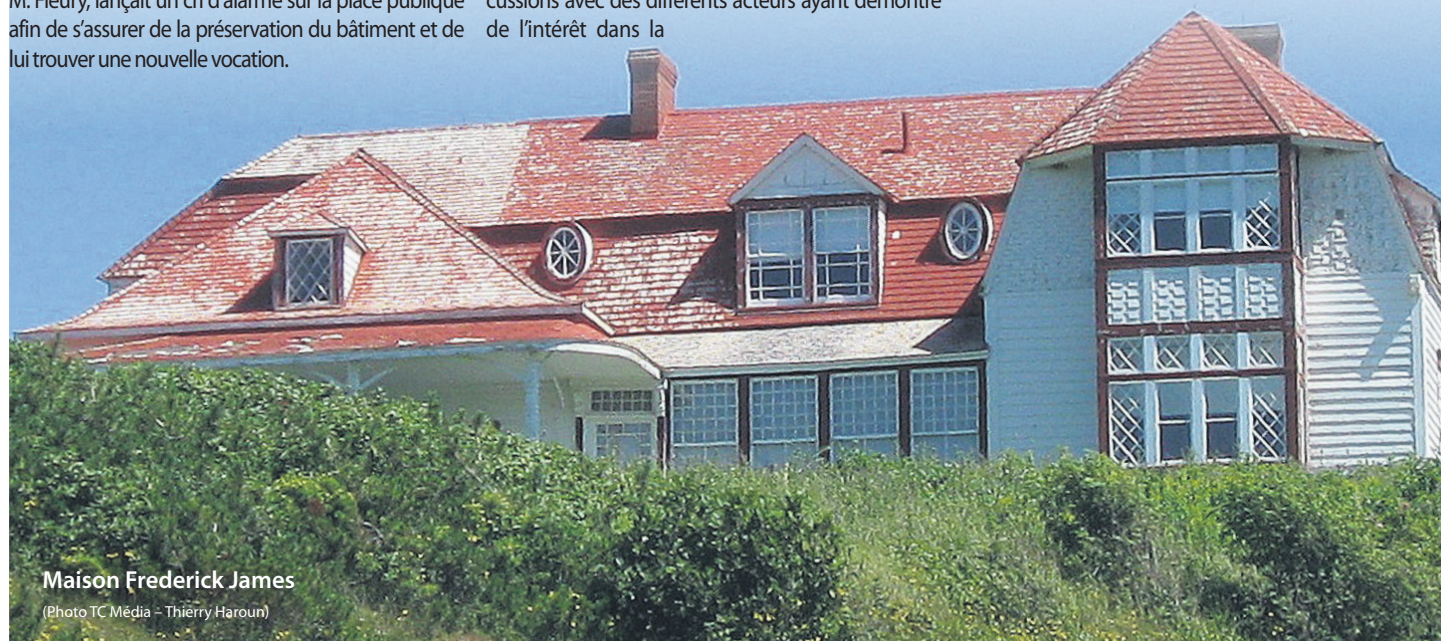
Maison Frederick James