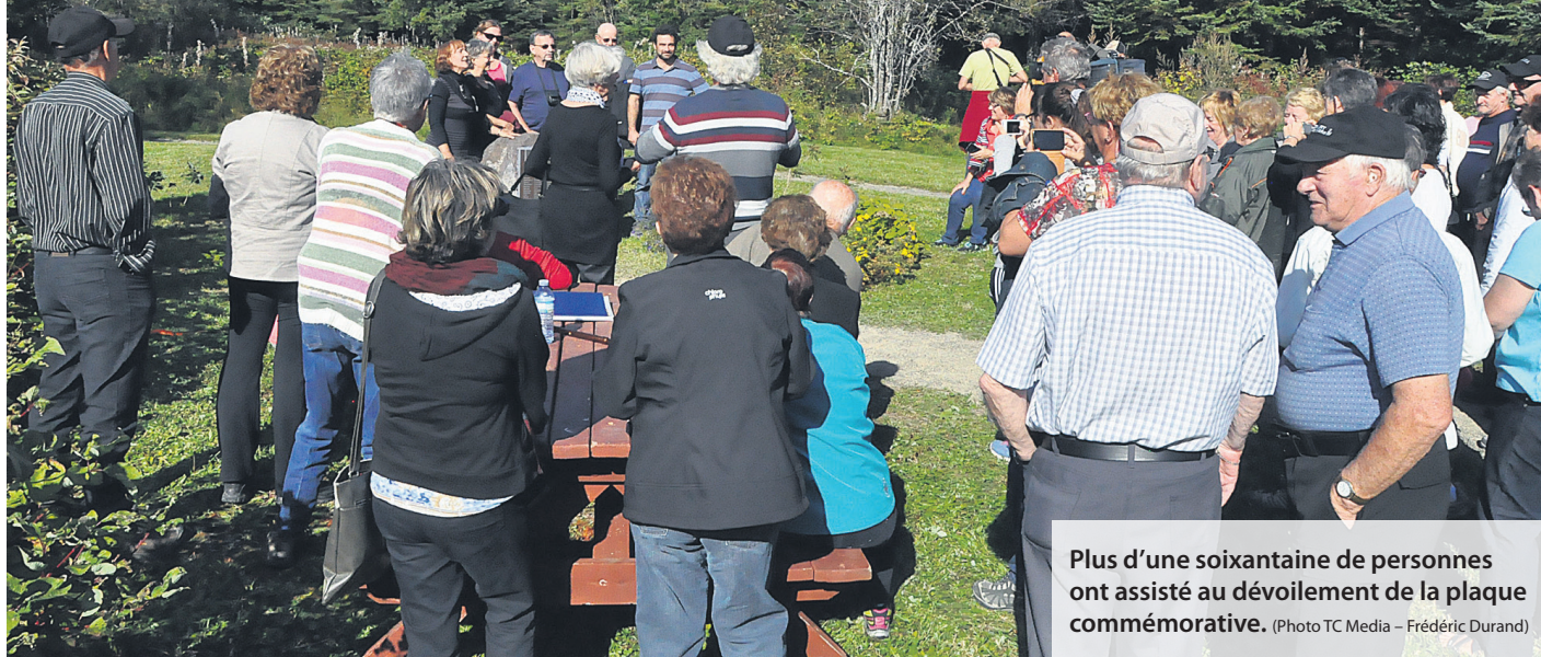
Plus d'une soixantaine de personnes ont assisté au dévoilement de la plaque commémorative.