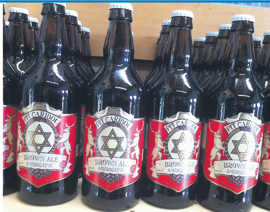
La Brown Ale Américaine

Les choses vont si bien pour cette firme que des travaux d'agrandissement de l'ordre de 550 000$ sont en cours. Des agrandissements qui ont nécessité plusieurs voyages de camion, précise M. Joncas. « On a sorti environ 800 voyages de terre de camions de dix roues. Les agrandissements vont nous permettre d'avoir plus de place pour l'entrepasage et avoir un endroit où on met les barils de chêne avec atmosphère et humidité contrôlés pour assurer le bon vieillissement du produit en baril de chêne. » Si tout va comme prévu, le tout devrait être complété d'ici la fin de l'année.