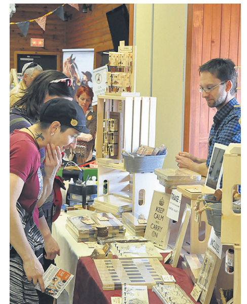
21 artisans ont exposé leurs créations à Maria.