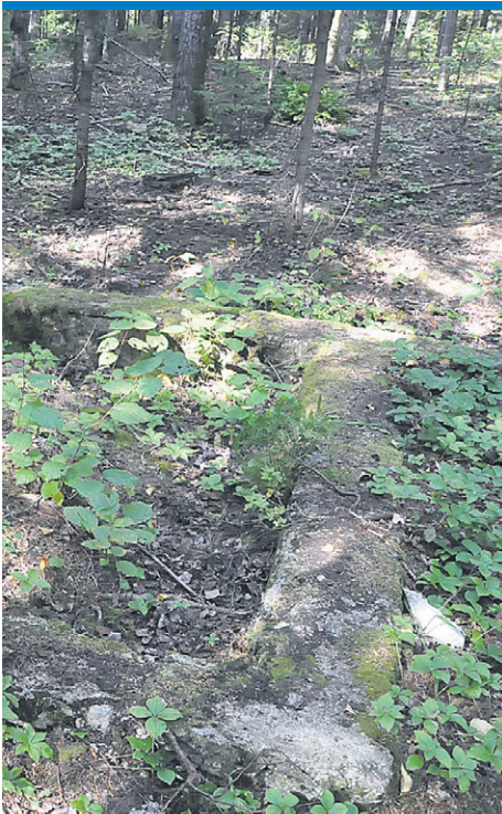
Les fondations de la première église sont toujours visibles.