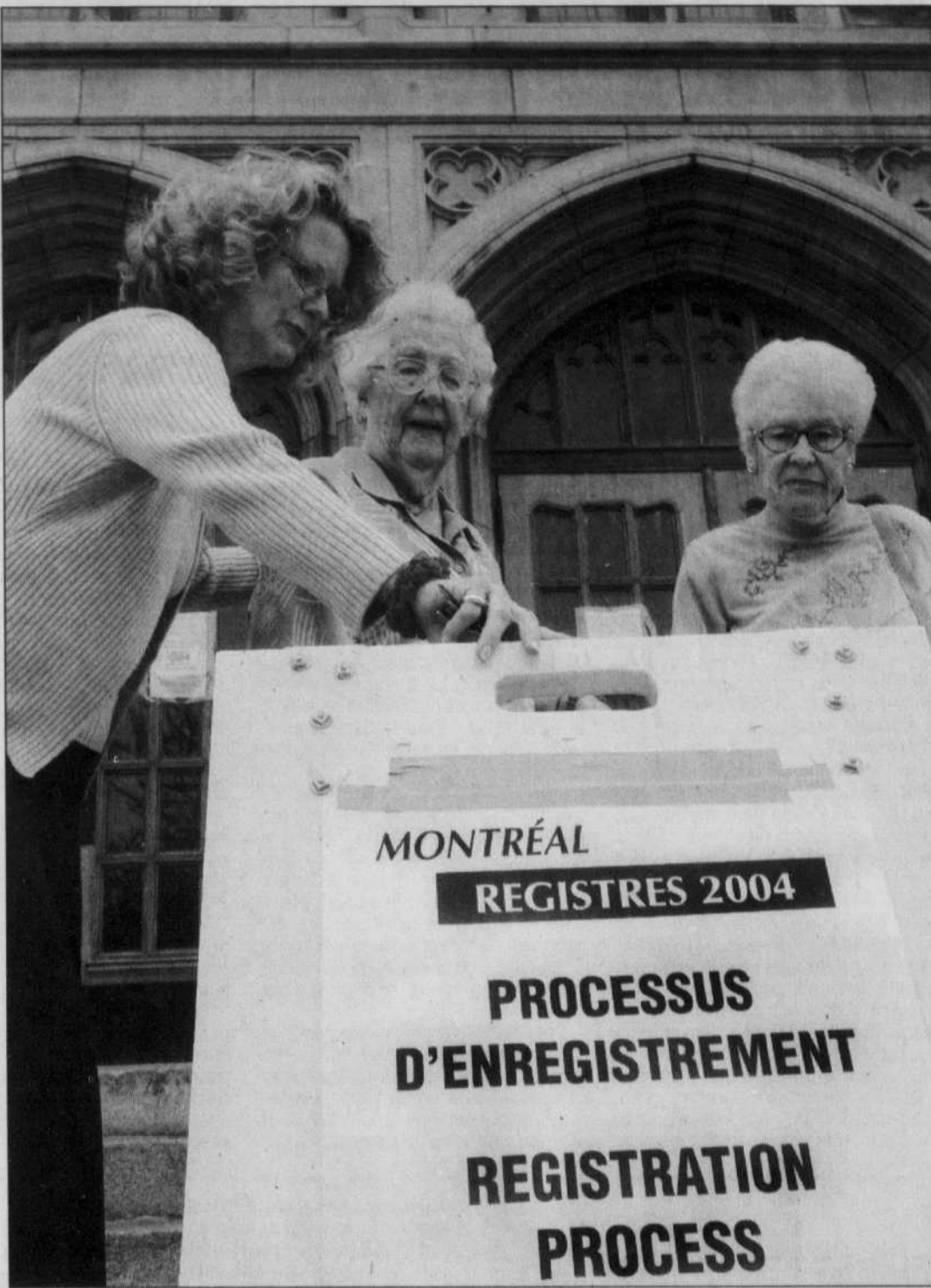
Lorsqu'une ville entreprend des politiques économiques, les répercussions se font sentir sur toute la région métropolitaine.

Mais l'externalité la plus cruciale pour les résidents de l'île, c'est au chapitre du développement économique. Lorsqu'une ville entreprend des politiques économiques, les répercussions se font sentir sur toute la région métropolitaine. Par exemple, si elle réussit à attirer sur son territoire une grande entreprise étrangère, les emplois créés ne proviendront pas seulement des habitants de cette ville. [...] En présence d'externa-