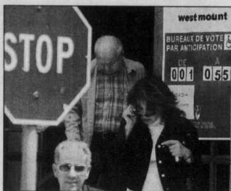
À Westmount, 22,83 % des inscrits ont déjà voté.

Le fait que la Fête des pères survienne ce même dimanche semble avoir motivé plu-