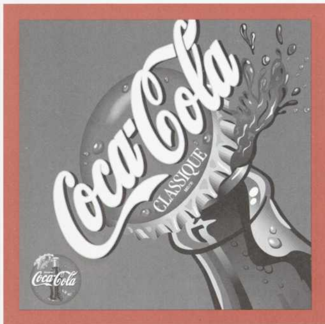
Les Embouteillages T.C.C. (Coca Cola Ltée)