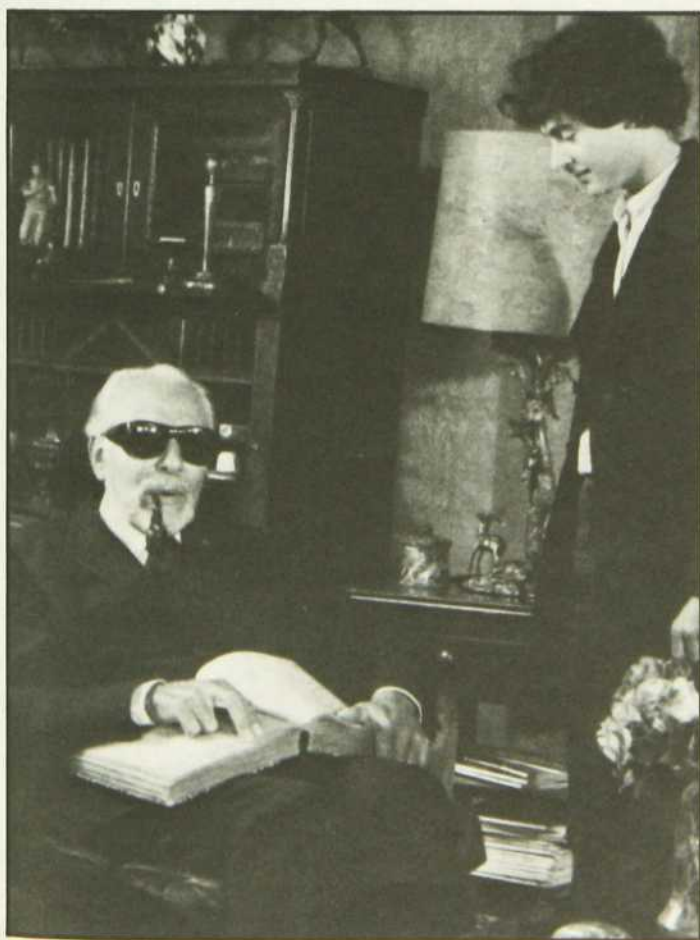
«Une voix dans la nuit»

En mêlant avec un génie incomparable le rêve et le réel dans une atmosphère de poésie insolite où jouent de façon symbolique le noir et le blanc, Bergman a réussi un film aussi splendide qu'exaltant. En effet, les images et les décors, les éclairages, la musique, tout concourt de façon spécifiquement cinématographique à faire passer le message de l'auteur sur le sens de la vie, de la mort et de l'existence de Dieu.