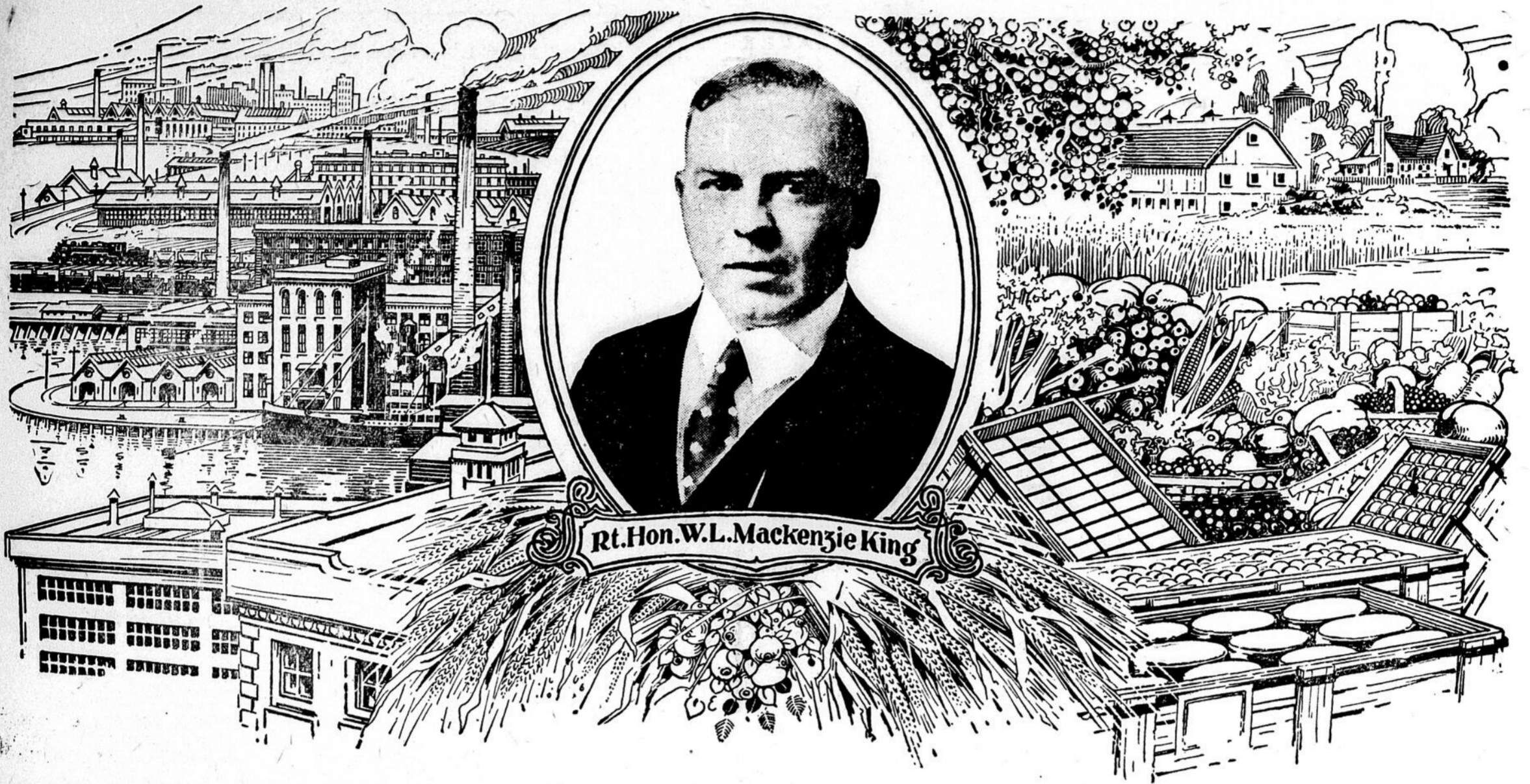
Rt. Hon. W.L. Mackenzie King