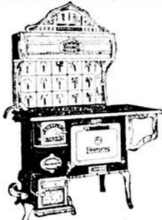
Fabriqués par The Enterprise Foundry Co., Limited, Sackville, Nouveau-Brunswick.