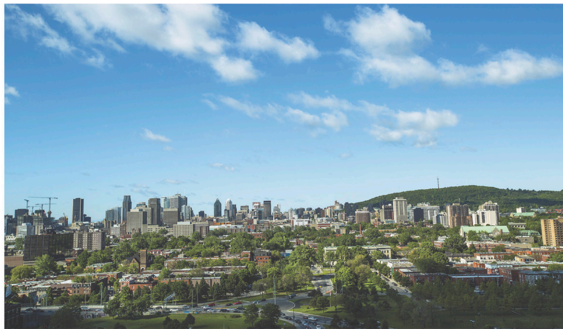
PEDRO RUIZ LE DEVOIR

«Nous avons eu une grande mobilisation lancée par les jeunes avec le printemps érable, nous avons eu Occupons Montréal et, auparavant, on