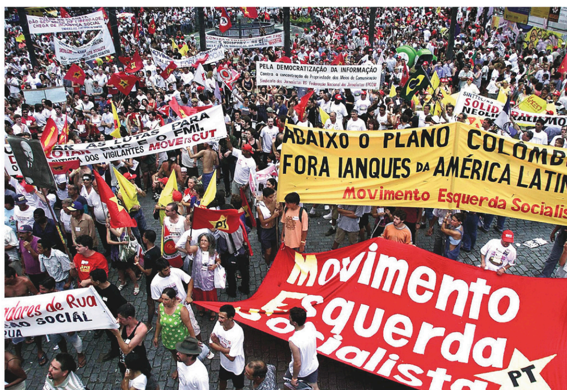
La ville de Porto Alegre, dans le sud du Brésil, a accueilli le tout premier Forum social mondial en 2001. Chaque édition s'ouvre par une traditionnelle marche rassemblant tous les participants.

L'histoire du Forum social mondial n'est pas un long fleuve tranquille. Au contraire, elle a toujours été au diapason des mouvements sociaux du monde, pour le meilleur et pour le pire. Pierre Beaudet décrit les «phases» que le FSM a dû traverser. D'abord, celle des gouvernements socialistes latino-américains. L'enthousiasme suscité par l'arrivée de Hugo Chávez au pouvoir (1999) était encore frais en mémoire au moment du pre-