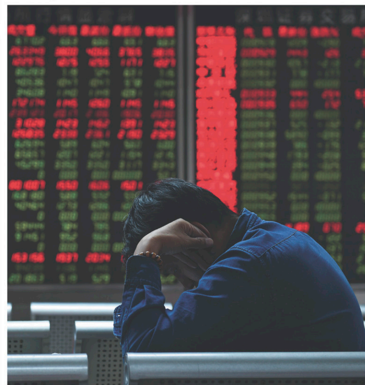
Une des conséquences du néolibéralisme a été l'instauration d'une économie basée sur le capital et la finance, et non plus sur le travail.