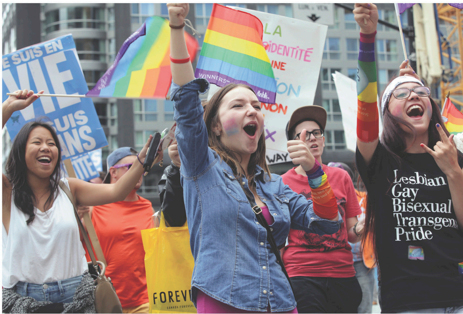
Le 11 août se tiendra la grande conférence de la semaine, qui portera sur la lutte contre l'homophobie à l'échelle internationale. Elle se tiendra en soirée à la Grande-Place du Complexe Desjardins.