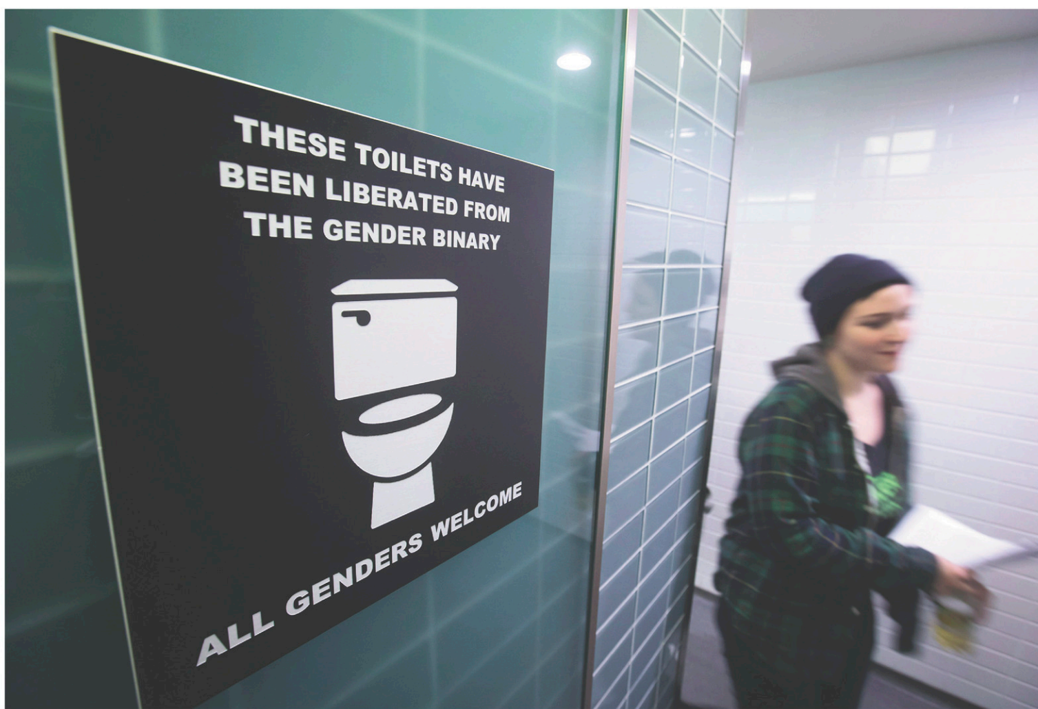
Le comité DGS a veillé à ce que des toilettes non genrées soient accessibles aux participants tout au long du FSM. Certaines institutions, comme l'Université Simon Fraser, à Burnaby en Colombie-Britannique, ont adopté des toilettes neutres pour leurs étudiants.

« Les gens qui évolueront au sein de notre espace devront respecter notre charte »