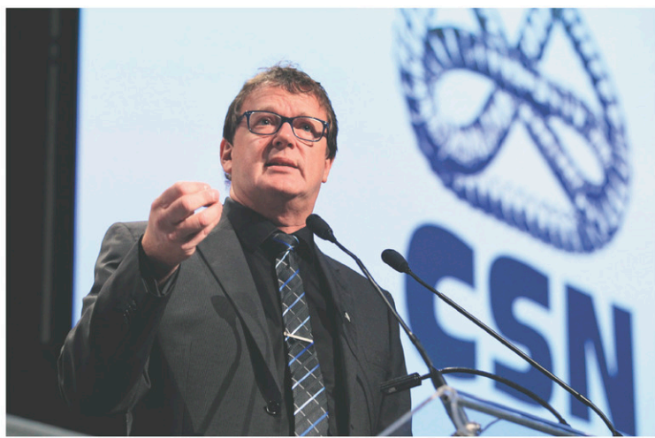
Jacques Létourneau, président de la CSN

L'accès à la négociation et les politiques d'austérité — issues du néolibéralisme pratiqué aujourd'hui par de nombreux pays — seront aussi parmi les sujets traités. «On est chanceux