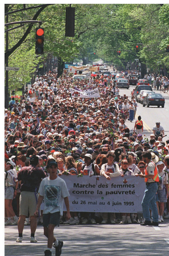
La Marche du pain et des roses, entre Montréal et Québec, en 1995, a donné naissance à la Marche mondiale des femmes en 2000.

Le FSM réunit différents groupes; on pense aux écologistes, aux altermondialistes et à de nombreux mouvements citoyens qui luttent contre le racisme, l'intégrisme religieux, le capitalisme, etc. Parmi ces groupes, quelle est la place du mouvement féministe? Au FSM, il existe un comité féministe auquel participent la FFQ et la Coordination du Québec de la marche. De plus, différentes actions ont été entreprises pour créer des lieux de convergence féministes, pour participer à des ateliers auto-gérés, etc. « Il y a aussi la Casa Feminista, un espace qui est disponible pour les féministes et tout au long du Forum; on s'y réunit quand bon nous semble. Il va y avoir des prestations artistiques, de la création de bannières pour la marche de clôture, de la bouffe... Ce sera un lieu d'échanges. » Dans cet espace, la FFQ organisera un 6 à 8, où on pourra échanger sur les thématiques de la prochaine marche des