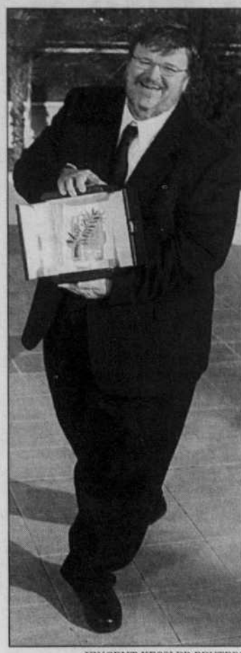
Michael Moore

Michael Moore est un homme drôle, engagé et courageux, dressé contre le président des États-Unis à ses risques et périls. Fahrenheit 9/11 , son pamphlet anti-Bush, follement applaudi au Palais, eut l'audace de dévoiler à ceux qui l'ignoraient encore que la Maison-Blanche menait en Irak une guerre sale pour de l'or noir, en cachant ses bas motifs au monde entier. Chevaucher une noble cause ne fait pas de Moore un grand cinéaste pour autant. Même si ses coups d'éclat peuvent épater, ce pamphlet demeure partiel dans son propos, brouillon dans sa facture, avec