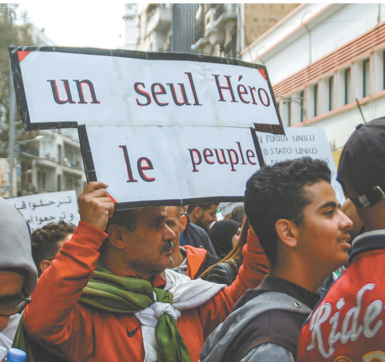
Le président Bouteflika a choisi d'abdiquer et de quitter le pouvoir dans la disgrâce, sous les cris d'une jeunesse souriante qui, depuis le 22 février dans les rues du pays, l'invite à « déguer ». L'histoire aurait pu se dérouler autrement, selon les experts.