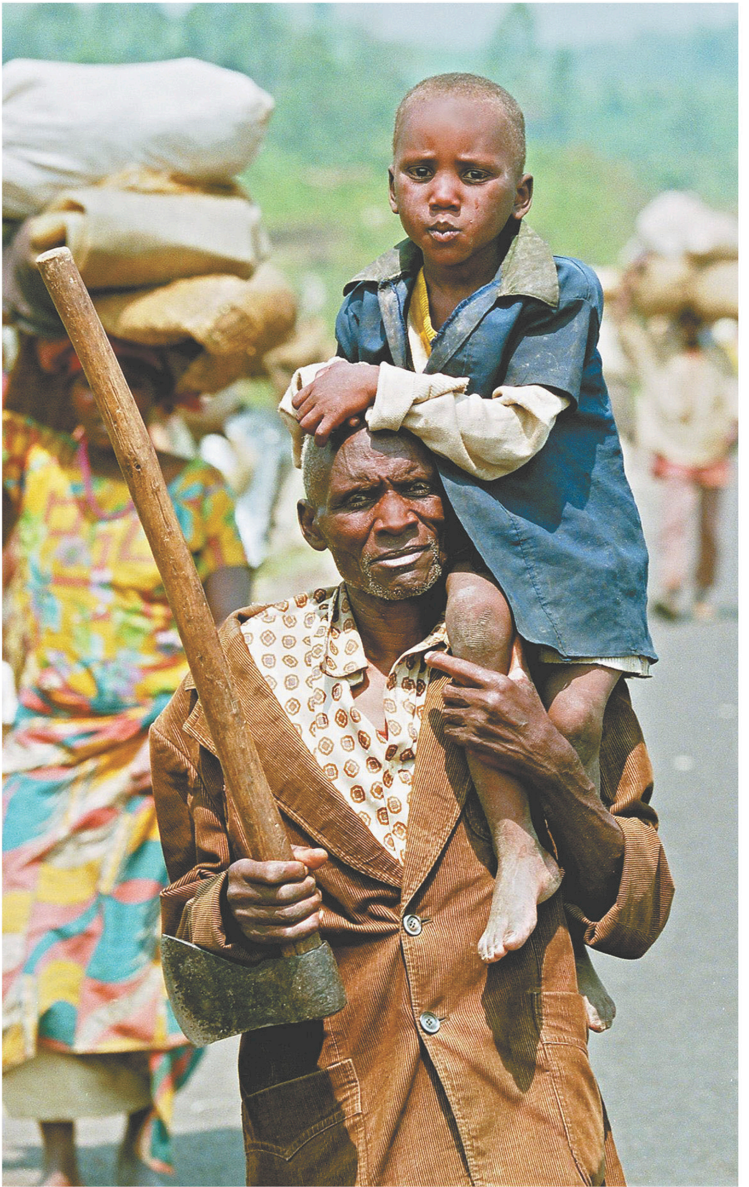
Un réfugié rwandais porte son fils sur le chemin vers Kigali, en juillet 1994.