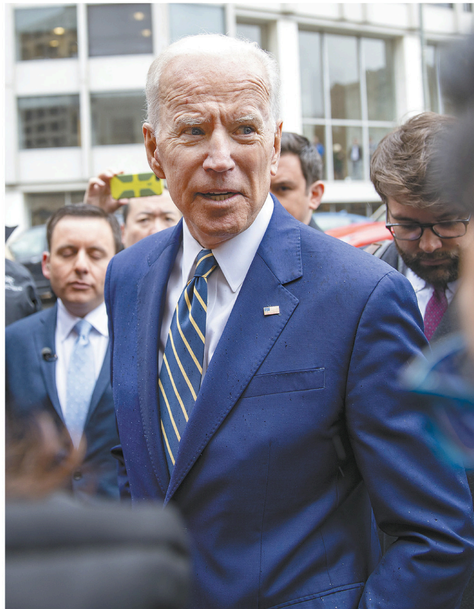
Joe Biden fait face depuis quelques jours à une controverse sur des gestes, comme des baisers ou des accolades, jugés trop appuyés par plusieurs femmes.

Devant les électriciens, il a ironisé sur la polémique en assurant avoir eu « la permission de faire l'accolade » au président du syndicat.