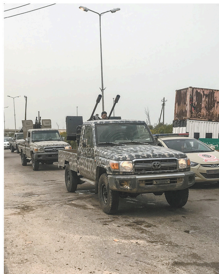
Un convoi du gouvernement de Fayez al-Sarraj est vu près de Tripoli, jeudi, à la suite d'affrontements à moins de 30 km de la ville.