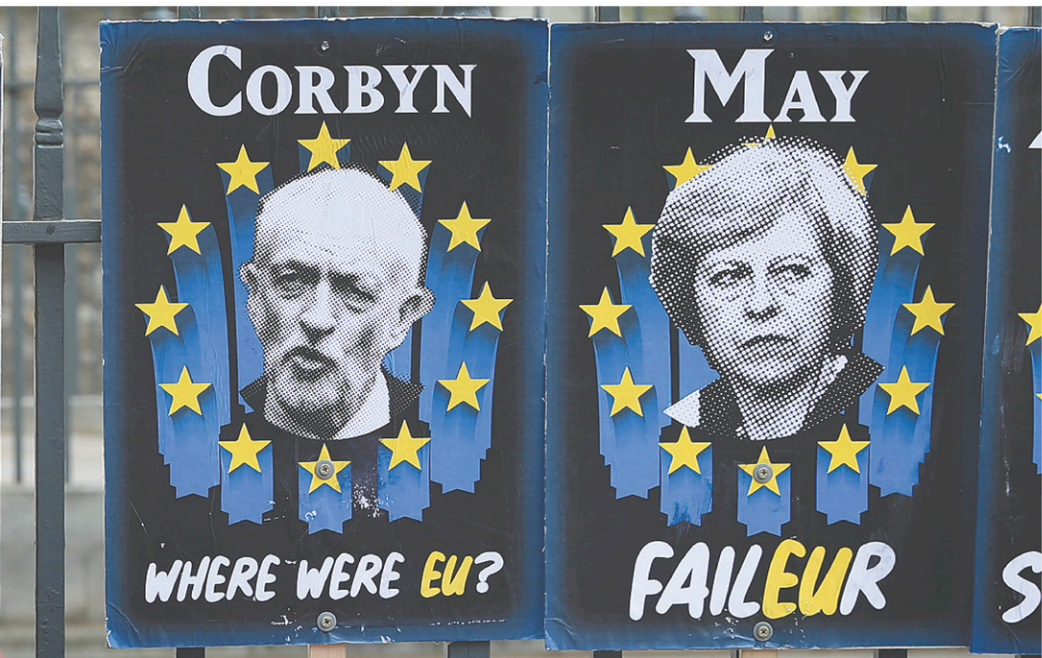
À moins d'une semaine de la date formelle de sortie et devant son incapacité à convaincre les plus radicaux de son parti, la première ministre a dû se résoudre à ouvrir des pourparlers avec le chef de l'opposition, Jeremy Corbyn.

Correction : Dans ma chronique de jeudi, j'ai écrit erronément que la Cour suprême avait acquitté Gabriel Nadeau-Dubois de l'accusation d'outrage au tribunal, en 2016, après qu'il eut été reconnu coupable à deux reprises. En réalité, un premier jugement de la Cour supérieure a été infirmé par la Cour d'appel, dont la Cour suprême a confirmé la décision. Toutes mes excuses.