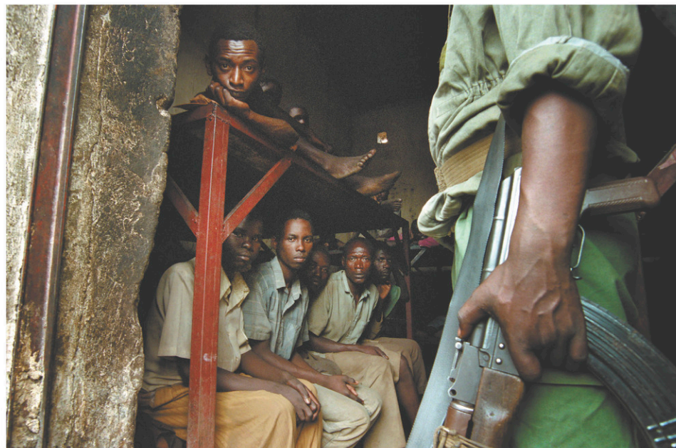
Un membre du FPR monte la garde d'une cellule de prison de Kibungo, en août 1994.

La station de Radio-télévision libre des mille collines (RTL), connue comme Radio Machette, est devenue un battement de tambour appelant à prendre des mesures contre l'ennemi inkotanyi (infiltré) de l'Ouganda et les inyenzis (cafards). Ses émissions accusaient les Tutsis d'être des parasites comploteurs. Elles ressassaient la vieille domination tutsie et entretenaient une peur d'une insurrection ar-