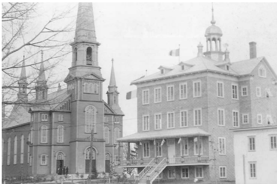
Église et ancien couvent de Saint-Édouard-de-Lotbinière.