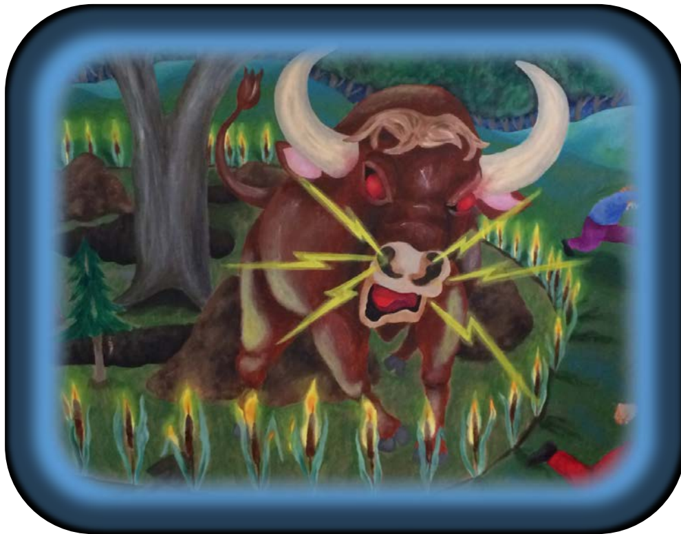
Le taureau endiablé dans la légende du chaudron d'argent de Lotbinière Légendaire , p. 30. Illustration de Béatrice Leclercq, peinte en collaboration avec les élèves de 5 e et 6 e année de l'école de la Caravelle à Dosquet.

Il y a une vieille légende datant de 1930 qui relate la possibilité qu'un chaudron d'argent 10 soit enseveli quelque part sur les terres du rang de Bois-de-l'Ail. Est-ce l'ancienne mine de cuivre de Black River qui a donné naissance à cette légende?