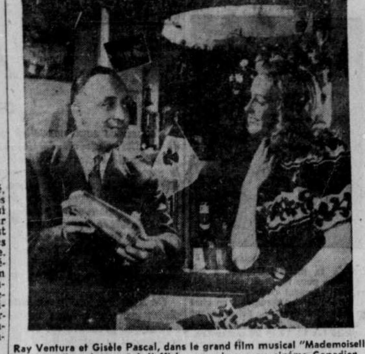
Ray Ventura et Gisèle Pascal, dans le grand film musical "Mademoiselle s'amuse".