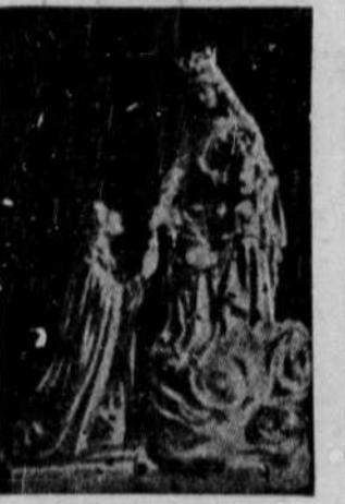
PRIERE EFFICACE A

La reproduction de cette prière a été payée par un vendeur d'automobiles de Montréal pour faveurs "extraordinaires" reçues de MARIE REINE DES COEURS, dont le sanctuaire est situé à Saint-Théodore de Chertoux, comté de Montcalm, avec promesse de publier dans l'espérance qu'elle bénirait à l'avenir.