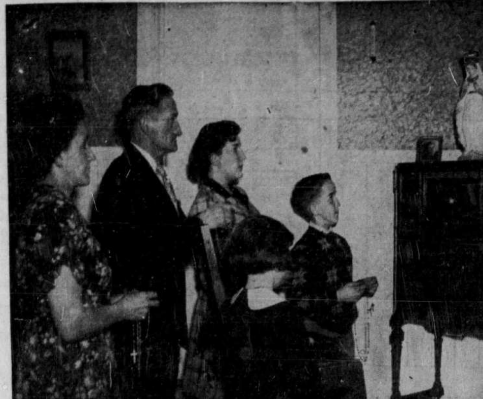
Par le chapelet quotidien, votre foyer sera plus chrétien.