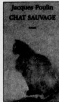
Jacques Poulin CHAT SAUVAGE

Le Vieux-Québec arpenté dans tous les sens, humé, vécu au jour le jour. Tel est le cadre de Chat sauvage de Jacques Poulin qui écrit à Paris des histoires dont le coeur bat à Québec. Le protagoniste, cette fois-ci, est un écrivain public dont la vie coule doucement jusqu'à ce qu'un vieil homme lui demande d'écrire une lettre à sa femme qui l'a quitté. Jacques Poulin distille pour la première fois dans son oeuvre un parfum de polar. Il nous donne envie de baguenauder avec lui dans les dédales intra-muros de la capitale. On retrouve, dans ce livre, l'univers tout en nuances de l'écrivain. (Leméac, 189 p.)