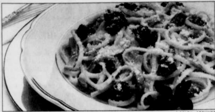
Les pâtes sont recommandées pour des activités longue durée.