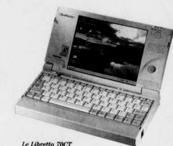
Le Libretto 70CT

Le Libretto est conçu pour fonctionner sous Windows 95 et non sous Windows CE comme d'autres minis. L'écran est de 6,1 po, à matrice active, capable d'afficher en SVGA 16,7 millions de couleurs en 640x480. Le clavier est plus petit que