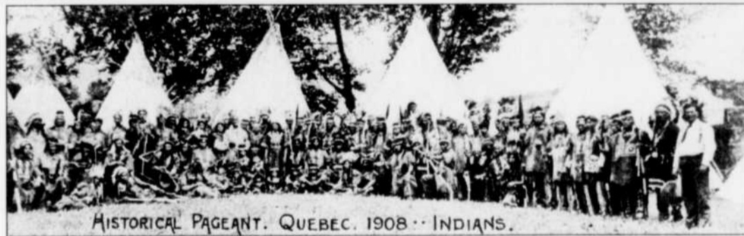
HISTORICAL PAGEANT, QUEBEC, 1908 · INDIANS.