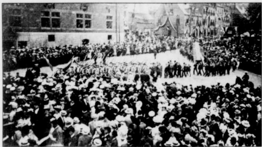
La fête grandiose de Champlain, le 19 juillet.

Les fêtes et les célébrations s'étendront de la fin juin à la fin juillet. Les Québécois de l'époque en parleront toute leur vie.