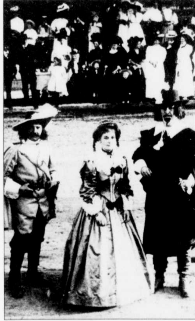
4500 acteurs et figurants portent les costumes d'époque lors des huit reconstitutions historiques ou «pageants».

Une délégation se rend à Ottawa afin de demander l'appui financier du gouvernement. Wilfrid Laurier reçoit la délégation avec son charme coutumier. Il ne dit ni oui, ni non, cependant. La Ville de Québec interprète cela comme une