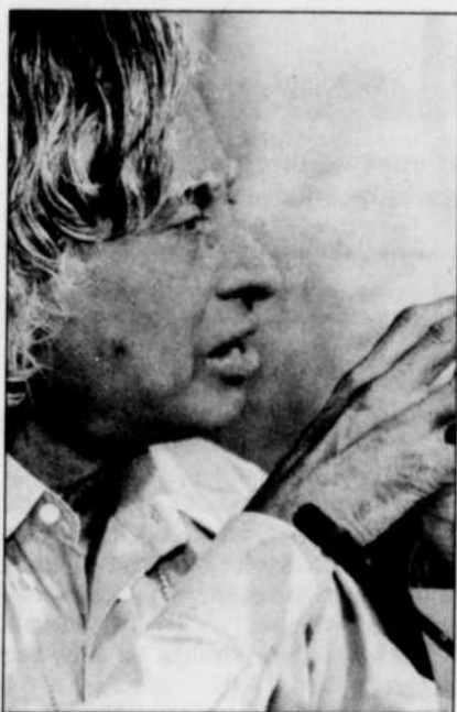
A.P.J. Abdul Kalam est scientifique et aussi poète à ses heures.

Sa philosophie est à la pointe de la modernité