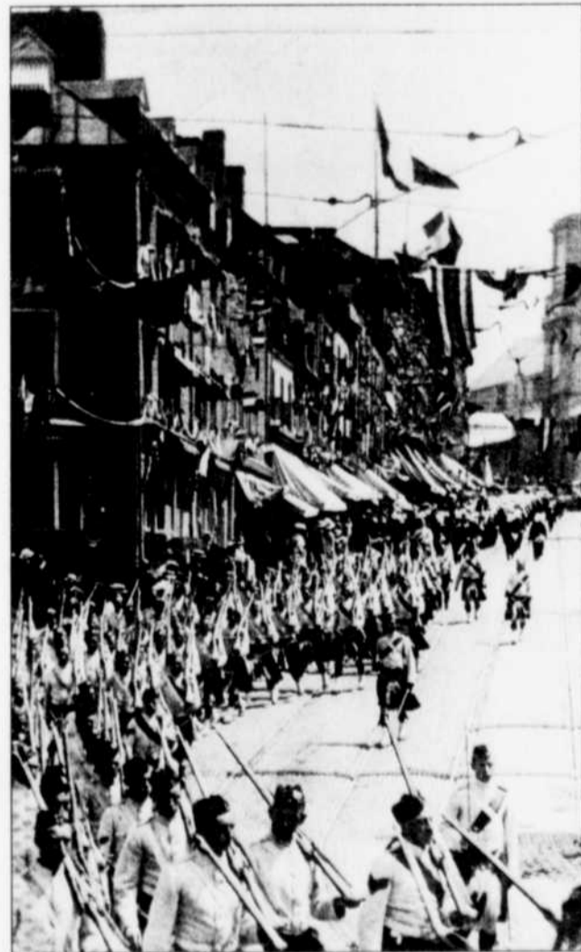
Quelque 15 000 soldats accompagnent les délégations officielles. Ici, une parade dans la côte de la Fabrique où les maisons croulent sous les drapeaux et décorations.