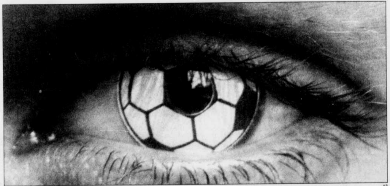
En optométrie, il n'y a pas de limite à l'imagination. Cette lentille dessinée au motif du ballon de soccer a de quoi séduire les mordus de football qui, pour la coupe du monde, voudront se distinguer.