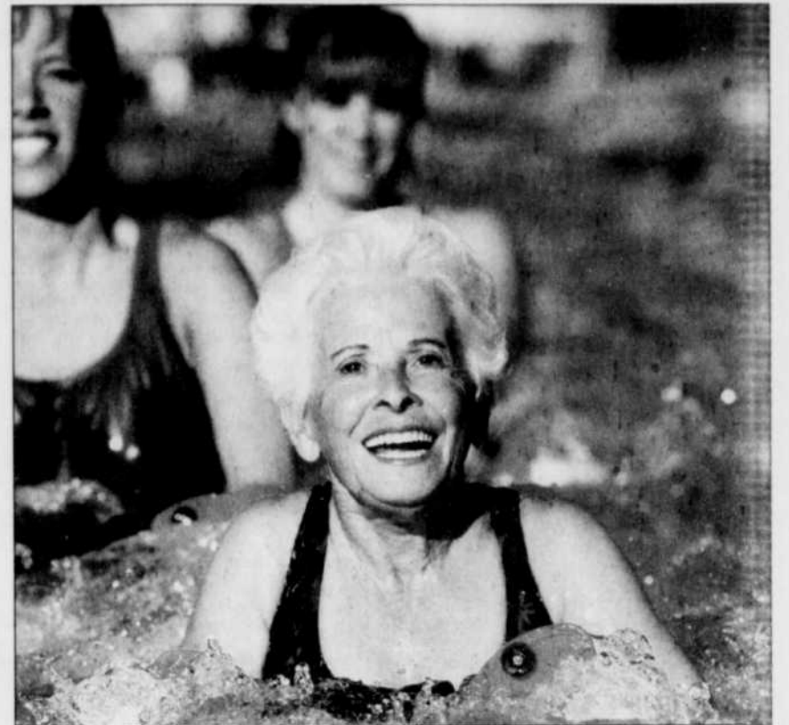
Nager est une activité qui garde en forme et qui se pratique à tous âges.

Revoquez la place que vous désirez accorder à l'activité physique dans votre mode de vie. Si ça demeure important de vous mettre en forme, réservez à l'agenda des périodes intouchables. Fixez-vous des objectifs réalistes. Trouvez des objets de motivation. Aimerez-vous vous inscrire à un cours,