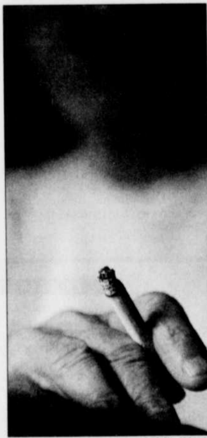
L'alcool, la cigarette, le jeu pathologique seraient des moyens d'anesthésier les souffrances liées à une dépendance affective ou émotive.