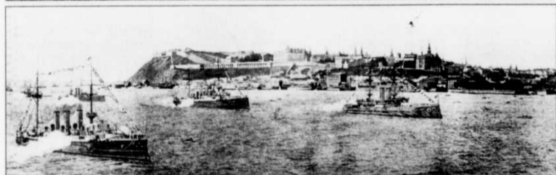
Treize navires de guerre mouillent pacifiquement dans le port de Québec.