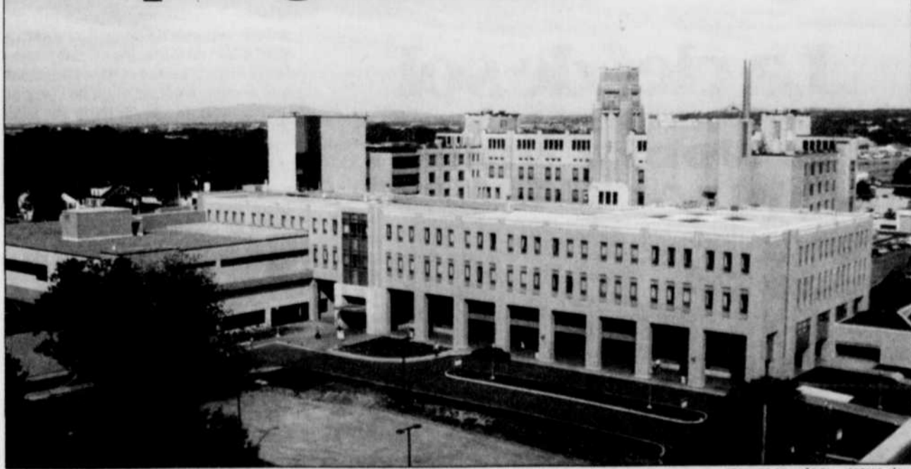
L'hôpital de L'Enfant-Jésus, à lui seul, compte 18 ailes et bâtiments.

Aujourd'hui, l'hôpital de L'Enfant-Jésus forme, avec l'hôpital Saint-Sacrement, le Centre hospitalier affilié universitaire (CHA). Ce mégacomplexe de santé fonctionne avec un budget annuel de 188M$, regroupe plus de 5000 employés et près de 1600 lits.