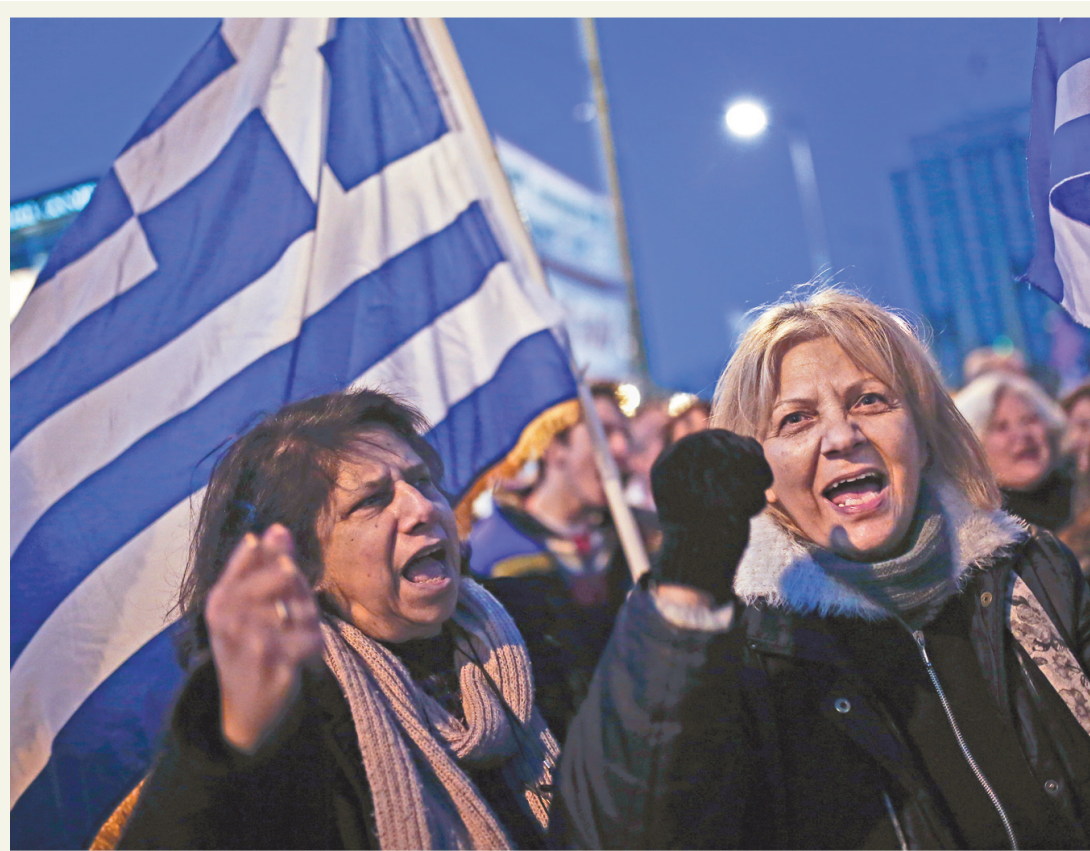
ANGELO TZORTZINIS AGENCE FRANCE-PRESSE