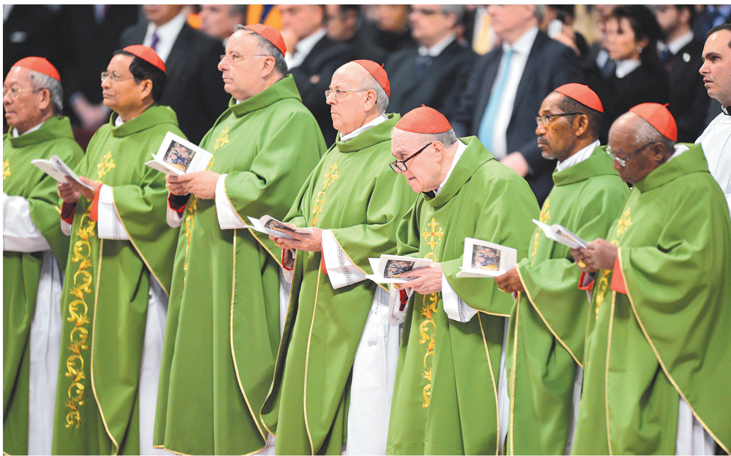
Les cardinaux prenant part à la messe papale, dimanche, à la basilique Saint-Pierre de Rome.

« Les chrétiens ne doivent pas s'isoler dans une caste! », s'est-il exclamé, critiquant la logique