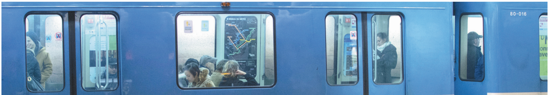
MICHAËL MONNIER LE DEVOIR

Entre les projets d'autobus rapide sur Pie IX, la promesse d'un Train de l'Ouest et le prolongement de la ligne bleue, de grands projets nécessitent un leadership clair.