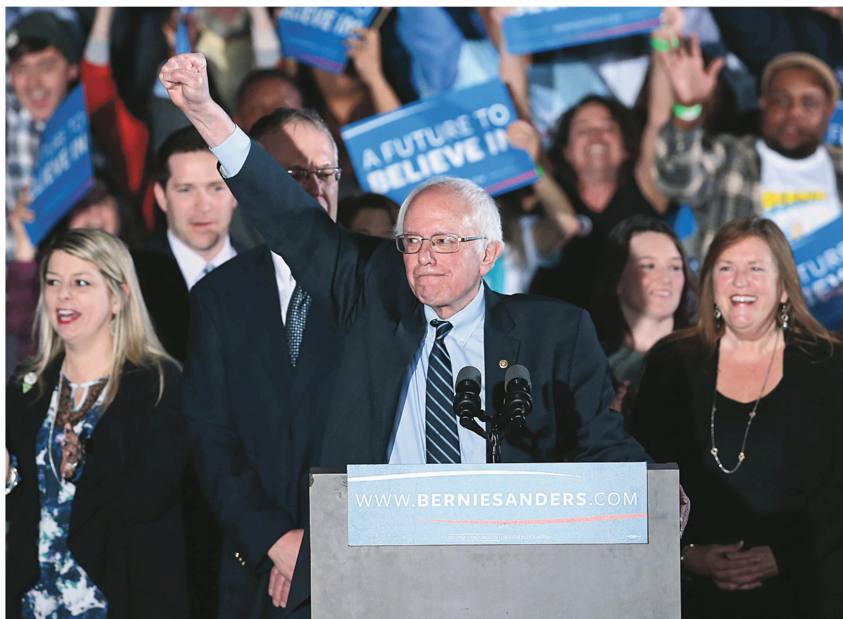
Le sénateur démocrate du Vermont, Bernie Sanders, promet une révolution politique.