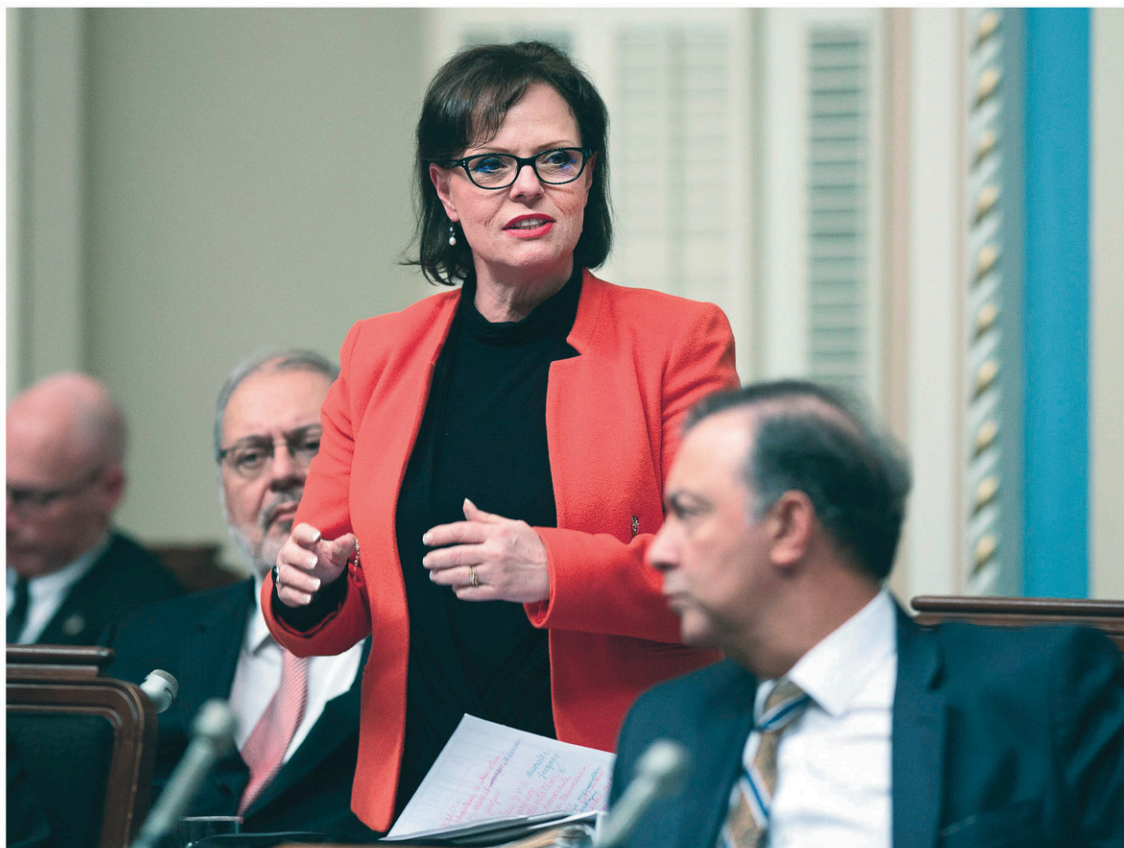
« Si on ne peut pas enrayer complètement le proxénétisme, (on cherchera), à tout le moins, à le réduire de façon importante », a dit Lucie Charlebois, qui n'a voulu nommer aucun moyen envisagé.

La loi actuelle interdit aux centres jeunesse d'empêcher les jeunes d'aller et de venir à leur guise. Selon des intervenants consultés par Le Devoir , cette « liberté » s'explique par l'importance de mettre l'ac-