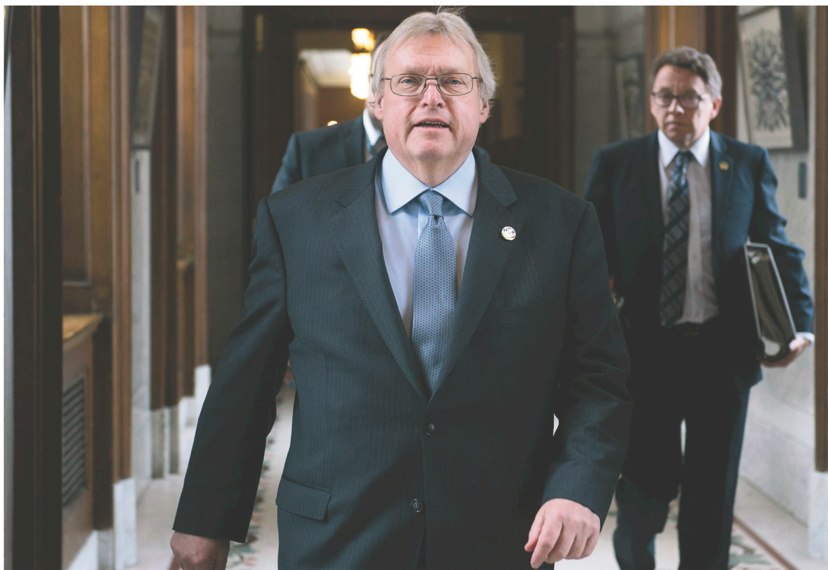
JACQUES BOISSINOT LA PRESSE CANADIENNE

fpelletier@ledevoir.com Suivez-moi sur Twitter: @fpelletier1