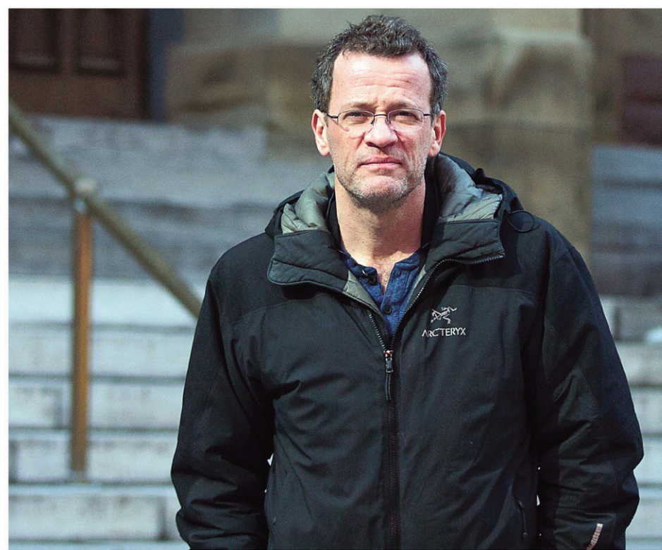
L'écrivain Yann Martel