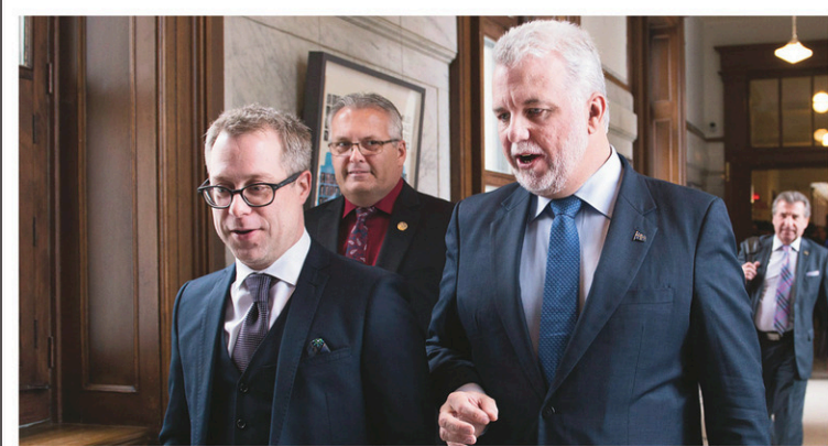
Les fonctionnaires obéissent aux ordres du gouvernement, a déclaré mardi le premier ministre Philippe Couillard.