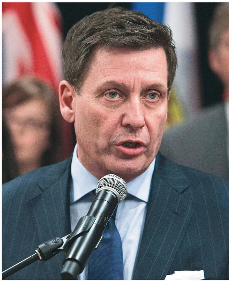
Pas question pour le nouveau ministre de l'Éducation, Pierre Moreau, de désavouer le travail de son prédécesseur, assure-t-on.

«Évidemment, les auditions ont été retardées de quelques jours en raison de l'état de santé du ministre. Le plan de match continue, on va faire les consultations et poursuivre le processus habituel. Il n'y a pas de modification par rapport au projet de loi de décembre», qui abroge les élections scolaires et remplace le conseil des commissaires par un conseil