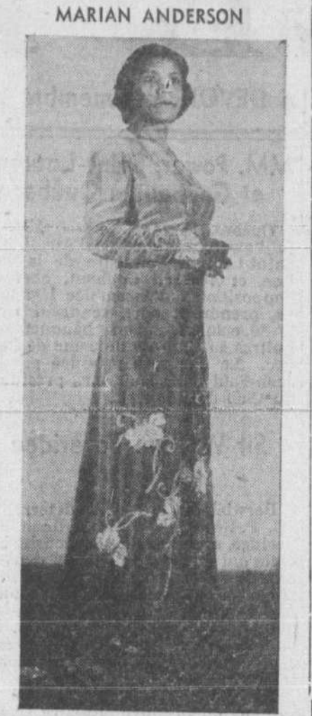
Marian Anderson, contralto, que nous entendons en récital vendredi 27 octobre au St-Denis...