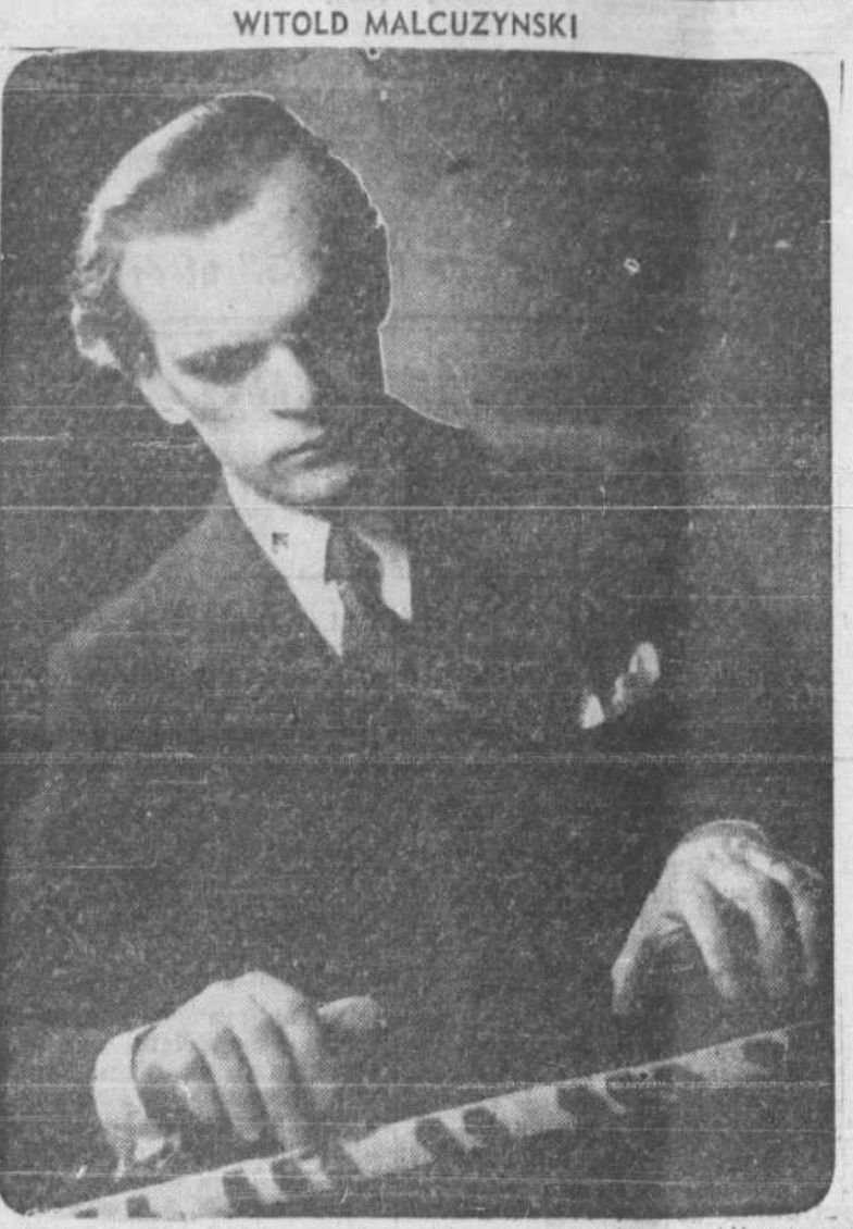
Witold Malcuzyński, pianiste, que les critiques montréalais considèrent comme l'un des plus grands virtuoses jamais entendus dans la métropole...