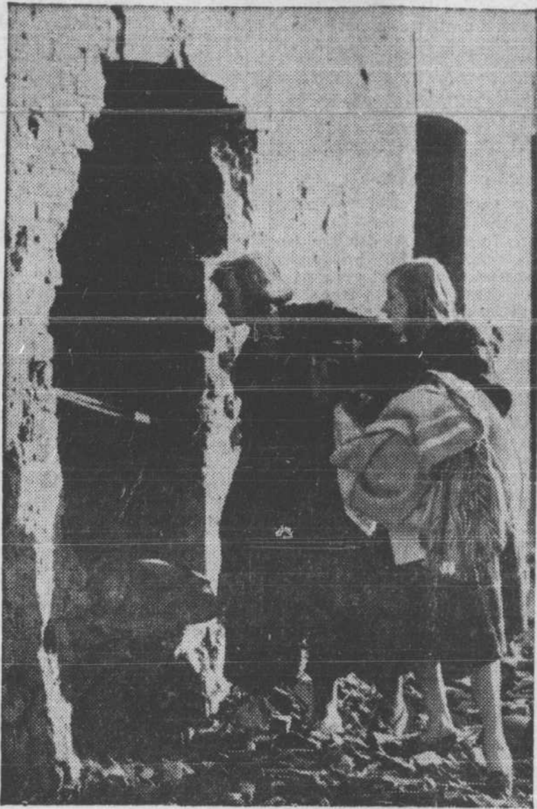
Des scènes comme celle-ci sont courantes en Europe où la guerre et les bombardements ont semé leur ravage. En Angleterre seulement, plus d'un million de maisons ont été endommagées ou complètement détruites par les bombes.