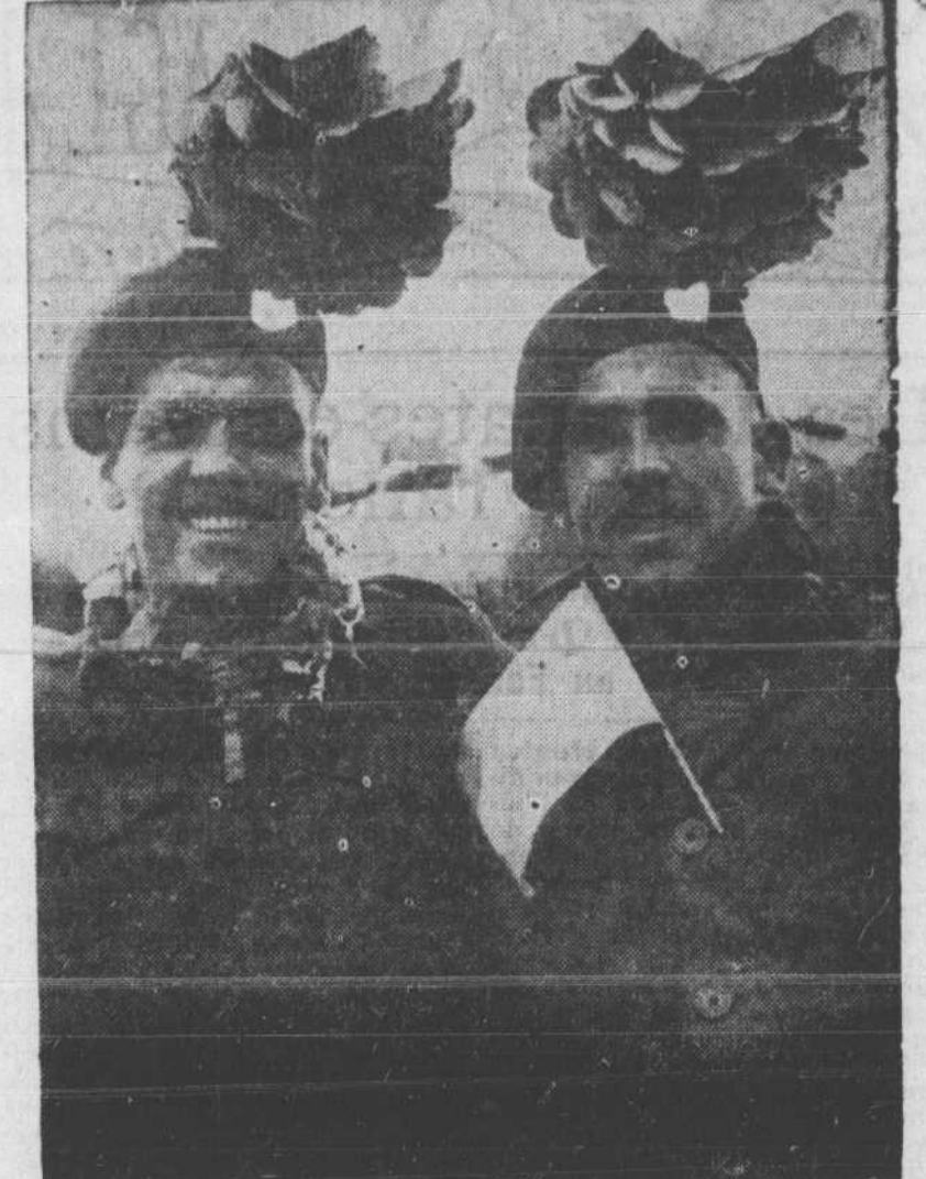
Ces deux copains en ont vu de dures — ils font partie d'un fameux régiment tanks du Canada... mais ils aiment quand même la plaisanterie. Lorsque le photographe de l'Armée canadienne les a croqués devant leur char d'assaut quelque part en Hollande, ils avaient décoré leurs bécots d'une énorme fleur hollandaise, et agrémenté leurs uniformes de fantaisies pas tout à fait réglementaires.