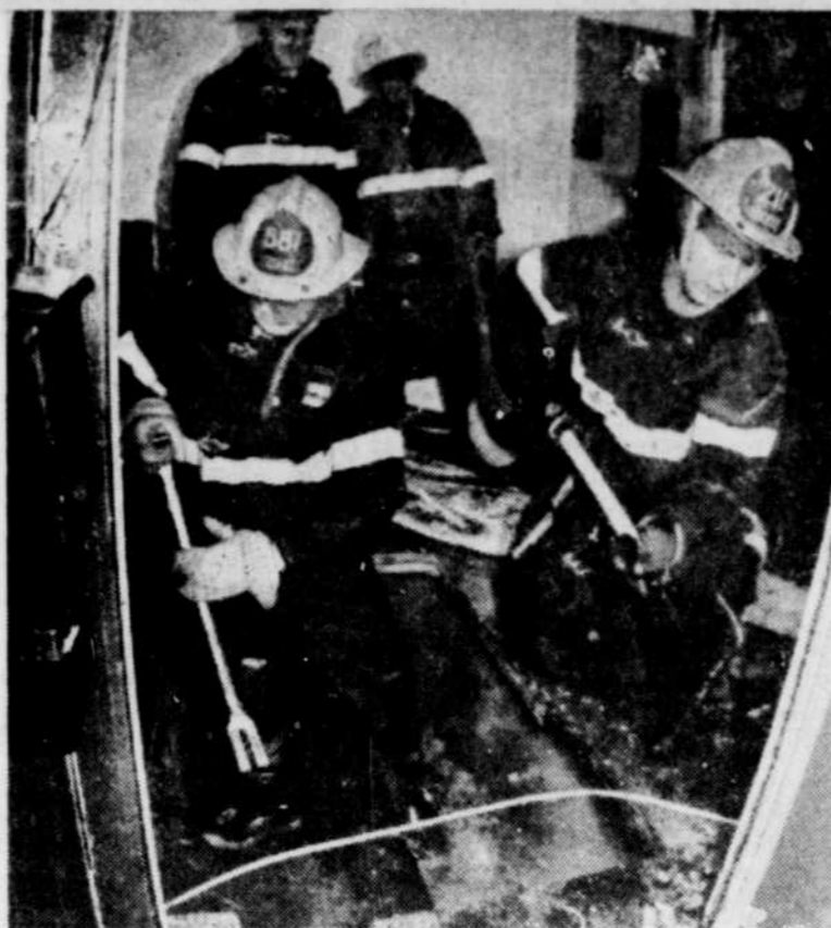
Les sapeurs ont dû éventrer le plancher à la hache pour atteindre le foyer d'incendie de l'usine.

Dans ses remarques, le juge note que le policier n'était pas justifié de tirer dans le "noir", que sa sécurité n'était pas menacée et qu'il n'avait aucune raison de croire que Lapolice était armé.