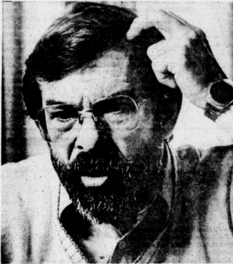
Le français est devenu une langue qui accorde plus d'importance aux exceptions qu'aux règles de base, dit Conrad Bureau.

Le Québec ne présente pas non plus un cas d'exception, ajoute-t-il. Une étude menée par FFSL Prisley au Canada anglais révèle que dans 75 pour 100 des cas, les professeurs des universités estiment que les étudiants du premier cycle arrivent à l'université sans posséder la connaissance minimum de leur langue qu'on attendrait d'eux. Aux États-Unis, la UCLA (University of California in Los Angeles) dépensera $1 million pour améliorer la qualité de l'anglais chez ses élèves et aussi à aider les enseignants de niveau secondaire.