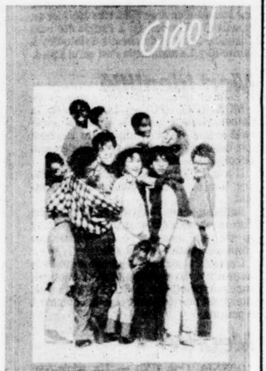
Le calendrier multi-ethnique distribué par le ministère québécois des Communautés culturelles et de l'immigration.

Les autres fêtes indiquées pour janvier dans le calendrier sont: la Sibiriki (le 19, en Tchecoslovaquie), l'indépendance de l'Ukraine (le 22), la fête de l'Unité (le 24, mais célébrée le 27, en Roumanie), la Sainte-Tatiana (le 25, en Russie, alors que le bal qui la couronne n'aura lieu que le 27), le Burn's Night (le 25, en Écosse), la fête de l'Union indienne (le 26) et le Saint-Sava (le 27, chez les Serbes).