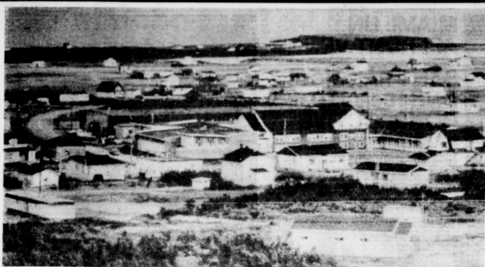
Le centre du village de Fatima.