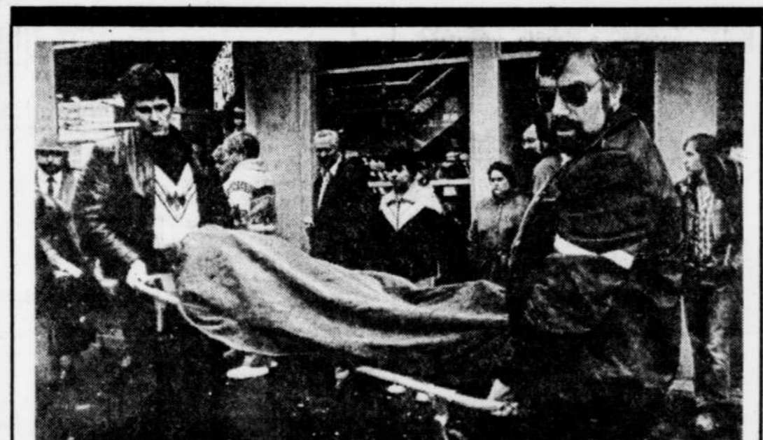
Voleur québécois tué