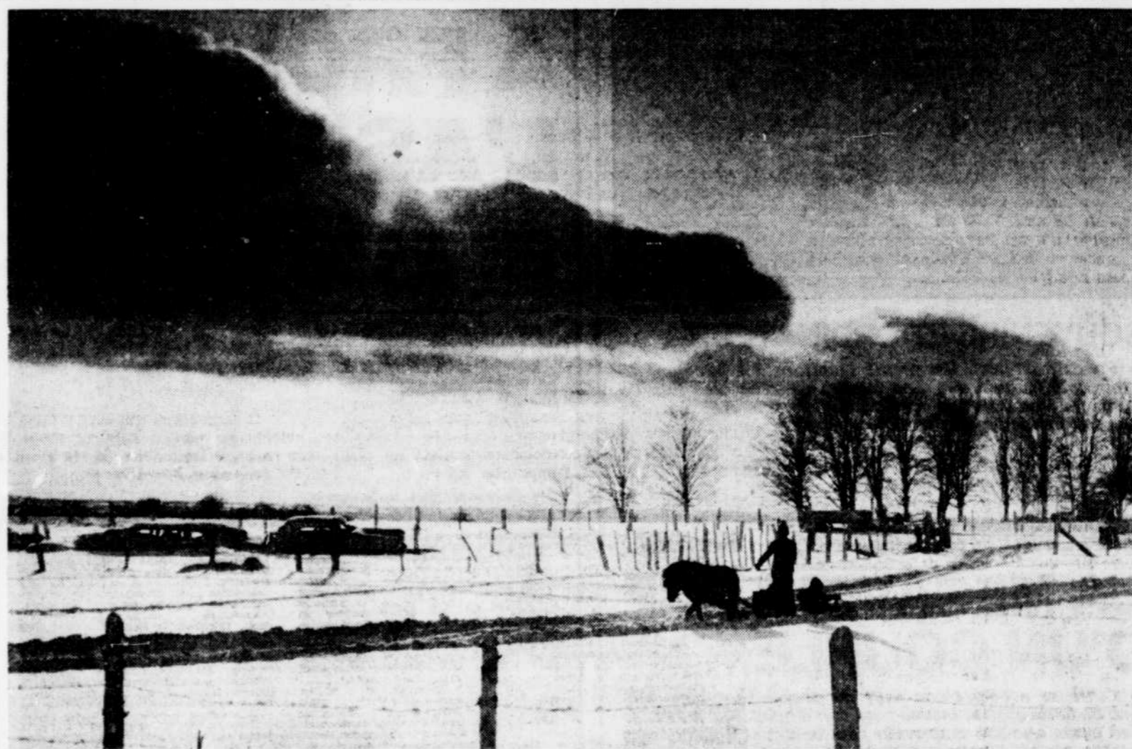
Le Soleil, Reynald Lavoie