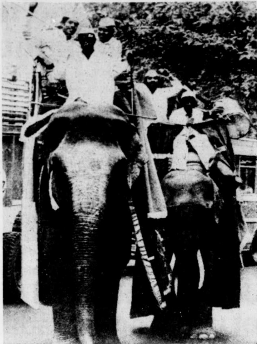
Les manifestations de joie à la suite de la victoire de Rajiv Gandhi ont pris, hier, toutes sortes de formes, ainsi que le prouve cette photo de membres du parti du Congrès, qui ont fait le tour de Delhi à dos d'éléphant.