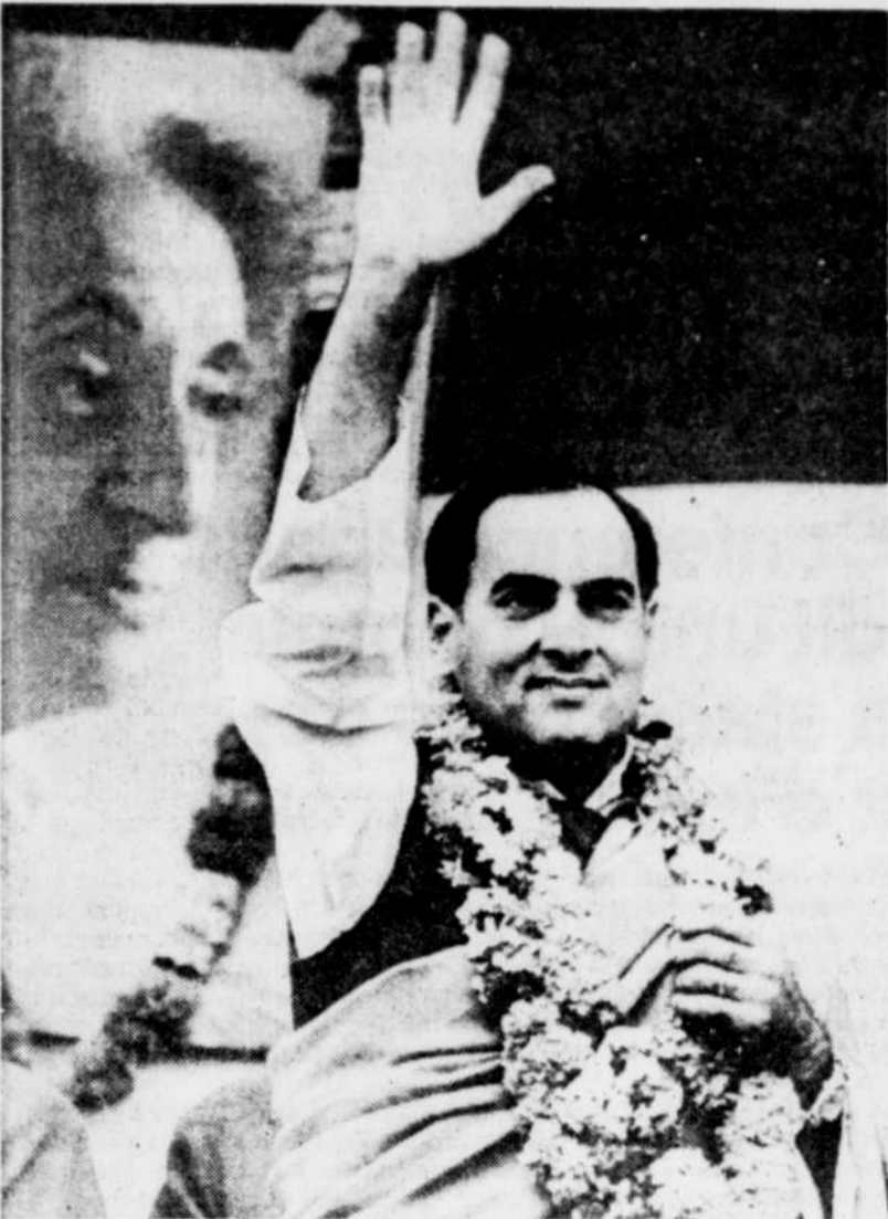
Sous le portrait de sa mère Indira, Rajiv Gandhi salue triomphalement ses supporters au cours d'une assemblée tenue, hier, à Delhi, au moment où il devenait évident que sa victoire se transformait en raz-de-marée.