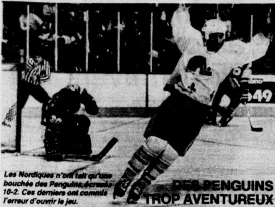
Les Nordiques n'ont fait qu'une bouchée des Penguins, écrasés 10-2. Ces derniers ont commis l'erreur d'ouvrir le jeu.