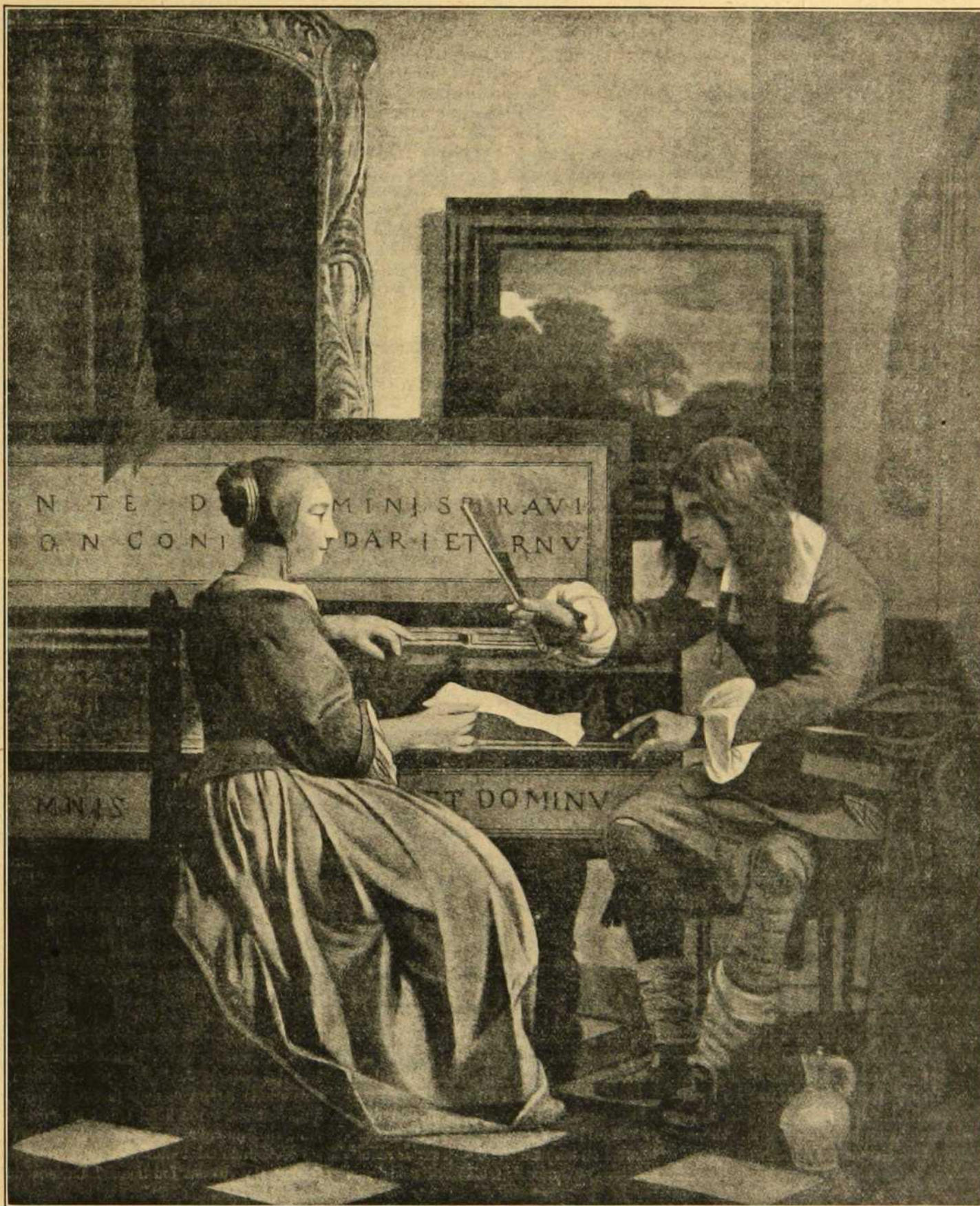
La leçon de musique