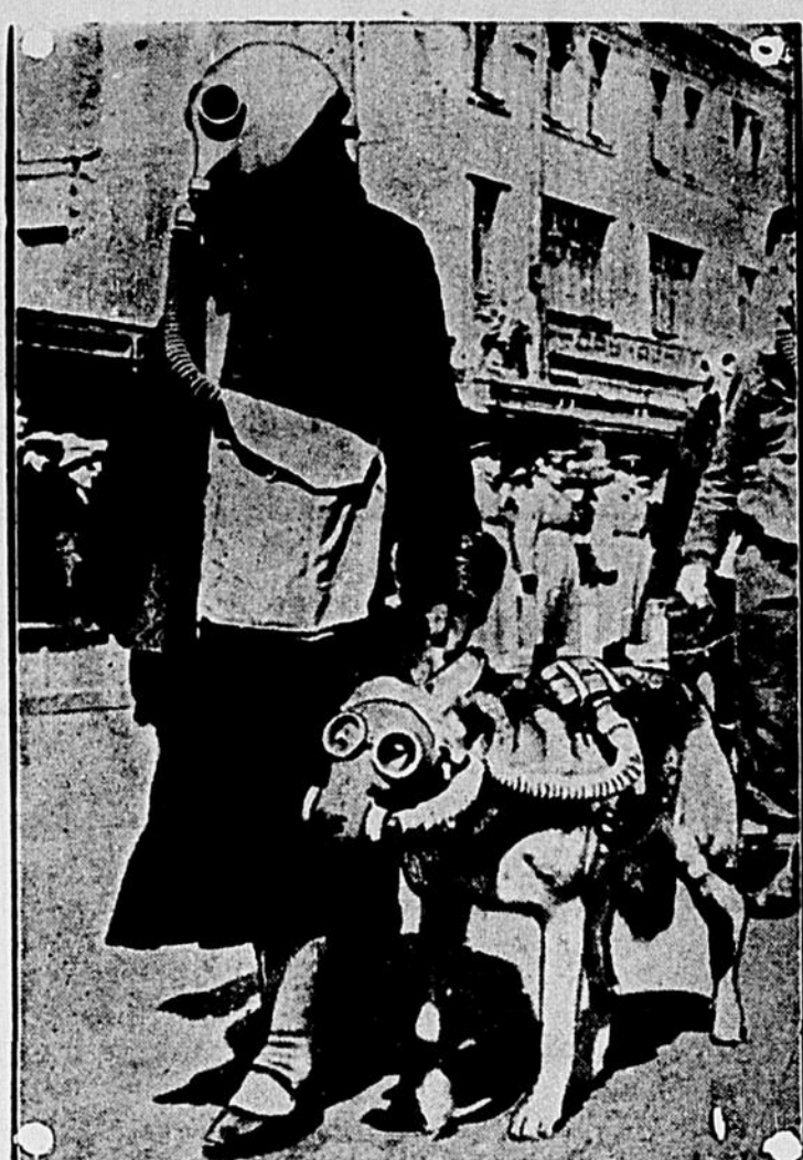
Comment hommes et chiens se promèneront dans les rues désormais dès qu'une guerre aura été déclarée. Les masses à gaz formeront un attrait tout naturel. Quelle belle ère nous vivrons!