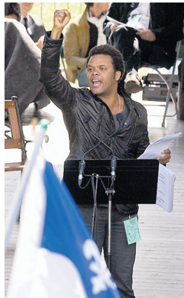
Luck Mervil