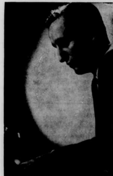
Le jeune pianiste autrichien Friedrich Gulda qui jouera le troisième concerto de Beethoven avec l'Orchestre des Concerts symphoniques de Montréal.

ditions de ce concerto sont si peu fréquentes qu'il faut se réjouir de pouvoir l'entendre. L'oeuvre est légère, sans prétention et contient de fort belles pages.