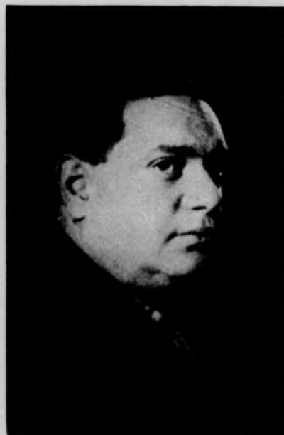
DARIUS MILHAUD, dont on entendra l'opéra "Christophe Colomb", au prochain concert de l'orchestre symphonique de New-York, sous la direction de Mitropoulos. On sait que le texte est de Paul Claudel.