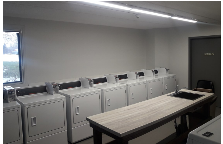
BUANDERIE DE LA RÉSIDENCE CHOMEDEY