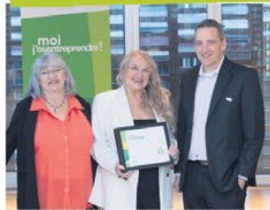
Boutique Mine DeRien/Friperie Josée Pellissier MRC de la Vallée-de-l'Or