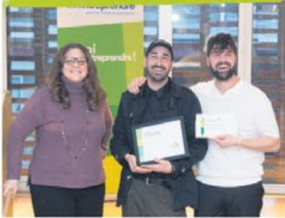
Productions AdéquaT Shawnee Jacques-Godard et Guillaume Laroche Ville de Rouyn-Noranda